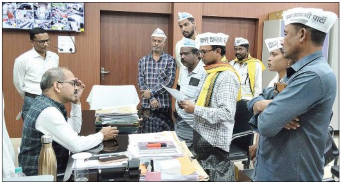
ସମୟରେ ଯେଉଁ ବ୍ୟାଙ୍କରେ ଖାତା ଦେଇଥିଲେ ସେଠାକୁ ଟଙ୍କା ନଆସି ଅଧ୍ୟା

ଓଡ଼ିଶାର ଭାରତୀୟ କୁହାଯାଉଥିବା ବରଗଡ଼ ଜିଲ୍ଲାରେ ଏବେ ଚାଷୀମାନଙ୍କ ଦୁଃଖ ଦିଗୁଣିତ ହୋଇଛି। ଖରିଫ ଧାନ ଫଂଗ୍ରହ ପାଇଁ ଗତ ନଭେମ୍ବର ୨୮ ରୁ ମଣ୍ଡି ଖୋଲିଛି। ହେଲେ ଏପର୍ଯ୍ୟନ୍ତ ବହୁତ ଚାଷୀଙ୍କ ଟୋକନ ନିଆଯିବା, ବ୍ୟାପକ କଟନାକ୍ଷରଣ ଏବଂ ଠିକ ସମୟରେ ପ୍ରାପ୍ୟ ନମିଳିବା ଓ ମଜୁର ଗତିରେ ଧାନ ଉଠିବା ଚାଷୀଙ୍କ ଦୁଃଖକୁ ବଢ଼ାଇ ଦେଇଛି।