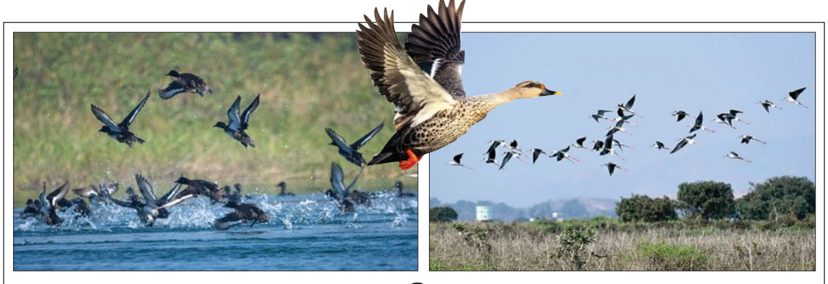
ହୀରାକୁଦ ଆବୁକୁମ୍ଭରେ ପକ୍ଷୀ ଗଣନା