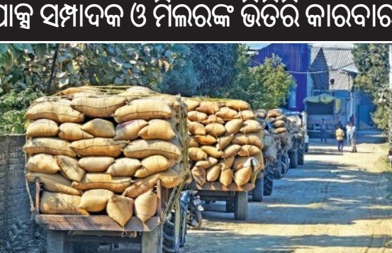
ପାଣ୍ଡ ସଫାଦକ ଓ ମିଲରକ ଭିଡିରି କାରବାର

■ ବଲାଙ୍ଗିର, ୨୦୧୧(ସମିସ): ମଣ୍ଡିରୁ ଧାନ ଉଠୁନି। କିନ୍ତୁ, ମିଲ୍ ଆଗରେ ଧାନକଣ୍ଡା ଭରି ଟ୍ରାକ୍ଟର ଲମ୍ବା ଧାଡ଼ି। ବଲାଙ୍ଗିର ଜିଲ୍ଲାରେ କିଛି ମିଲ୍ ଆଗରେ ଏପରି ଦୃଶ୍ୟ ଏବେ ଚାଷୀଙ୍କ ଚିନ୍ତା ବଡ଼ାଇ ଦେଇଛି। କୃଷାଳ କୃଷାଳ ଧାନ ପକାଇ ମଣ୍ଡି ଆଗରେ ଚାଷୀ ଦିନରାତି ଅଧିଆ ପଡ଼ିଥିବା ବେଳେ ମିଲ୍କୁ କାହା ଧାନ ଯାଉଛି, ତାହା ଚାଷୀର ରୁଝିବା ବାହାରେ। ଧାନକିଣା ବିକ୍ରମର ଫାଇଦା ନେଇ ଧାନ ବେପାରୀ, ମିଲ୍ରେ ଓ ପାଣ୍ଡ ସଫାଦକ ମିଲିନି ଶବ୍ଦେ ନୂଆ ଗୋଲକଧନୀ ଆରମ୍ଭ କରିଥିବା ଚାଷୀ ମହଲରେ ଅଭିଯୋଗ ହୋଇଛି।