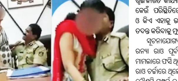
ସେହି ଭିଡିଓଟି ମୁଖ୍ୟମନ୍ତ୍ରୀ ସିଦ୍ଧେଶ୍ୱରୀଙ୍କୁ ଏହି ମାମଲାରେ କଡ଼ା ଆଭିମୁଖ୍ୟ ଗ୍ରହଣ କରିଛନ୍ତି । ସେ ଏହାର ଏକ ବିସ୍ତୃତ ରିପୋର୍ଟ ମାଗିଛନ୍ତି । ସିଦ୍ଧେଶ୍ୱରୀ କହିଛନ୍ତି ଯେ ତାଙ୍କୁ