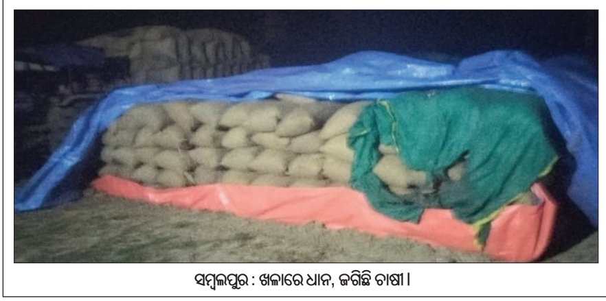
ସମ୍ବଲପୁର: ଖଳାରେ ଧାନ, ଜରିଛି ଚାଷୀ।