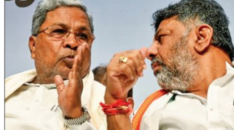
■ ରାହୁଲଙ୍କୁ କହିଲେ ସିଦ୍ଧରମେୟ ଓ ତିଳେ ■ ଭୃତ୍ୟ ସଂଶୟ ଦୂର କରାଯାଉ

ବ୍ୟର୍ଥ ଯାଏ ନାହିଁ ବୋଲି ତିଳେ କହିଥିଲେ। ପୂର୍ବରୁ ମୁଖ୍ୟମନ୍ତ୍ରୀ ପଦକୁ ନେଇ ହାଇକମାଣ୍ଡ ନିଷ୍ପତ୍ତି ନେବେ ବୋଲି କଂଗ୍ରେସ ଅଧ୍ୟକ୍ଷ ମଲ୍ଲିକାର୍ଜୁନ ଖଡ଼୍ଗେ କହିଥିଲେ। ସୂଚନାଯୋଗ୍ୟ ଯେ କଂଗ୍ରେସ ସରକାରକୁ ଅଟେଇ ବର୍ଷ ପୂରଣ ହେବା ପରେ ମୁଖ୍ୟମନ୍ତ୍ରୀ ବଦଳାଇବା ଦାବି ଜୋର ଧରିଛି। ସରକାର ଗଠନ ସମୟରେ ଅଟେଇ ବର୍ଷରେ ମୁଖ୍ୟମନ୍ତ୍ରୀ ବଦଳାଇବାକୁ ପ୍ରତିଶ୍ରୁତି ଦିଆଯାଇଥିଲା ବୋଲି ତିଳେ ଗୋଷ୍ଠୀର ବିଧାୟକ ଦାବି କରୁଛନ୍ତି।