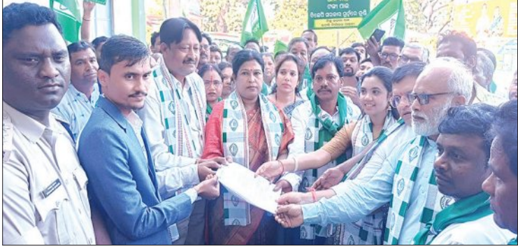
ସୋହେଲା, ୧୨/୧ (ସମ୍ପାଦକ)

ସୋହେଲାରେ ବିଜେଡିର ବିରାଟ ଚାଷୀ ସମାବେଶ ଯୋଗ ଦେଲେ ହଜାର ହଜାର ଚାଷୀ