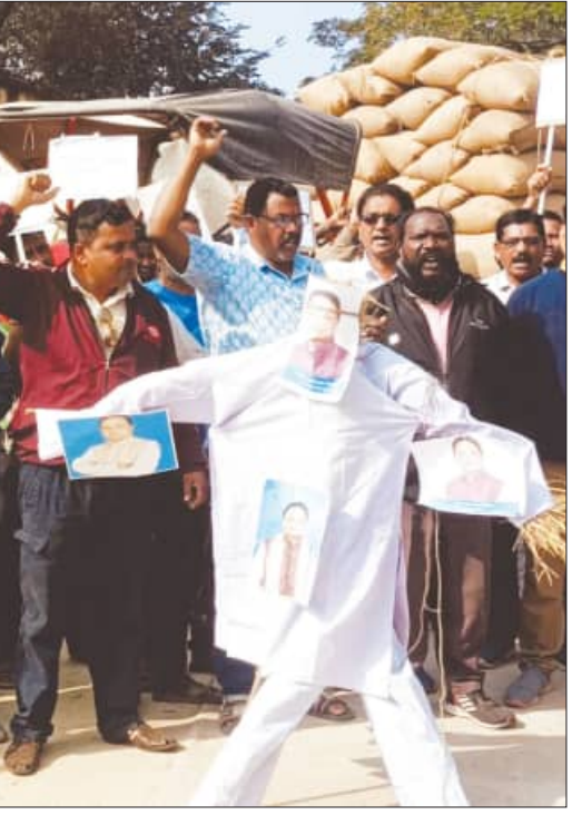
ମହଙ୍ଗା ପଡ଼ିଛି। ଯେତେବେଳେ ଉପମୁଖ୍ୟମନ୍ତ୍ରୀ କହିଲେ ଯେ ଚାଷୀ ରାଷ୍ଟ୍ର ଘାଟ ବନ୍ଦ କରି ନପକ ବିରୋଧ କରି ଏ ସରକାରକୁ ଉଚିତ ଜବାବ