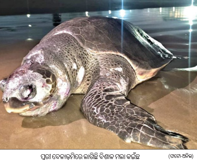
ପୁରୀ ବେଳାଭୂମିରେ ଲାଗିଛି ବିଶାଳ ମଲା କଇଁଛ

ବାଲିକୁଦା/ଅସ୍ତରଙ୍ଗ, ୨୪୧୧ (ସମିଧ): ବଙ୍ଗୋପସାଗର ଦେବାନଦୀ ମୁହାଣ ନଡ଼ିଆଖୁଆ ନିକଟରୁ ଏକ ବିଶାଳ ତିନିମାଛର ମୃତଦେହ ଉଦ୍ଧାର ହୋଇଛି । ମାଛର ଲମ୍ବ ୩୦ ଫୁଟରୁ ଉର୍ଦ୍ଧ୍ୱ ହେବ ବୋଲି ଜଣାଯାଇଛି । ମତ୍ସ୍ୟଜୀବୀମାନେ ତିନିକୁ ଦେଖି ବନ୍ଦର ସାମୁଦ୍ରିକ ଥାନା ଓ ବନ ବିଭାଗକୁ ସୂଚନା ଦେଇଥିଲେ । ବନ ବିଭାଗର ୨ ଜଣିଆ ସହସ୍ୟ ଏକ ବୋଟ୍ ଯୋଗେ ଘଟଣାସ୍ଥଳକୁ ଯାଇ ତିନିକୁ ଜରି ରହିଥିଲେ । ଏ ଫର୍ଦ୍ଦରେ ପରେଷ୍ଠର ପ୍ରିୟନ୍ତରୁ ଚୋଧୁରୀ ଦୁରନ୍ତ କୁଳଙ୍ଗ ବନାଞ୍ଚଳ ଅଧିକାରୀଙ୍କୁ ଅବଗତ କରାଯାଇଛି । ତିନିର ବ୍ୟବଚ୍ଛେଦ ପାଇଁ ଏକ ଡାକ୍ତରୀ ଦଳ ସହ ନନ୍ଦନକାନନର ଏକ ଟିମ୍ପର ସହାୟତା ନିଆଯାଇଛି । ଦେବାନଦୀରେ ପାଣି ଛାଡ଼ି ଯାଇଥିବା କାରଣରୁ ଜୁଆର ଆସିବା ପର୍ଯ୍ୟନ୍ତ ଉକ୍ତ ସ୍ଥାନକୁ ଯିବା କଷ୍ଟସାଧ୍ୟ । ଯଦି ଆବଶ୍ୟକ ପଡ଼େ, ମାଂସ ବାହାର କରାଯାଇ କଳାଳକୁ ନନ୍ଦନକାନନ ନେବାର ବ୍ୟବସ୍ଥା ଗ୍ରହଣ କରାଯିବ । ତେବେ ସନ୍ଧ୍ୟା ୭ଟା ପରେ ଜୁଆର ଆସିବା ପରେ ଡାକ୍ତରୀ ଟିମ୍ ଘଟଣାସ୍ଥଳକୁ ଯାଇ ତିନିର ବ୍ୟବଚ୍ଛେଦ କରିବ ବୋଲି ପରେଷ୍ଠର ଶ୍ରୀ ଚୋଧୁରୀ ସୂଚନା ଦେଇଛନ୍ତି । ତିନିଟିର ବାର୍ଦ୍ଧକ୍ୟ ଜନିତ ମୃତ୍ୟୁ ନା ଆଘାତ କାରଣରୁ ହୋଇଛି, ବ୍ୟବଚ୍ଛେଦ ରିପୋର୍ଟ ଆସିବା ପରେ ଜଣାପଡ଼ିବ ବୋଲି ସେ କହିଛନ୍ତି ।