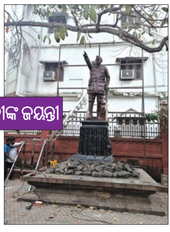
ଅଜି ନେତାଜୀଙ୍କ ଜୟନ୍ତୀ