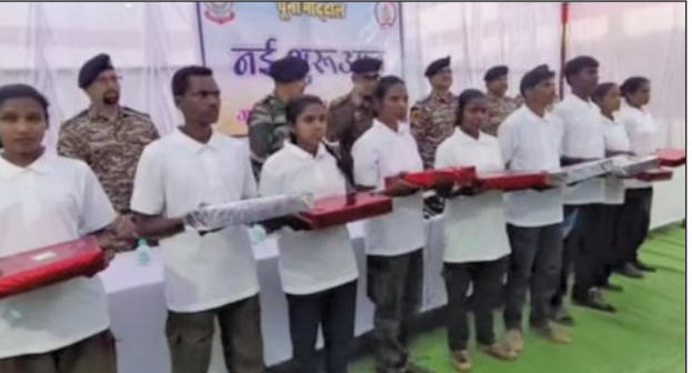
ଦିନ ତଳେ ବଳଦେବଙ୍କ ବାପାଙ୍କ ଭାବପ୍ରବଣ ଭିଡିଓ ସୋସିଆଲ ମିଡିଆରେ ଭାଇରାଲ୍ ହୋଇଥିଲା।

ସିନାପାଲି, ୨୦।୧ (ସମ୍ବିଧ): ବାପାଙ୍କ ଭାବପ୍ରବଣ ଭିଡିଓ ଦୃଶ୍ୟକୁ ବାଟେଇ ଆଣିଲା। ହିଂସାର ପଥ ଛାଡ଼ି ଶାନ୍ତିର ପଥରେ ଯୋଗଦେବା ପାଇଁ ନିଜର କିଛି ସହଯୋଗୀଙ୍କ ସହ ପୁଅ ଆଜି ଆନରେ ଆତ୍ମସମର୍ପଣ କରିଛି। ସମର୍ପଣକାରୀଙ୍କ ମଧ୍ୟରେ ତାଙ୍କର ସ୍ତ୍ରୀ ମଧ୍ୟ ରହିଥିବା ଜଣାଯାଇଛି। ନୂଆପଡ଼ା ଜିଲ୍ଲା ପଡୋଶୀ ଛତିଶଗଡ଼ ରାଜ୍ୟର ଗିରିଆବନ୍ଧ ଅଞ୍ଚଳରେ ଆଜି ଏପରି ଏକ ଚର୍ଚ୍ଚା ଜୋର ଧରିଛି। ଛତିଶଗଡ଼ର ଗିରିଆବନ୍ଧ ପୁଲିସ୍ ନିକଟରେ ଆଜି ୯ଜଣ କୁଖ୍ୟାତ ମାଓବାଦୀ ଆତ୍ମସମର୍ପଣ କରିଛନ୍ତି। ଏକେ-୪୭, ଏସ୍‌ଏଲଆର ଏବଂ ୩୦୩ ଭଳି ଅତ୍ୟାଧୁନିକ ଅସ୍ତ୍ରଶସ୍ତ୍ର ସହ ସେମାନେ ଆତ୍ମସମର୍ପଣ କରିଛନ୍ତି।