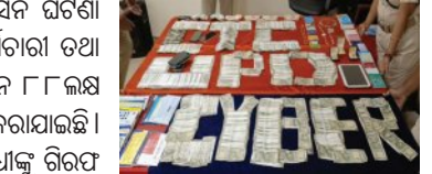
୧୪ଲକ୍ଷ ଟଙ୍କା, ୧୨ଟି ରୁପା ମୁଦ୍ରା, ୨ଟି ସୁନା କାମ୍ପୁଲ, ମଙ୍ଗଳପୁତ୍ର, ସୁନା ଚେନା ଓ ବ୍ରେସଲେଟ୍ ଜବତ