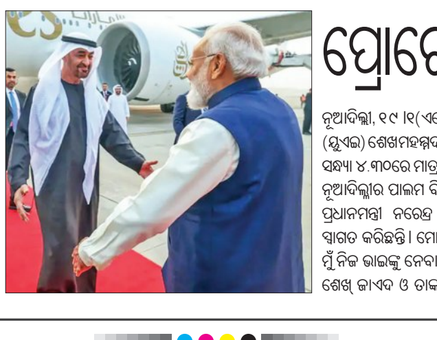
ନୂଆଦିଲ୍ଲୀ, ୧୯।୧ (ଏକେନିଉ): ଯୁକ୍ତରାଷ୍ଟ୍ର ଆରବ୍‌ସ୍‌ର ସମିରେଶ୍ୱରୀ (ୟୁଏଇ) ଶେଖ୍‌ମହମ୍ମଦ୍‌ବିନ‌ଜାଏଦ୍‌ଆଲ‌ମହମ୍ମଦ୍‌ସୋମବାର ସମ୍ପା ୪.୩୦ରେ ମାତ୍ର ୧୦୫ ମିନିଟ୍‌ର ଭାରତ ଗସ୍ତରେ ଆସି ନୂଆଦିଲ୍ଲୀର ପାଇଲ ବିମାନ ବନ୍ଦରେ ପହଞ୍ଚିଛନ୍ତି । ଏଠାରେ ପ୍ରଧାନମନ୍ତ୍ରୀ ନରେଶ୍ୱର ମୋଦୀ ପ୍ରୋଟୋକଲ ଭାଙ୍ଗି ତାଙ୍କୁ ସ୍ୱାଗତ କରିଛନ୍ତି । ମୋଦୀ ଏକ୍ସ ପୋଷ୍ଟ କରି ଲେଖିଛନ୍ତି ଯେ, ମୁଁ ନିଜ ଭାଇଙ୍କୁ ନେବା ପାଇଁ ବିମାନ ବନ୍ଦର ଆସିଛି । ମୋଦୀ ଶେଖ୍‌ଜାଏଦ୍‌ ଓ ତାଙ୍କ ପରିବାର ସଦସ୍ୟଙ୍କୁ ଦିଲ୍ଲୀର ଲୋକ

କରାଚୀ, ୧୯।୧ (ଏକେନିଉ): ପାକିସ୍ତାନର କରାଚୀରେ ଶନିବାର ଏକ ସପିଙ୍ଗ ମଲ୍‌ରେ ଘଟିଥିବା ଅଗ୍ନିକାଣ୍ଡରେ ମୃତ୍ୟୁ ଫାଖୀ ୨୧କୁ ବୃଦ୍ଧି ପାଇଛି । ରବିବାର ବିଳମ୍ବିତ ରାତିରେ ଆଉ ୪ ଜଣଙ୍କ ମୃତଦେହ ଉଦ୍ଧାର କରାଯାଇଥିଲା । ଏହି ଅଗ୍ନିକାଣ୍ଡ ପରେ ପ୍ରାୟ ୬୫ ଜଣ ନିଖୋଜ ଥିବା ସୂଚନା ମିଳିଛି । ଉଦ୍ଧାର କାର୍ଯ୍ୟପାଇଁ ସେନାକୁ ନିୟୋଜିତ କରାଯାଇଛି । ପୂର୍ଣ୍ଣ ବିନିଖୋଜକ ପରିବାରର ମୋବାଇଲ୍ ନଂ ଫଟ୍‌ଗ୍ରହ କରିଛି । ଅଧିକାରୀମାନେ କହିଛନ୍ତି ଯେ, ମଲ୍ ଭିତରେ ୨୦ରୁ ଅଧିକ କଲ୍ ଲୋକେ ସେନା ଚିହ୍ନଟ କରାଯାଇଛି । ପ୍ରାୟ ୨୦୦ ଖର୍ଚ୍ଚ ଅର୍ଜନାଭାଜେସନ (ଏସ୍‌ଡିଏ) ସହିତ ସେନା, ପୂର୍ଣ୍ଣ ବି ଓ ସ୍ଥାନୀୟ ପ୍ରଶାସନ ଅବଶେଷ ସମ୍ପା କରୁଛି । ସୁରକ୍ଷା ବାହିନୀ କୋଠାର କ୍ଷତିଗ୍ରସ୍ତ ଅଂଶ, ଯେଉଁଠାରେ ଲୋକମାନେ ପସି ରହିଛନ୍ତି ସେମାନଙ୍କୁ ଉଦ୍ଧାର କରିବାକୁ ସେଠାରେ ପହଞ୍ଚିବାକୁ ଚେଷ୍ଟା କରୁଛି । ଏଥିପାଇଁ ଭାରୀ ଯନ୍ତ୍ରପାତି ବ୍ୟବହାର କରାଯାଇଛି । ଶନିବାର ରାତି ୧୦ଟା ସମୟରେ ବୋକାନଗୁଡ଼ିକରେ ନିଆଁ ଲାଗିଥିଲା । ଏହା ବେସମେଣ୍ଟରୁ ଆରମ୍ଭ ହୋଇଥିଲା ।