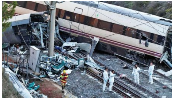
ଫାକ୍ସା, ଏଡିଆଲସଫ କହିଛି ଯେ, ପରବର୍ତ୍ତୀ ସୂଚନା ପର୍ଯ୍ୟନ୍ତ ମାଡ୍ରିଡ଼ ଓ ଆଣ୍ଡାଲୁସିଆ ମଧ୍ୟରେ ସମସ୍ତ ଟ୍ରେନ୍ ସେବା ବନ୍ଦ ହୋଇଛି । ଉଦ୍ଧାରକର୍ତ୍ତା ଜଣେ ଜରୁରୀକାଳୀନ ସେବା ନିୟୋଜିତ କରାଯାଇଛି ଓ ରାତାରାତି ଉଦ୍ଧାର କାର୍ଯ୍ୟ ଜାରି ରହିଛି । ସ୍ୱେନ୍ ପରିବହନ ମନ୍ତ୍ରୀ, ଅୟାର ପୁସ୍‌ସ କହିଛନ୍ତି ଯେ, ଏଡିଆଲସଫ ଅପରେସନ କଣ୍ଠସ୍ଥଳ ସେକ୍ସରୁ ସ୍ଥିତି ଉପରେ ନଜର ରଖୁଛି ।

କରାଯାଇଥିଲା । ଝଟ୍କା ଦେଇ ପଳାଇବାକୁ ଚେଷ୍ଟା କରୁଥିବା ବେଳେ ଅନେକ ଯାତ୍ରୀ ଆହତ ହୋଇଛନ୍ତି । ଟ୍ରେନ୍‌ରେ ଧକ୍କା ଭରି ହୋଇଥିବା କେତେକ ଅଭିଯୋଗ କରିଛନ୍ତି । ଏହି ଦୁର୍ଘଟଣା ପରେ ସ୍ୱେନ୍ ରେଳ ଭିତ୍ତିକୁ ନି