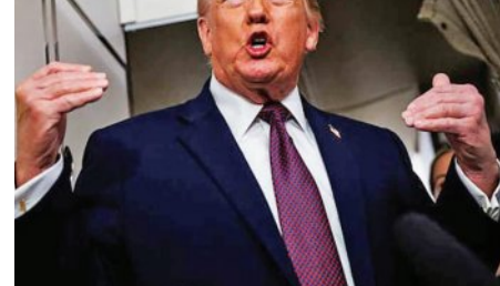
ଟ୍ରମ୍‌ଙ୍କ ଚିଠି ପାଠ କରି ବୋଲି ନରଝେ ପ୍ରଧାନମନ୍ତ୍ରୀ କହିଛନ୍ତି । ସୂଚନା ଅନୁଯାୟୀ, ଶୁଳ୍ଭ ବୁଦ୍ଧି ନିଷ୍ପତ୍ତିକୁ ବିରୋଧ କରି ଗହର ଏବଂ ଫିନଲ୍ୟାଣ୍ଡ ରାଷ୍ଟ୍ରପତି ଆଲେକ୍‌କାଣ୍ଡର ଷ୍ଟ୍‌ସ୍ ମିଳିତ ଭାବେ ଟ୍ରମ୍‌ଙ୍କୁ ଚିଠି ଲେଖିଥିଲେ । ଏହାର ଜବାବରେ ଟ୍ରମ୍ ନୋବେଲ ନ ମିଳିବାରୁ ନେଇ ଅଭିଯୋଗ କରି ଦେଇଥିଲେ । ଟ୍ରମ୍ ଲେଖିଥିଲେ ଯେ ଗ୍ରୀନଲାଣ୍ଡକୁ ରୁଷ୍ କିମ୍ବା ଚୀନ୍ କବଳକୁ ତେନାଙ୍କୁ ସୁରକ୍ଷା ଦେବାପାଇଁ ନାହିଁ । ତେନାଙ୍କ ପାଖରେ ଏହାର ମାଲିକାନା କାହିଁକି ରହିଛି । ଏହାର କୌଣସି ଲିଖିତ କରାଜପତ୍ର ମଧ୍ୟ ନାହିଁ ।

ଦେଖିବାକୁ ମିଳିଥିଲା । ସେ ନିଜ ବହୁ ରାଷ୍ଟ୍ରକୁ ମଧ୍ୟ ଛାଡ଼ି ନ ଥିଲେ । ବିଜେଟ, ପ୍ରାୟ ଆଦି ଦେଶ ଉପରେ ବି ଶୁଳ୍ଭ ଲଗାଇ ଦେଇଥିଲେ । ଭେନେଜୁଏଲା ବିରୋଧୀ ଦଳ ନେତା ମାରିଆ ମାଟାଡୋ ନିଜ ଶାନ୍ତି ପୁରସ୍କାର ଦେଇଥିଲେ ବି ଟ୍ରମ୍ ଶାନ୍ତ ହୋଇ ନ ଥିଲେ ।