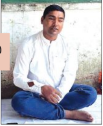
ବଦଳିର ପୁନର୍ବିତାର ନ ହେଲେ ଆମ୍ଭକୁ ଡିଏଫ୍‌ଓ