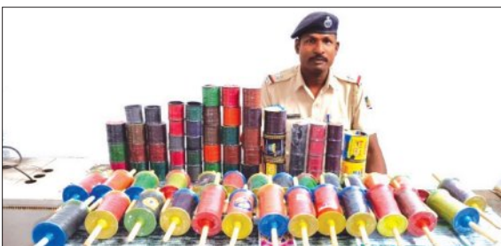
ଯଦି କେହି ମାଞ୍ଜା ସୂତା ବିକ୍ରୟ କିମ୍ବା ବ୍ୟବହାର କରୁଥିବା ବେଳେ ନିକଟସ୍ଥ ଥାନା କିମ୍ବା ୧୧୨କୁ ଲକ୍ଷ୍ୟ କରିବାକୁ ପୁଲିସ୍ ଅନୁରୋଧ କରିଛି।

ଜବତ କରାଯାଇଛି। ଗୁଡ଼ି ଉଡ଼ାଉଥିବାବେଳେ ୧୨ ଜଣଙ୍କଠାରୁ ଏବଂ ୩୫ରୁ ଉର୍ଦ୍ଧ୍ୱ ମାଞ୍ଜା ସୂତା ଲାଗିଥିବା ଲଢ଼େଇ ମଧ୍ୟ ଜବତ ହୋଇଛି। ଅବାଧି ଭାବେ ମାଞ୍ଜା ସୂତା ବିକ୍ରୟ କରୁଥିବା ବ୍ୟକ୍ତିମାନଙ୍କୁ ଜଡ଼ା ଚେତାବନୀ ଦିଆଯାଇଛି। ପୁଲିସ୍ ସ୍ୱତନ୍ତ୍ର କରିଛି ଯେ, ମାଞ୍ଜା ସୂତା ବ୍ୟବହାର ଏବଂ ବିକ୍ରୟ ଆଇନତଃ ଅପରାଧ। ଏହା ମାନବ ଜୀବନ ସହିତ ପକ୍ଷୀ, ପଶୁ ଓ ପରିବେଶ ପାଇଁ ମଧ୍ୟ ଭୟଙ୍କର।