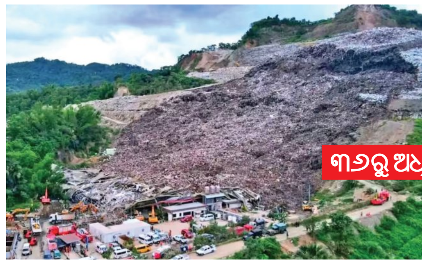
୩୬ରୁ ଅଧିକ ନିଖୋଜ

୨୮ ସହରରେ ପାରବ ୧୦ ଡିଗ୍ରୀ ତଳେ ୧୩ ବର୍ଷର ରେକର୍ଡ ଭାଙ୍ଗିଲା ଝାରସୁଗୁଡ଼ା ଜାନୁଆରୀ ମାସରେ ସର୍ବନିମ୍ନ ୪.୫ ଡିଗ୍ରୀ ତାପମାତ୍ରା ରେକର୍ଡ