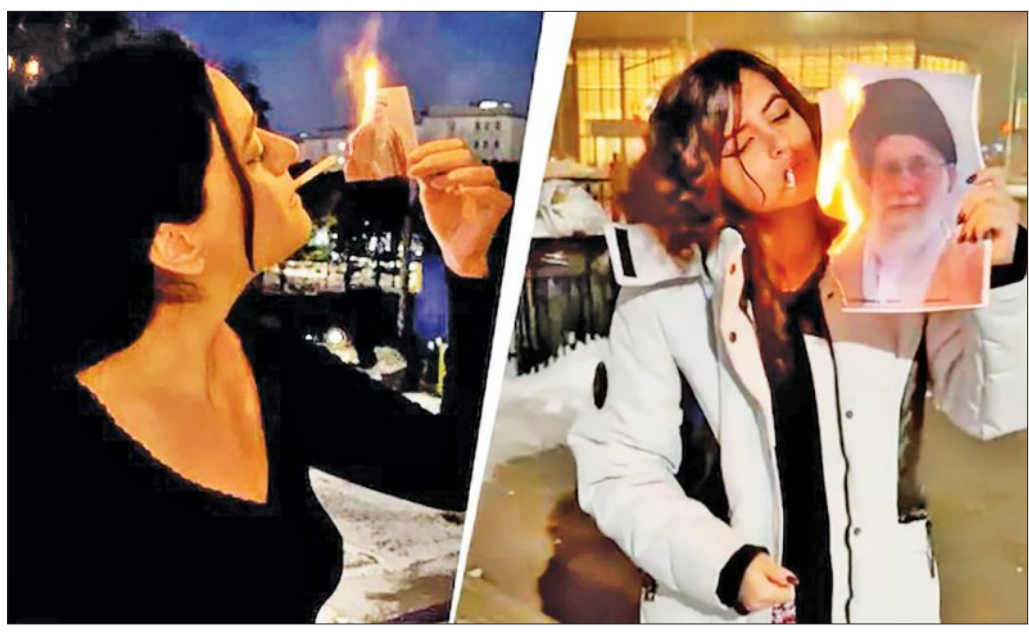
ଇରାନର ସର୍ବୋଚ୍ଚ ନେତା ଖାମେନିଙ୍କ ପଟେରେ ନିଆଁ ଲଗାଇ ସିଗାରେଟ୍ ଟାଣୁଛନ୍ତି ବିଶୋଧକାରୀ

ତେହରାନ, ୧୦।୧।(ଏଜେନ୍ଟ୍): ଅହେତୁକ ଦରଦାମ ବୃଦ୍ଧି ଏବଂ ଟିକସ ବୋଧକୁ ବିରୋଧ କରି ଇରାନରେ ଆରମ୍ଭ ହୋଇଥିବା ବିଶୋଧ ପ୍ରଦର୍ଶନ ଉପକରଣ ରୂପ ଧାରଣ କରିଛି। ଏହା ଝି-ପୁକ ହୋଇ ସାରା ଦେଶକୁ ବ୍ୟାପିଯାଇଛି। ମହଙ୍ଗା ମାଡ଼ୁରୁ ମୁକ୍ତି ପାଇଁ ଆରମ୍ଭ ହୋଇଥିବା ଏହି ଆନ୍ଦୋଳନ କ୍ରମେ ରାଜନୈତିକ ରୂପ ନେଇଛି। ବିଶୋଧକାରୀ ଦେଶରୁ ଇସଲାମିକ ଶାସନ ହଟାଇବା ପାଇଁ ଦାବି କରୁଥିବାବେଳେ ସରକାର ଦମନ ନୀତି ଚଳାଇଛନ୍ତି। ଆମେରିକା ରାଷ୍ଟ୍ରପତି ଡୋନାଲ୍ଡ ଟ୍ରମ୍ପଙ୍କ ଧମକ ସତ୍ତ୍ୱେ ଇରାନର ସର୍ବୋଚ୍ଚ ନେତା ଆୟତୁଲ୍ଲାହ ଅଲ୍ ଖାମେନି ଆନ୍ଦୋଳନକାରୀଙ୍କୁ ଦମନ କରିବାକୁ ନିର୍ଦ୍ଦେଶ ଦେଇଛନ୍ତି। ସୁରକ୍ଷାକର୍ମୀଙ୍କୁ ପଛପୁଆ ନ ଦେବାକୁ କହିଛନ୍ତି। ଏପରି ସମୟରେ ରାତାରାତି ଇରାନର ସ୍ଥିତି ବଦଳି ଯାଇଛି। ଇରାନର ବିତାଡ଼ିତ ରାଜା ରୋଜା ପହଲବି ସହର ପ୍ରମୁଖ କେନ୍ଦ୍ରକୁ କବ୍‌ଜା ପାଇଁ ପ୍ରସ୍ତୁତ ରହିବାକୁ ଆନ୍ଦୋଳନକାରୀଙ୍କୁ ଆହ୍ୱାନ ଦେଇଛନ୍ତି। ଶନିବାର ଏବଂ ରବିବାର ପ୍ରମୁଖ ସ୍ଥଳକୁ ଲକ୍ଷ୍ୟ ରଖି ଆନ୍ଦୋଳନକୁ କୋରଦାମ କରିବାକୁ କହିଛନ୍ତି। ସେ