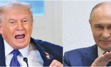
ଅପହରଣ କରିବ କି? ଯୁକ୍ତେନ ରାଷ୍ଟ୍ରପତି ଜେଲେନସ୍କି ଏପିଟି ଦାବି କରିଛନ୍ତି। ଏଫ୍‌ପିଏରେ ଆମେରିକାର ରାଷ୍ଟ୍ରପତି ଡୋନାଲ୍ଡ ଟ୍ରମ୍ପଙ୍କୁ ପ୍ରଶ୍ନ କରାଯିବାରୁ ସେ କହିଲେ, 'ଏନେଇ ମୁଁ ଜେଲେନସ୍କି ସହ

ଝାଫ୍ଟିନ, ୧୦।୧।(ଏଜେନ୍ଟ୍): କୋଲକାତାରେ ବିଶୋଧ ଆରମ୍ଭ ହେବା ପରେ ଇରାନର ରାଷ୍ଟ୍ରପତି ରୁହାନି ଆମେରିକା ଆକ୍ରମଣ କରି ନେଇ ସେ ଖୁସି ହୁଅନ୍ତୁ ବୋଲି କହିଛନ୍ତି। ଇସଲାମବାଦୀ: ପାକିସ୍ତାନ ପୁଣିଥରେ ଇସ୍‌ମାଏଲ ବିରୋଧୀ ଆକ୍ରମଣ ପୋଷଣ କରି ମନ୍ତବ୍ୟ ଦେଇଛି। ପାକିସ୍ତାନ ପ୍ରତିରକ୍ଷା ମାନ୍ୟତା ଭଳି ଆମେରିକା ନେତାମାନଙ୍କୁ ମଧ୍ୟ ଅପହରଣ କରୁ: ପାକିସ୍ତାନ