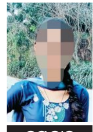
ତନ୍ମୁଦାନ କରାଇଲେ ପରିବାରଲୋକ

ଜଣେ ଅଧିକାରୀଙ୍କଠାରୁ ଖବର ପାଇ ଯୁବତୀଙ୍କ ବାପା ସଂଧ୍ୟାରେ ଉତ୍କଳ ଉଡ଼ା ଆକାଶରେ ଆଜି ଏପରି ଏକ ଅଭିଯୋଗ ଲିଖାବ୍ୟାପୀ ଚାଞ୍ଚଳ୍ୟ ସୃଷ୍ଟି କରିଛି। ଯୁବତୀଙ୍କ ଶବ୍ଦ ଯୁଗାଳରେ ଅଞ୍ଚଳରେ ଏକ ଉତ୍ତାପରେ ରହିଥିଲା। ପୁଲିସ୍ ତାଙ୍କ ମୃତଦେହ ଜବତ କରି ବ୍ୟବହୃତ ପାଇଁ ପଠାଇବା ସହ ଏକ ମାମଲା ରୁଜୁ କରି ତଦନ୍ତ ଚଳାଇଛି। ଯୁବତୀଙ୍କ ବାପାଙ୍କ ଏତଲା ଅନୁଯାୟୀ, ତାଙ୍କ ଝିଅ ୨୦୨୧ରେ କେନ୍ଦ୍ରାପଡ଼ା ପୌରପାଳିକାରେ ଠିକା କର୍ମଚାରୀ ଭାବେ କାମ କରୁଥିଲେ। ୨୦୨୧ରେ ତାଙ୍କି ଛାଡ଼ି ଉତ୍କଳିଆ ସମ୍ପୂର୍ଣ୍ଣ ପୁରଣ ପାଇଁ ବିଭିନ୍ନ ପ୍ରଦେଶିକା ପରାମର୍ଶ ପ୍ରସ୍ତୁତି ନିମନ୍ତେ ସୁନାମଲେ ଅଞ୍ଚଳରେ ଘରଭଡ଼ା ନେଇ ରହିଥିଲେ। ଗୁରୁବାର ଅପରାହଣରେ ତାଙ୍କ ମାଆ ବାରମ୍ବାର ଫୋନ କରିଥିଲେ ହେଁ ସେ ଫୋନ୍ ନ ଉଠାଇବାରୁ ପରିବାରଲୋକ ଚିନ୍ତାରେ ପଡ଼ିଥିଲେ। କେନ୍ଦ୍ରାପଡ଼ା ପୌରପାଳିକାର