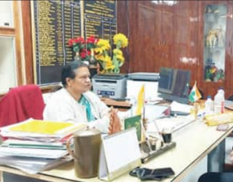
୫୪ଜଣ ଆକ୍ରାନ୍ତ ହୋଇଥିବା ମିଳିଛି ସୂଚନା। ଏନେଇ ସିଡିଏମ୍ଓ ବିଦ୍ୟାଳୟ ପରିଦର୍ଶନ କରି ସ୍ଥିତି ଅନୁଧ୍ୟାନ କରି ପେଟିଛନ୍ତି। ସୂଚନା ଅନୁସାରେ, ଖୋର୍ଦ୍ଧା ପିଏମ୍‌ଶ୍ରୀ ଜବାହାର ନବୋଦୟ ବିଦ୍ୟାଳୟରେ ଜଣ୍ଡିସ ଆକ୍ରାନ୍ତଙ୍କ ସଂଖ୍ୟା

ସାମଗ୍ରୀ ବୁଲି ଦେଖିଥିଲେ। ଅଭିଭାବକ ମାନେ କୌଣସି ଭୟଭୀତ ହୁଅନ୍ତୁ ନାହିଁ। ଜିଲ୍ଲା ସାଧ୍ୟ ବିଭାଗ ର ଟିମ୍ ଗତ ୩ଦିନ ଧରି ଶିକ୍ଷକ, ପିଲାଙ୍କ ରକ୍ତ ପରୀକ୍ଷା ସହ ପାଣି ନମୁନା ସଂଗ୍ରହ କରି ପରୀକ୍ଷଣ ପାଇଁ ପଠାଇଥିଲେ। ସମ୍ପୂର୍ଣ୍ଣ ସ୍ଥିତି ଉପରେ ନଜର ରଖାଯାଇଛି କହିଛନ୍ତି ସିଡିଏମ୍ଓ।