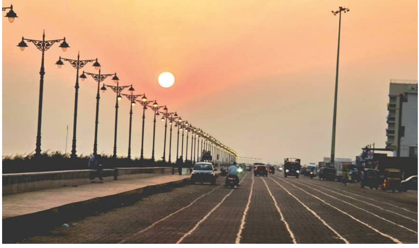
ଗୋଧୂଳି ବେକାର ବେକାରୁମି ମାର୍ଗ