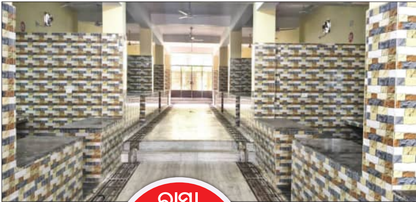
ପଡୁଛି । ବିଲିକା ପ୍ରେସ୍ ନାରେ ମସୃ ବାରିଗ ପକ୍ଷରୁ ନିର୍ମାଣ କରାଯାଇଥିବା ବୋକାନରେ ଆଜି ମାଛ ବିକ୍ରି

ନୟାଗଡ଼ ଘୌର ପରିଷଦ ପକ୍ଷରୁ ୩ କୋଟିରୁ ଉର୍ଦ୍ଧ୍ୱ ଟଙ୍କାରେ ଆମିଷ ବଜାର ନିର୍ମାଣ କରାଗଲା । ଏହାକୁ କାର୍ଯ୍ୟକ୍ରମ କରିବାକୁ ଦୁଇବର୍ଷ ସମୟ ଲାଗିଲା । ସହରର ଅନ୍ୟ କୌଣସି ସ୍ଥାନରେ ମାଛମାଂସ ବିକ୍ରି ହୋଇପାରିବ ନାହିଁ ବୋଲି ଘୌର ପରିଷଦ ଘୋଷଣା କଲା । ସହରର ସମସ୍ତ ଆମିଷ ବ୍ୟବସାୟୀ ଅତ୍ୟାଧୁନିକ ଆମିଷ ବଜାରରେ ବସି ବିକ୍ରିବନ୍ତା ଆରମ୍ଭ କଲେ । ହେଲେ ଦୁଇମାସ ନ ବିରୁଣୁ ଏବେ ବ୍ୟବସାୟୀମାନେ ଆମିଷ ବଜାରରୁ ମୁହଁ ଫେରାଇଲେଣି । ଘୌର ପରିଷଦର କୋହଳ ମନୋବୃତ୍ତି ଓ ବେପାରୀମାନେ ନାଚି ଯୋଗୁଁ ଏଭଳି ସ୍ଥିତି ସୃଷ୍ଟି ହୋଇଛି । ଆମିଷ ବଜାରରେ ନିର୍ମାଣ କରାଯାଇଥିବା ପିଣ୍ଡିଗୁଡ଼ିକ ଖାଲି ପଡୁଥିବା ବେଶ୍‌ବାବୁ ମିଳୁଛି । ଉଦ୍‌ବିଭାବ ଓ ବୁଧବାର ଆମିଷ ବାରିରେ ଦି ୧୦କି ୧୨ ଜଣ ବ୍ୟବସାୟୀଙ୍କୁ ଆମିଷ ବଜାରରେ ବେଶ୍‌ବାବୁ ମିଳୁଥିବା ବେଳେ ଅଧିକାଂଶ ପିଣ୍ଡି ଖାଲି ପଡୁଛି ।