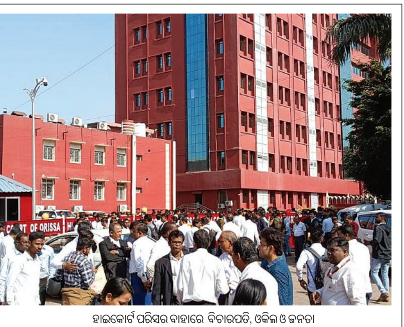
ହାଇକୋର୍ଟ ପରିସର ବାହାରେ ବିଚାରପତି, ଓକିଲ ଓ ଜନତା