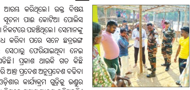
ନେଇ କାର୍ଯ୍ୟକ୍ରମ ରହିଥିଲା । ଏଥିନେଇ ଉପର ସେମି ଗ୍ରାମରେ ତମ୍ବୁ ଲଗାଇ ପ୍ରସ୍ତୁତି

ପଟାଳି, ୨୯।୧(ସମ୍ପାଦ): କୋଟିଆରେ ଆନ୍ଧ୍ର ଅଧିକାରୀଙ୍କ ଅନୁପ୍ରବେଶ କରିଥିବା ଦେଖି ଘରତୋଇଲା କୋଟିଆ ପୁଲିସ । ଆନ୍ଧ୍ର ରାସନ କାର୍ଡ ପ୍ରଦାନ କରିବା ନିମନ୍ତେ ସର୍ଭେ କରିବାକୁ କରିଥିଲେ ଅନୁପ୍ରବେଶ । ସୂଚନା ଅନୁଯାୟୀ ଆଜି ଆନ୍ଧ୍ର ପ୍ରବେଶର ପଞ୍ଚାୟତ ତଥା ସର୍ବିକାୟତର ଅଧିକାରୀମାନେ ଉପର ସେମି ଗ୍ରାମରେ ଅନୁପ୍ରବେଶ କରିଥିଲେ । ସେଠାରେ ଗ୍ରାମବାସୀ ମାନଙ୍କୁ ଏକତ୍ରିତ କରିଥିଲେ । ଲୋକଙ୍କୁ ଆନ୍ଧ୍ର ସରକାରଙ୍କ ଉପସ୍ଥାପନ କରି କିଲିକ ସମଧାନ କରାଯାଇପାରିବ ସେନେଇ ଅଲୋଚନା ହୋଇଥିଲା । ସରକାରଙ୍କ ତରଫରୁ ବିଭିନ୍ନ ଠିକା କାର୍ଯ୍ୟରେ ନିର୍ଦ୍ଧାରଣ ସାମା ୧୪. ୯୯ ରହିଛି । ଏହାକୁ ବିରୋଧ କରି ଠିକାଦାର ସଂଘ ତରଫରୁ ସମସ୍ତ ଠିକାଦାର କୋଟିଆ ନିର୍ଦ୍ଧାରଣ ବିନା କମରେ ଟେକ୍ସଟ କରିବା ପାଇଁ ନିଷ୍ପତ୍ତି ହୋଇଛି । ବିନା ଲେସରେ ଟେକ୍ସଟ ପକାଇ ହୋଇଥିଲା । ଏଥିରେ ସମସ୍ତ ଠିକାଦାର ଏକତ୍ରିତ ହୋଇ ନିଜ ସମସ୍ୟା ଗୃହିକ ଉପସ୍ଥାପନ କରି କିଲିକ ସମଧାନ କରାଯାଇପାରିବ ସେନେଇ ଅଲୋଚନା ହୋଇଥିଲା । ସରକାରଙ୍କ ତରଫରୁ ବିଭିନ୍ନ ଠିକା କାର୍ଯ୍ୟରେ ନିର୍ଦ୍ଧାରଣ ସାମା ୧୪. ୯୯ ରହିଛି । ଏହାକୁ ବିରୋଧ କରି ଠିକାଦାର ସଂଘ ତରଫରୁ ସମସ୍ତ ଠିକାଦାର କୋଟିଆ ନିର୍ଦ୍ଧାରଣ ବିନା କମରେ ଟେକ୍ସଟ କରିବା ପାଇଁ ନିଷ୍ପତ୍ତି ହୋଇଛି । ବିନା ଲେସରେ ଟେକ୍ସଟ ପକାଇ ହୋଇଥିଲା । ଏଥିରେ ସମସ୍ତ ଠିକାଦାର ଏକତ୍ରିତ ହୋଇ ନିଜ ସମସ୍ୟା ଗୃହିକ ଉପସ୍ଥାପନ କରି କିଲିକ ସମଧାନ କରାଯାଇପାରିବ ସେନେଇ ଅଲୋଚନା ହୋଇଥିଲା ।