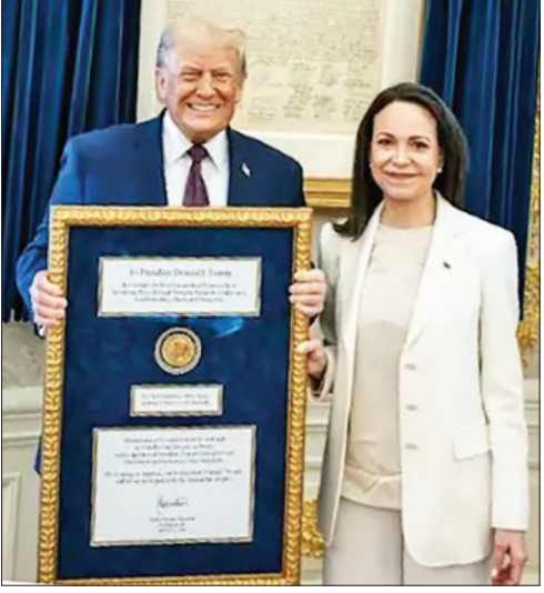
ଭେନେଜୁଏଲାର ନେତାଙ୍କୁ ଭେଟିଛନ୍ତି । ଆଉ ଏହି ସାକ୍ଷାତ ଇତିହାସ ପାଇଁ ନିଆଯାଇଛି । ମାତାତୋ ଟ୍ରମ୍ପଙ୍କୁ ନିଜ ନୋବେଲ ଶାନ୍ତି ପୁରସ୍କାରକୁ ବଦାନ୍ୟତା ସ୍ୱରୂପ ପ୍ରଦାନ କରିଛନ୍ତି । ଆଜି ଭେନେଜୁଏଲାର ସାଧାରଣ ପାଇଁ ଏକ ଐତିହାସିକ ଦିନ ବୋଲି ମାତାତୋ କହିଛନ୍ତି । ଦୈନିକ ପରେ ସାମ୍ବାଦିକଙ୍କ ସହ କଥା ହେବା ବେଳେ ମାତାତୋ ଟ୍ରମ୍ପଙ୍କୁ

ନୂଆଦିଲ୍ଲୀ, ୧୬।୧ (ଏକେନ୍ଦ୍ରି): ବିଶ୍ୱରେ ଅସ୍ଥିରତା ସୃଷ୍ଟି କରିଥିବା ଆମେରିକା ରାଷ୍ଟ୍ରପତି ତୋନାଲ୍ଡ ଟ୍ରମ୍ପଙ୍କୁ ଆଶା ପରିଶେଷରେ ପୂର୍ଣ୍ଣ ହେଉଛି । ଶୁକ୍ଳ ଛାଟ ହେଉ ଅବା ଆମାନଙ୍କ ପ୍ରତ୍ୟାପଣ କିମ୍ବା ଅନ୍ୟ ଦେଶରେ ଆକ୍ରମଣ ପାଇଁ ସର୍ବଦା ବିବାଦରେ ଥିବା ଅଶାନ୍ତ ଟ୍ରମ୍ପ ଏବେ ଶାନ୍ତ ପଡ଼ିବେ ବୋଲି ଆଶା କରାଯାଉଛି । କାରଣ ଭେନେଜୁଏଲାର ରାଷ୍ଟ୍ରପତିଙ୍କୁ ରାତିଅଧରେ ଅପହରଣ କରି ଆଣିବାକୁ ନିର୍ଦ୍ଦେଶ ଦେଇଥିବା ଆମେରିକା ରାଷ୍ଟ୍ରପତିଙ୍କ ଦାବି ଦିନର ଆଶା ପୂରଣ ହୋଇଛି । ଗ୍ରୀନଲାଣ୍ଡ କବ୍ସା ପାଇଁ ସୁଦ୍ଧେ ଦେଖିଥିବା ରାଷ୍ଟ୍ରପତି ଟ୍ରମ୍ପଙ୍କୁ ନୋବେଲ 'ଶାନ୍ତି' ପୁରସ୍କାର ମିଳିଛି । ମାତ୍ର ପ୍ରସିଦ୍ଧ ବୈଜ୍ଞାନିକ ଆଲବ୍ରେଟ୍ ନୋବେଲଙ୍କ ନାମରେ ଦିଆଯାଇଥିବା ଏହି ସମ୍ମାନ ନୋବେଲ କମିଟି ଦ୍ୱାରା ଦିଆଯାଇ ନାହିଁ ଟ୍ରମ୍ପ ଏହି ପୁରସ୍କାର ଜିତିନାହାନ୍ତି, ବରଂ ତାଙ୍କୁ ଅଦିନିଆ ଦାନରେ ମିଳିଛି । ଭେନେଜୁଏଲାର ବିପକ୍ଷ ନେତା ମାରିଆ କାରିନୋ ମାତାତୋ ହାଲଟ୍ ହାଉସରେ ଟ୍ରମ୍ପଙ୍କୁ ଭେଟି ନିଜ ନୋବେଲ ଶାନ୍ତି ପୁରସ୍କାର ପ୍ରଦାନ କରିଛନ୍ତି । ନୋବେଲ ପୁରସ୍କାରର ଇତିହାସରେ ପ୍ରଥମ ଥର ପାଇଁ ଏପରି ହୋଇଛି । ମାତ୍ର ଏଭଳି ଦେବାନେବା ବ୍ୟତୀତ ନୋବେଲ କମିଟି ପକ୍ଷରୁ କୁହାଯାଇଛି । କିନ୍ତୁ କୌଣସି ବଦାନ୍ୟତା ନୁହେଁ, ବରଂ କ୍ଷମତା ଲୋଭରେ ମାତାତୋ ଏଭଳି ପଦକ୍ଷେପ ନେଇଥିବା କୁହାଯାଉଛି ।