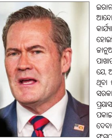
ଇରାନରେ ଇଣ୍ଟରନେଟ୍ ବ୍ଲକ୍‌ଆଉଟ୍ ହେବା କାରଣରୁ ଆତ୍ୟାଚାରକାରୀଙ୍କ ବିରୋଧରେ ପୁରସ୍କାଧିନୀର କାର୍ଯ୍ୟାନୁଷ୍ଠାନର ପରିମାଣ ନିର୍ଣ୍ଣୟ କରିବା କଷ୍ଟକର ହୋଇଛି ବୋଲି ସେ କହିଛନ୍ତି । ଇରାନ ସରକାର କାମୁଆରୀ ଗୁରୁ ସାରା ଦେଶରେ ଇଣ୍ଟରନେଟ୍ ପାଖାପାଖି ପୁରା ବନ୍ଦ କରିଦେଇଛନ୍ତି । ଓଲ୍ କହିଛନ୍ତି ଯେ, ଆତ୍ୟାଚାରକାରୀଙ୍କ ପଛରେ ବିଦେଶୀ ଶକ୍ତିର ହାତ ଥିବା ଇରାନ ସରକାର ଦାବି କରିଛନ୍ତି । ସରକାର ନିଜ ସରକାରକୁ ତରୁଛନ୍ତି ଓ ଅନ୍ୟ ମୁଣ୍ଡରେ ଦୋଷ ଲଦିବାକୁ ପ୍ରୟାସ କରୁଛନ୍ତି ବୋଲି ଏଥିରେ ସୃଷ୍ଟି ହେଉଛି । ଟ୍ରମ୍ପ ଚାପ ପକାଇବା ଫଳରେ ଇରାନରେ ୮୦୦ ଲୋକଙ୍କୁ ପାଖା ପାଖି ପ୍ରକ୍ରିୟା ରୋଗୀ ଯାଇଥିଲା । ମାନସାଧକୀ ସଂରଚନାଗୁଡ଼ିକ ଦେଇଥିବା ତଥ୍ୟ ଅନୁସାରେ, ଏପର୍ଯ୍ୟନ୍ତ ୩, ୪୨୮ ଆତ୍ୟାଚାରକାରୀଙ୍କୁ ହତ୍ୟା କରାଯାଇଛି ଓ ୧୮, ୦୦୦ରୁ ଉର୍ଦ୍ଧ୍ୱ ଲୋକଙ୍କୁ ଗିରଫ କରାଯାଇଛି । ସେପଟେ ଇରାନ ମାମଲାରେ ଆମେରିକା ହସ୍ତକ୍ଷେପ କରୁଛି ଓ ଏହା ଠିକ୍ ନୁହେଁ ବୋଲି ରୁଷିଆ କହିଛି । ଉଲ୍ଲେଖାଯାଉ କି, ତିସେମ୍ବର ୨୮ ରୁ ଇରାନରେ ହିଂସ୍ର ଆତ୍ୟାଚାର ଆରମ୍ଭ ହୋଇ ଏବେ ଉତ୍ତରୁପ ଧାରଣ କରିଛି । ଉଦ୍‌ବାଦ ବୁଦ୍ଧି, ଅର୍ଥିକ ସଙ୍କଟ, ବ୍ୟବସାୟିକ ଆତ୍ୟାଚାର, ସରକାରଙ୍କ ବିରୋଧରେ ରୋଷ, ସରକାରଙ୍କ କଠୋର କାର୍ଯ୍ୟାନୁଷ୍ଠାନ ଏବଂ ଆମେରିକା, ଇସ୍ରାଏଲ ଭଳି ରାଷ୍ଟ୍ରଙ୍କ ହସ୍ତକ୍ଷେପ ଭଳି ବିଭିନ୍ନ କାରଣରୁ ଏହି ଆତ୍ୟାଚାର ଦେଶରେ ନାହିଁ ନଥିବା ସ୍ଥିତି ସୃଷ୍ଟି କରିଛି ।

ଓଫିଟନ, ୧୬।୧ (ଏକେନ୍ଦ୍ରି): ଜାତିସଂଘ ନିରାପତ୍ତା ପରିଷଦ (ୟୁଏନଏସସି) ଜରୁରୀକାଳୀନ ବୈଠକରେ ଆମେରିକା ଇରାନକୁ କଡ଼ା ବାର୍ତ୍ତା ଦେବା ସହ ଚେତାବନୀ ଦେଇଛି । ଆମେରିକାର ରାଷ୍ଟ୍ରଦୂତ ମାଲକ୍ ଓଲ୍ କହିଛନ୍ତି ଯେ, ଇରାନରେ ଚାଲିଥିବା ଆତ୍ୟାଚାର ତଥା ପ୍ରତିବାଦ ଉପରେ ନିଷ୍ଠୁର କାର୍ଯ୍ୟାନୁଷ୍ଠାନ ବନ୍ଦ ପାଇଁ ସମସ୍ତ ବିକଳ ଖୋଲା ଅଛି ବୋଲି ଇରାନ ରାଷ୍ଟ୍ରପତି ତୋନାଲ୍ ଟ୍ରମ୍ପ ସୃଷ୍ଟି କରିଛନ୍ତି । ସେ ଇରାନ ନାଗରିକଙ୍କ ସାହାଯ୍ୟକ୍ରମକୁ ପ୍ରମାଣ କରିଛନ୍ତି । ଇତିହାସରେ ପୂର୍ବରୁ ଇରାନୀମାନେ ଏତେ ପ୍ରଭାବୀ ଜଳରେ କେବେ ବି ସାଧାରଣତା ଦାବି କରିନାହାନ୍ତି । ଟ୍ରମ୍ପ କଥା କୁହନ୍ତି ନାହିଁ, ସିଧା କାର୍ଯ୍ୟାନୁଷ୍ଠାନ ଗ୍ରହଣ କରିଥାନ୍ତି ବୋଲି ଓଲ୍ ସତର୍କ କରାଇ କହିଛନ୍ତି । ଏହିକ୍ରମରେ ସେ ଚେତାବନୀ ଦେଇ କହିଛନ୍ତି ଯେ, ଇରାନ ନେତୃତ୍ୱ ଜାଣି ରଖିବା ଉଚିତ ଯେ ଆମେରିକା ଇରାନରେ ଚାଲିଥିବା ନରସଂହାର ରୋକିବାକୁ ଯେକୌଣସି କଡ଼ା ପଦକ୍ଷେପ ନେଇପାରେ । ଅଗଷ୍ଟ ୧୫ ସଦସ୍ୟ ବିଶିଷ୍ଟ ଜାତିସଂଘ ନିରାପତ୍ତା ପରିଷଦରେ ଇରାନ ଉପ-ରାଷ୍ଟ୍ରଦୂତ ଘୋଲାମ ହୋସେନ ଦର୍ଜି ପ୍ରତିକ୍ରୟ ଦେଇ କହିଥିଲେ ଯେ, ଇରାନ ସଂଘର୍ଷ ଚାହୁଁନାହିଁ, କିନ୍ତୁ ଯଦି ଆମେରିକା କୌଣସି କାର୍ଯ୍ୟାନୁଷ୍ଠାନ ଗ୍ରହଣ କରେ ତେବେ ଇରାନ ଏହାର କଡ଼ା ଜବାବ ଦେବ । ଏହି ବୈଠକରେ ଓଲ୍ ଇରାନ ସରକାରଙ୍କ କାର୍ଯ୍ୟକୁ ନିରା କରିଥିଲେ ।