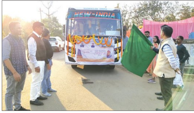
ବିଭିନ୍ନ ବୃକ୍ମ ଆସିଥିବା ବରିଷ୍ଠ ନାଗରିକ ଚାର୍ଯ୍ୟାତ୍ରାମାନଙ୍କର ସମ୍ପୂର୍ଣ୍ଣ ସାଥୀ ପରାଣୀ