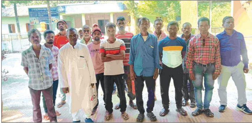
ଜୟପୁର, ୧୫.୧୨ (ସମିତ):