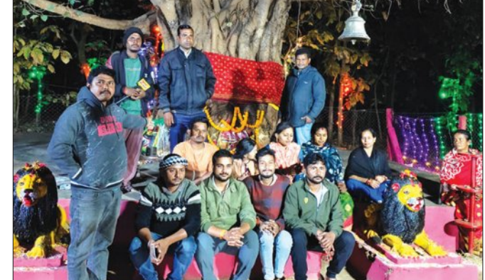
ମାଥିଲି, ୧୫.୧୨ (ସମିତ):

ମାଲକାନଗିରି ଜିଲ୍ଲା ମାଥିଲି ବ୍ଲକ୍ ସଦର ପଞ୍ଚାୟତ ଅନ୍ତର୍ଗତ ମିଲୁଗୁଡ଼ା ଗ୍ରାମରେ ଥିବା ମା' ବନଦୁର୍ଗାଙ୍କ ପୀଠରେ ମକର ସଂକ୍ରାନ୍ତି ଧୂମଧାମ୍ରେ ପାଳିତ ହୋଇଯାଇଛି। ସକାଳୁ ମା'ଙ୍କ ପୂଜାର୍ଚ୍ଚନା କରାଯିବା ସହିତ ହଜାର ହଜାର ଭକ୍ତଙ୍କ ସମାଗମ ପୀଠରେ ହୋଇଥିଲା। ମା'ଙ୍କ ଦର୍ଶନ କରିବା ପାଇଁ ଅଞ୍ଚଳ ତଥା ବହୁ ଦୂର ଦୁରନ୍ତରୁ ଆସିଥିବା ହଜାର ହଜାର ଭକ୍ତ ଅନୁ ପ୍ରାର୍ଥନା ସମେତ ଅନେକ ଯୁବ ଗୋଷ୍ଠୀ ସମସ୍ତ ପ୍ରକାର ସହଯୋଗ କରିଥିଲେ। ହଜାର ହଜାର ଭକ୍ତଙ୍କ ସମାଗମକୁ ଦୃଷ୍ଟିରେ ରଖି ମାଥିଲି ପୁଲିସ ଠାନୁରେ ବ୍ୟାପକ ସୁରକ୍ଷା ଆସୁଥିବା ଏହି ଚାପି ସ୍ଥାନ ଆଜି ଯଯ୍ୟତ