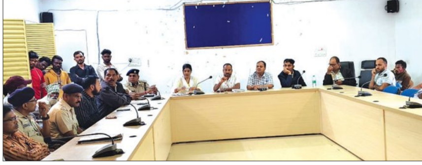
ତନ୍ତପୁର, ୧୫.୧୨