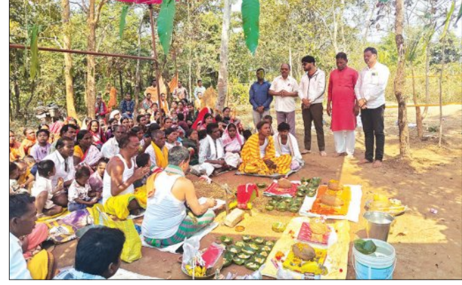
ପାପଡ଼ାହାଣ୍ଡି, ୧୫।୧ (ସମ୍ପାଦକ):

ନବରଙ୍ଗପୁର ଜିଲ୍ଲା ପାପଡ଼ାହାଣ୍ଡି ବ୍ଲକ୍ ନାକଟିଗୁଡ଼ା, ପୁଣ୍ଡିଗୁଡ଼ା, କାଳିଆଗୁଡ଼ା ଗ୍ରାମର ମଧ୍ୟ ଭାଗରେ ନାଟନାପୋଖରୀ ଅଞ୍ଚଳରେ ବାହାରିଥିବା ଶିବଲିଙ୍ଗରେ ଗୁରୁବାର ପ୍ରତିଷ୍ଠା ଉତ୍ସବ ଅନୁଷ୍ଠିତ ହୋଇଯାଇଛି। ଏହି ଅବସରରେ ଆଜି ଅଞ୍ଚଳର ଲୋକମାନେ ଯୋଗଦେଇ