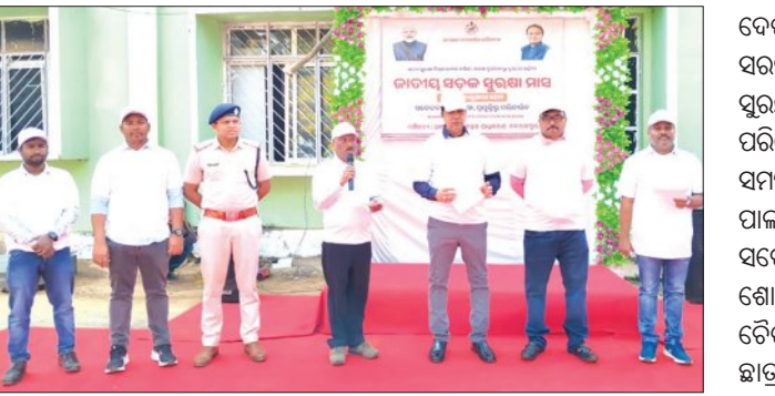
ନବରଞ୍ଜପୁର, ୧୫.୧୨ (ସମିତ):

ଗୁରୁବାର ଜିଲ୍ଲାରେ ଜାତୀୟ ସଡ଼କ ସୁରକ୍ଷା ମାସ ପାଇଁ ଅବସରରେ ଏକ ସଡ଼କ ସୁରକ୍ଷା ସଚେତନତା ଶୋଭାଯାତ୍ରା ନବରଞ୍ଜପୁର ଜିଲ୍ଲାପାଳଙ୍କ କାର୍ଯ୍ୟାଳୟ ସମ୍ମୁଖରେ ଶୁଭାରମ୍ଭ ହୋଇ