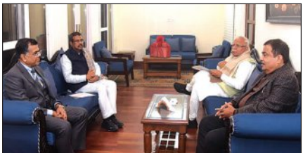
କେନ୍ଦ୍ର ସମ୍ବଲପୁର ଓ ଝାରସୁଗୁଡ଼ା ମଧ୍ୟରେ ଯୋଗାଯୋଗକୁ ଅଧିକ ସୁବୁଦ୍ଧ କରିବା ପାଇଁ ଏକ ବୈକଳିକ ଜାତୀୟ ରାଜପଥ ନିର୍ମାଣ କରାଯାଉ ।

ଭୁବନେଶ୍ୱର, ୭।୧ (ସମ୍ପାଦକ): ଶିଳ୍ପ ସମୃଦ୍ଧ ସମ୍ବଲପୁର ଓ ଝାରସୁଗୁଡ଼ା ମଧ୍ୟରେ ଯୋଗାଯୋଗକୁ ଅଧିକ ସୁବୁଦ୍ଧ କରିବା ପାଇଁ ଏକ ବୈକଳିକ ଜାତୀୟ ରାଜପଥ ନିର୍ମାଣ କରାଯାଉ । ରୂପବାର କେନ୍ଦ୍ର ଶିକ୍ଷା ମନ୍ତ୍ରୀ ଧର୍ମେନ୍ଦ୍ର ପ୍ରଧାନ ନୂଆ ଦିଲ୍‌ଲୀରେ ଭୁବନେଶ୍ୱର, ୭।୧ (ସମ୍ପାଦକ): ଶିଳ୍ପ ସମୃଦ୍ଧ ସମ୍ବଲପୁର ଓ ଝାରସୁଗୁଡ଼ା ମଧ୍ୟରେ ଯୋଗାଯୋଗକୁ ଅଧିକ ସୁବୁଦ୍ଧ କରିବା ପାଇଁ ଏକ ବୈକଳିକ ଜାତୀୟ ରାଜପଥ ନିର୍ମାଣ କରାଯାଉ । ରୂପବାର କେନ୍ଦ୍ର ଶିକ୍ଷା ମନ୍ତ୍ରୀ ଧର୍ମେନ୍ଦ୍ର ପ୍ରଧାନ ନୂଆ ଦିଲ୍‌ଲୀରେ