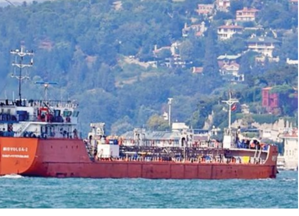
ହେଲିକପ୍ଟରରୁ ଏହି ଜାହାଜରେ ଓହ୍ଲାଇ ଥିଲେ ଏବଂ ସମସ୍ତଙ୍କୁ ବନ୍ଦା କରିଥିଲେ। ଏହି ସମୟରେ ରୁଷର ଜାହାଜ ଉପସ୍ଥିତ ଥିବା ସତ୍ତ୍ୱେ ସାମରିକ ସଂରକ୍ଷଣ ସଫଳାତା ଦିଆଯାଇଥିଲା। ଏ ନେଇ ରୁଷ ପକ୍ଷରୁ କୌଣସି ପ୍ରତିକ୍ରିୟା ଦିଆଯାଇ ନାହିଁ। ଏହା ମଧ୍ୟରେ ରୁଷ ଗଣମାଧ୍ୟମ ଜାହାଜ ପାଖରେ ଥିବା ହେଲିକପ୍ଟର ଫଟୋ ଜାରି କରିଛି।

ଆରମ୍ଭ କରିଥିଲା। ମାତ୍ର ଆମେରିକା ତରଫରୁ ବାହିନୀ ଏହାକୁ ରୋକିବାକୁ ପ୍ରସ୍ତାବ କରିଥିଲା। ସେହି ସମୟରେ ଜାହାଜର କ୍ୟୁ ସଦସ୍ୟଙ୍କ ବୁଦ୍ଧିମତା ଯୋଗୁଁ ଏହା ବର୍ତ୍ତି ଯାଇଥିଲା। ପରେ ଜାହାଜର ନାମ ବଦଳାଇ ମାରିନେରା ଭାବେ ଗଣମାଧ୍ୟମରେ ଜଣାଯାଇଥିଲା। ଏହି ଜାହାଜକୁ ଜବତ କଲା ଆମେରିକା ଭେନେଜୁଏଲାରୁ ଟେଲି ଆଣିବାକୁ ଯାଉଥିଲା ଜାହାଜ ଉପରେ ଆମେରିକା ସେନା