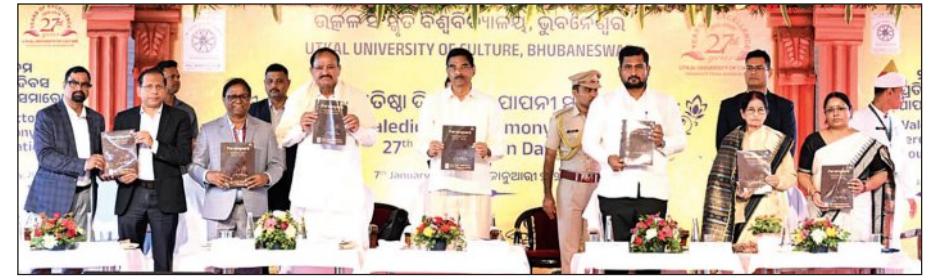
ପୂର୍ବତନ ଉପରାଷ୍ଟ୍ରପତି ଏମ୍. ଭେଙ୍କୟା ନାୟକ ଉତ୍କଳ ସଂସ୍କୃତି ବିଶ୍ୱବିଦ୍ୟାଳୟର ୨୭ତମ ପ୍ରତିଷ୍ଠା ଦିବସର ଉଦ୍‌ଯୋଗୀ ସମାବେଶରେ ଯୋଗ ଦେଇ ପୂର୍ବତନ ଉପରାଷ୍ଟ୍ରପତି ଶ୍ରୀ ନାୟକ କହିଛନ୍ତି ଯେ ଓଡ଼ିଶା ଭାରତର ସର୍ବୋତ୍ତମ ବିକାଶରେ ଏକ ଅନନ୍ୟ ସ୍ଥାନ ଅଧିକାର କରିଛି ।

ସଂସ୍କୃତିକୁ ଏକ ସୁତ ପରିବର୍ତ୍ତିତ, ପ୍ରଯୁକ୍ତିବିଦ୍ୟା ଚାଳିତ ବିଶ୍ୱରେ ନବଯୁଗ, ଉଦ୍‌ବୋଧ ଏବଂ ସ୍ୱାଧୀନ ଚାରିକାର ବାହକ ଭାବରେ ଦେଖିବାର ଆବଶ୍ୟକତା ଉପରେ ଗୁରୁତ୍ୱରୋପ କରିଥିଲେ । ଛାତ୍ରଛାତ୍ରୀମାନେ କେବଳ ପରମ୍ପରାର ରକ୍ଷକ ନୁହଁନ୍ତି ବରଂ ସମ୍ପର୍କ ସଂସ୍କୃତିକ ଉଦ୍‌ବୋଧୀ ଏବଂ ନବଯୁଗକାରୀ । ସଂସ୍କୃତି କେବଳ ସଂରକ୍ଷଣ କରିବାର ବସ୍ତୁ ନୁହେଁ, ଏହା ଏକ ଜୀବନ୍ତ ସମ୍ପଦ ଯାହା ନିୟୁତ୍ୱ, ସାମାଜିକ ସମ୍ପର୍କ ଏବଂ ସ୍ୱାଧୀନ ବିକାଶ ସୃଷ୍ଟି କରିପାରିବ ବୋଲି ରାଜ୍ୟପାଳ କହିଥିଲେ । ଏହି ସଂସ୍କୃତି ବିଶ୍ୱବିଦ୍ୟାଳୟର ସୁନାମରେ ପ୍ରଦେଶର ପ୍ରସ୍ତାବ କ୍ରମାଗତ ଭାବେ, ଲେଖିକାର ଅନୀତିଆ ଅଧିକାର ପ୍ରମୁଖ ଉପସ୍ଥିତ ଥିଲେ ।