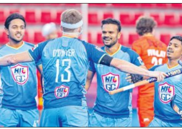
କାଉନସିଲ (ଜିଏ) ବଡ଼ ବିଜୟ ହାସଲ କରିଛି ।