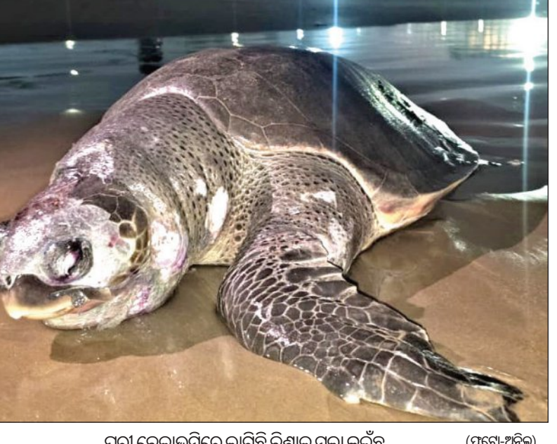
ପୁରୀ ବେଳାଭୂମିରେ ଲାଗିଛି ବିଶାଳ ମଲା କଇଁଛ (ଫଟୋ-ଅନିଲ)

ବାଲିକୁଦା/ଅସ୍ତରଙ୍ଗ, ୨୪।୧ (ସମ୍ପାଦକ): ବଙ୍ଗୋପସାଗର ଦେବୀନଦୀ ମୁହାଣ ନଡ଼ିଆଖୁଆ ନିକଟରୁ ଏକ ବିଶାଳ ତିନିମାଛର ମୃତଦେହ ଉଦ୍ଧାର ହୋଇଛି । ମାଛର ଲମ୍ବ ୩୦ ଫୁଟରୁ ଊର୍ଦ୍ଧ୍ଵ ହେବ ବୋଲି ଜଣାଯାଇଛି । ମତ୍ସ୍ୟଜୀବୀମାନେ ତିନିକୁ ଦେଖି ବନ୍ଦର ସାମୁଦ୍ରିକ ଆନା ଓ ବନ ବିଭାଗକୁ ସୂଚନା ଦେଇଥିଲେ । ବନ ବିଭାଗର ୨ ଜଣିଆ ସହସ୍ୟ ଏକ ବୋଟ୍ ଯୋଗେ ଘଟଣାସ୍ଥଳକୁ ଯାଇ ତିନିକୁ ଜରି ରହିଥିଲେ । ଏ ଫର୍ଦ୍ଦରେ ପରେଷ୍ଠର ପ୍ରିୟତମା ଦୁଇଜଣ କୁଜଙ୍ଗ ବନାଞ୍ଚଳ ଅଧିକାରୀଙ୍କୁ ଅବଗତ କରାଇଛନ୍ତି । ତିନିର ବ୍ୟବଚ୍ଛେଦ ପାଇଁ ଏକ ଡାକ୍ତରୀ ଦଳ ସହ ନନ୍ଦନକାନନର ଏକ ଟିମ୍ପର ସହାୟତା ନିଆଯାଇଛି । ଦେବୀନଦୀରେ ପାଣି ଛାଡ଼ି ଯାଇଥିବା କାରଣରୁ ଜୁଆର ଆସିବା ପର୍ଯ୍ୟନ୍ତ ଉକ୍ତ ସ୍ଥାନକୁ ଯିବା କଷ୍ଟସାଧ୍ୟ । ଯଦି ଆବଶ୍ୟକ ପଡ଼େ, ମାଂସ ବାହାର କରାଯାଇ କଳାଳକୁ ନନ୍ଦନକାନନ ନେବାର ବ୍ୟବସ୍ଥା ଗ୍ରହଣ କରାଯିବ । ତେବେ ସନ୍ଧ୍ୟା ୭ଟା ପରେ ଜୁଆର ଆସିବା ପରେ ଡାକ୍ତରୀ ଟିମ୍ ଘଟଣାସ୍ଥଳକୁ ଯାଇ ତିନିର ବ୍ୟବଚ୍ଛେଦ କରିବ ବୋଲି ପରେଷ୍ଠର ଶ୍ରୀ ଚୌଧୁରୀ ସୂଚନା ଦେଇଛନ୍ତି । ତିନିଟିର ବାର୍ଦ୍ଧକ୍ୟ ଜନିତ ମୃତ୍ୟୁ ନା ଆଘାତ କାରଣରୁ ହୋଇଛି, ବ୍ୟବଚ୍ଛେଦ ରିପୋର୍ଟ ଆସିବା ପରେ ଜଣାପଡ଼ିବ ବୋଲି ସେ କହିଛନ୍ତି ।