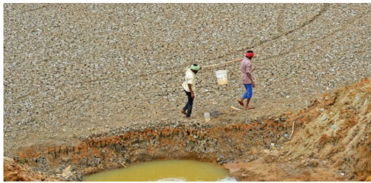
ଆପତନିୟମ ରାଜଧାନୀ କାର୍ତ୍ତବ୍ୟ ସମ୍ପୂର୍ଣ୍ଣ ଜଳଶୂନ୍ୟ ହେବାର ପ୍ରଥମ ଆଧୁନିକ ସହର ହେବାର ଆଶଙ୍କା ସୃଷ୍ଟି ହୋଇଛି। ସେହିପରି ଅତ୍ୟଧିକ ଜଳାଭାବ କାରଣରୁ ଚେନ୍ନଇରେ ସିଟି ପ୍ରତିବର୍ଷ ପ୍ରାୟ ୨୦ ହଜାର ଲକ୍ଷ ଟଙ୍କା ଧରିବା ଆର୍ଥାତ ଦିନକୁ ଦିନ ଲାଗିଛି। ଆମେରିକାର ଦକ୍ଷିଣ-ପଶ୍ଚିମ ରାଜ୍ୟଗୁଡ଼ିକରେ କଲୋରାଡ଼ା ନଦୀ ଜଳକୁ ନେଇ ଚଣାଓତରା ଚାଲିଛି।

ନୂଆଦିଲ୍ଲୀ, ୨୪୧୧ (ଏଜେକ୍ଟିଭ): ବିଶ୍ଵର ଅଧା ଜନସଂଖ୍ୟା ଏବେ ଜଳ ସଙ୍କଟ ଦେଇ ଗତି କରୁଛି। ଆର୍ଥାତ ୪୦୦ କୋଟି ଲୋକ ଘୋର ଜଳ ସଙ୍କଟ ରହିଛନ୍ତି। ଜାତିସମ୍ମତ ତରଫରୁ ପ୍ରକାଶିତ ଏକ ରିପୋର୍ଟରେ ଏକ ଭବ୍ୟ ଉଦ୍‌ବେଗଜନକ ତଥ୍ୟ ଦିଆଯାଇଛି। କେବେକ ସେତିକି ନୁହେଁ, ବିଶ୍ଵର ୧୦୦ଟି ବୃହତ୍ତମ ସହର ମଧ୍ୟରୁ ଅଧା ଆର୍ଥାତ ୫୦ଟି ସହର ଗମ୍ଭୀର ଜଳ ସଙ୍କଟର ସମ୍ମୁଖୀନ ହେଉଛନ୍ତି ବୋଲି ରିପୋର୍ଟରେ ଉଲ୍ଲେଖ କରାଯାଇଛି। ଏଥିରେ ଦିଲ୍ଲୀ, ବେଙ୍ଗାଳୁରୁ, ମୁମ୍ବାଇ ଓ ରିଓ ଉଲି ସହର ଅନ୍ତର୍ଭୁକ୍ତ।