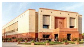
ନୂଆଦିଲ୍ଲୀ, ୨୪୧୧ (ଏଜେକ୍ଟିଭ): ଆସନ୍ତା ୨୮ ତାରିଖରୁ ସଂସଦର ବଜେଟ୍ ଅଧିବେଶନ ଆରମ୍ଭ ହେବାକୁ ଯାଉଛି। ଏହା ପୂର୍ବରୁ ସ୍ଵରାଜ୍ୟରେ ଗୃହ ଚଳାଇବା ପାଇଁ ସରକାର ପ୍ରସ୍ତୁତ ଆରମ୍ଭ କରିଦେଇଛନ୍ତି। ବଜେଟ୍ ଦିନକ ପୂର୍ବରୁ ୨୭ ତାରିଖରେ ସରକାର ସର୍ବଦଳୀୟ ବୈଠକ ଡକାଇଛନ୍ତି। କେନ୍ଦ୍ରମନ୍ତ୍ରୀ କିରନ ରିଜିକୁ ଡକାଇଥିବା ଏହି ବୈଠକ ୨୭ ତାରିଖ ସକାଳ ୧୧ଟାରେ ସଂସଦ ଭବନର ଆନେକ୍ଟି ମୁଖ୍ୟ କମିଟି କକ୍ଷରେ ଅନୁଷ୍ଠିତ ହେବ। ଏଥିରେ ବିରୋଧୀ ଏବଂ ସରକାର ଅଧିବେଶନର ଏକେଣ୍ଡା ଉପରେ ନିଜ ନିଜ ରାୟ ରଖିବେ। ସଂସଦର କାର୍ଯ୍ୟପୂର୍ବା ଏବଂ ଅଧିବେଶନର ଉଦ୍ଘାଟନ ହେବାକୁ ଥିବା ବିଭିନ୍ନ ପ୍ରସଙ୍ଗ ଉପରେ ମଧ୍ୟ ଚର୍ଚ୍ଚା କରାଯିବ। ସବୁ ଦଳର ରାୟ ଜାଣିବା ଏବଂ ହଜାମା ବିନା ଗୃହ ଚଳାଇବା ଏହି ବୈଠକର ଉଦ୍ଦେଶ୍ୟ। ମନରେଗା ବଦଳରେ ସରକାର ଆଣିଥିବା ବିକଶିତ ଭାରତ-ଗ୍ୟାରେଣ୍ଡି ଫର ରୋଜଗାର ଆଣ୍ଡ ଆଜିବାଦୀ ମିଶନ (ଭିବି ଜି-ରାମ-ଜି)କୁ ନେଇ ବିରୋଧୀ କଂଗ୍ରେସ ସାରା ଦେଶରେ ଅଭିଯାନ ଚଳାଇଥିବା ବେଳେ ଏହି