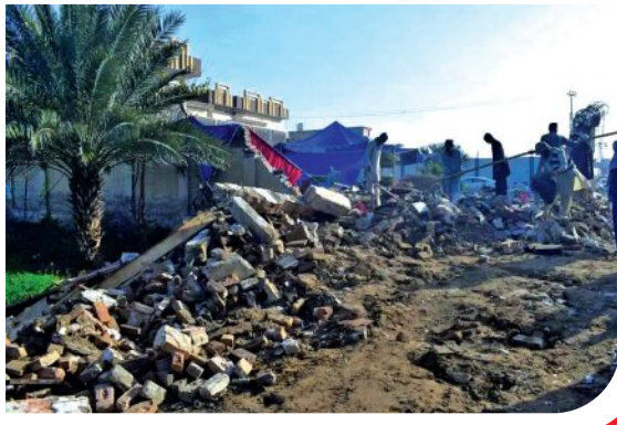
ଡେରା ଲସ୍‌ପାଲ ଖାନ, ୨୪୧୧ (ଏଜେକ୍ଟିଭ): ପାକିସ୍ତାନର ଖାଇବର ପଞ୍ଚମ୍‌ନିଶ୍ଟାରେ ତେରା ଲସ୍‌ପାଲ ଖାନ ନିକଟରେ ଶୁକ୍ରବାର ବିଳମ୍ବିତ ରାତିରେ ଏକ ଆମ୍ବୁତୀ ବିସ୍ଫୋରଣ ଘଟିଥିଲା। ଏଥିରେ ଅତିକମରେ ୭ ଜଣ ମୃତ୍ୟୁବରଣ କରିଥିବା ବେଳେ ୨୫ ଜଣ ଆହତ ହୋଇଛନ୍ତି ବୋଲି ଗଣମାଧ୍ୟମ ରିପୋର୍ଟରୁ ଜଣାଯାଇଛି।