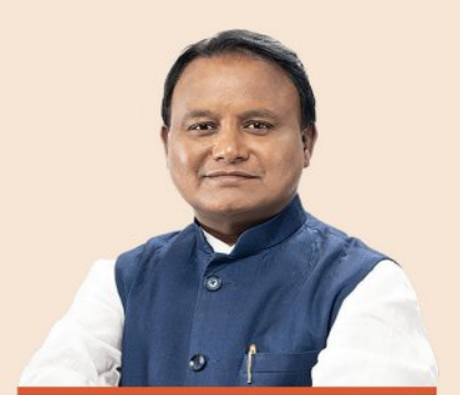
ଶ୍ରୀ ମୋହନ ଚରଣ ମାଝୀ ମୁଖ୍ୟମନ୍ତ୍ରୀ, ଓଡ଼ିଶା