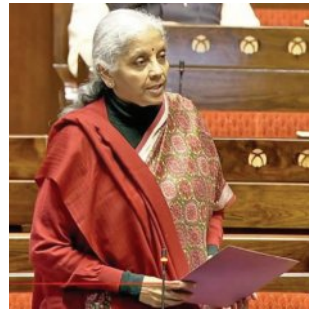
ଅନିଶ୍ଚିତତା ସତ୍ତ୍ୱେ ୨୦୨୫-୨୬ରେ ୬.୪% ରହିବ ଜିଡିପି ଅଭିବୃଦ୍ଧି ୨୦୨୬-୨୭ରେ ୬.୮%ରୁ ୬.୨% ମଧ୍ୟରେ ରହିବ ଅଭିବୃଦ୍ଧି ଦେଶର ଆଇଟି କ୍ଷେତ୍ର ପାଇଁ ଏଆଇ ବିପଦ; ବୃଦ୍ଧି ସୁନା-ରୁପା ମୂଲ୍ୟ

■ ନୂଆଦିଲ୍ଲୀ, ୨୯.୧ (ଏକେନ୍ଦ୍ରି): ସାଧାରଣ ବଜେଟ୍ ଆଗତ ହେବାର ତିନି ଦିନ ପୂର୍ବରୁ ସଂସଦରେ ଉପସ୍ଥାପିତ ହୋଇଛି ଆର୍ଥିକ ସର୍ତ୍ତେ ରିପୋର୍ଟ। କେନ୍ଦ୍ର ଅର୍ଥ ମନ୍ତ୍ରୀ ନିର୍ମଳା ସୀତାରମଣଙ୍କ ଦ୍ୱାରା ଉପସ୍ଥାପିତ ଏହି ରିପୋର୍ଟରେ ଦେଶର ବର୍ତ୍ତମାନର ଆର୍ଥିକ ଅଭିବୃଦ୍ଧି ଛବି ଉଜ୍ଜ୍ୱଳ ଗୋଲାପି ବୋଲି ଉଲ୍ଲେଖ କରାଯାଇଛି। ତେବେ ଆସନ୍ତା ଆର୍ଥିକ ବର୍ଷରେ ଦେଶର ଅଭିବୃଦ୍ଧି ହ୍ରାସ ପାଇବ ଓ ଜିଡିପି ହାର ୬.୪%ରୁ ହ୍ରାସ ପାଇ ୬.୮%ରୁ ୬.୨% ମଧ୍ୟରେ ପହଞ୍ଚିବ। ଚଳିତ ଆର୍ଥିକ ବର୍ଷରେ କୃଷି ଏବଂ ଆନୁଷ୍ଠାନିକ ସେବା କ୍ଷେତ୍ର ଆନୁମାନିକ ୩.୧% ହାରରେ ବୃଦ୍ଧି ପାଇବ। ମୌସୁମୀ ଅନୁକୂଳ ରହିବା କାରଣରୁ ଆର୍ଥିକ ବର୍ଷ ୨୦୨୫-୨୬ର ପ୍ରଥମାର୍ଦ୍ଧରେ କୃଷି କାର୍ଯ୍ୟକ୍ରମ ଉଲ୍ଲ