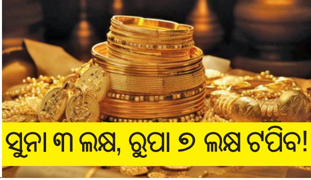
ସୁନା ୩ ଲକ୍ଷ, ରୁପା ୬ ଲକ୍ଷ ଟପିବ!

■ ଭୁବନେଶ୍ୱର, ୨୯.୧ (ସମ୍ବିଧ): ଘରୋଇ ବଜାରରେ ସମ୍ପତ୍ତି ହୁ ହୋଇ ବହୁଳ ସୁନା ଓ ରୁପା ଦର। ଏହି ଦୁଇ ଧାତୁ ମୂଲ୍ୟରେ ଦୈନିକ ନୂଆ ରେକର୍ଡ ପ୍ରତିଷ୍ଠା ହେଉଛି। ଇତିମଧ୍ୟରେ ଘରୋଇ ବଜାରରେ ସୁନା ଓ ରୁପା ମୂଲ୍ୟରେ ନୂଆ ସର୍ବକାଳୀନ ରେକର୍ଡ ସ୍ତରରେ ପହଞ୍ଚିଛି। ରାଜଧାନୀ ଭୁବନେଶ୍ୱରରେ ଆଜି ସୁନା ୧୦ ଗ୍ରାମ ପିଛା ୧.୭୭ ଲକ୍ଷ ଟଙ୍କାରେ ପହଞ୍ଚିଥିବା ବେଳେ ରୁପା ଦର କିଲୋ ପିଛା ରେକର୍ଡ ୪.୧୭ ଲକ୍ଷ ଟଙ୍କା ଅତିକ୍ରମ କରିଛି। ଅପରପକ୍ଷେ ବଜାର ବିଶେଷଜ୍ଞଙ୍କ ଆକଳନ ଅନୁଯାୟୀ, ୨୦୨୬ ଚତୁର୍ଥ ଡ୍ରେନାସିକ ସୁନା ୧୦ ଗ୍ରାମ ପିଛା ୩ ଲକ୍ଷ ଏବଂ ରୁପା କିଲୋ ୬ ଲକ୍ଷ ଟଙ୍କା ଅତିକ୍ରମ ଚଳିଯିବ। ବିଶ୍ୱ ଅର୍ଥନୈତିକ ଅନିଶ୍ଚିତତା