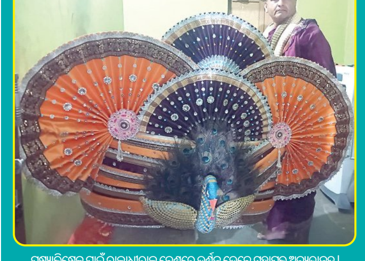
ପୁଷ୍ୟାଭିଷେକ ପାଇଁ ରାଜଧାନୀରେ ବେଶରେ ବର୍ଣ୍ଣନ ଦେବେ ମହାପୁରୁ ଅନୁଧ୍ୟାନୀୟ।