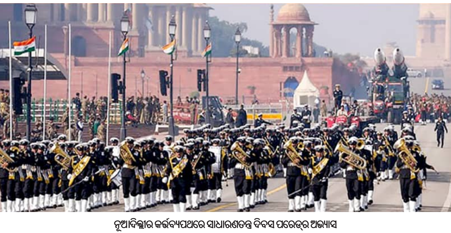
ନୂଆଦିଲ୍ଲୀର କର୍ତ୍ତବ୍ୟପଥରେ ସାଧାରଣତନ୍ତ୍ର ଦିବସ ପରଦର୍ଶନ ଅଭ୍ୟାସ