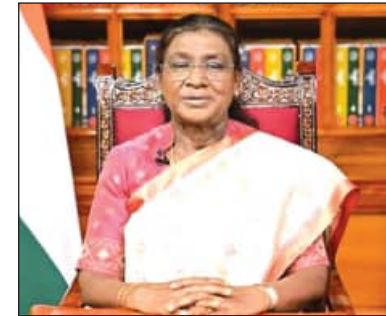
ରାଷ୍ଟ୍ରପତି କହିଛନ୍ତି ଯେ ଏହି ବର୍ଷ ଗଣତନ୍ତ୍ର ଦିବସ ସହିତ ବନ୍ଦେ ମାତରମର ୧୫୦ତମ ବାର୍ଷିକୀ ମଧ୍ୟ ପାଳନ କରାଯାଉଛି। ଗଣତନ୍ତ୍ର ଦିବସର ଏହି ପବିତ୍ର ଦିନ ଆମକୁ ଦେଶର ଅତୀତ, ବର୍ତ୍ତମାନ ଏବଂ ଭବିଷ୍ୟତ ବିଷୟରେ ଚିନ୍ତା କରିବା

■ ନୂଆଦିଲ୍ଲୀ, ୨୫.୧.୨୬ (ଏକେଡି): ଗଣତନ୍ତ୍ର ଦିବସର ପୂର୍ବ ସନ୍ଧ୍ୟାରେ ରାଷ୍ଟ୍ରପତି ଡ୍ରୌପଦୀ ମୁର୍ମୁ ଦେଶବାସୀଙ୍କୁ ସମ୍ବୋଧନ କରିଛନ୍ତି। ସେ ଗଣତନ୍ତ୍ର ଦିବସର ଶୁଭେଚ୍ଛା ଦେବା ସହିତ ଏହି ଉତ୍ସବ ଦେଶବାସୀଙ୍କ ରାଷ୍ଟ୍ରୀୟ ଏକତା ତଥା ଗୌରବ ଭାବନାକୁ ମଝେରୁତ କରୁଛି ବୋଲି କହିଛନ୍ତି। ଏହି ଅବସରରେ ରାଷ୍ଟ୍ରପତି ଶାନ୍ତି ବାଞ୍ଛା, ବିକାଶରେ ଅଲଗା ଅଲଗା କ୍ଷେତ୍ରର ଭୂମିକା, ନାରୀ ଶକ୍ତି, ଅପରେସନ ସିୟର, ଭୋଟର ଦିବସ ଏବଂ ପରିବେଶ ସଂରକ୍ଷଣ ଉପରେ ଅଭିଭାଷଣ ରଖିଛନ୍ତି। ପରିବେଶ ସଂରକ୍ଷଣକୁ ଏବେ ସର୍ବାଧିକ ପ୍ରାଧାନ୍ୟ ଦେବା ଉଚିତ ବୋଲି ରାଷ୍ଟ୍ରପତି କହିଛନ୍ତି। ପରିବେଶ ସମ୍ବନ୍ଧିତ ଅନେକ କ୍ଷେତ୍ରରେ ଭାରତ ବିଶ୍ୱର ମାର୍ଗଦର୍ଶନ କରିବା ଉଚିତ ବିଷୟ। ପ୍ରକୃତି ସହିତ ମିଶି ଚଳିବା ଭାରତୀୟ ସଂସ୍କୃତିର ଅନ୍ତର୍ଗତ ଶେଷ। ଏହି ଜୀବନଶୈଳୀ ବିଶ୍ୱ ସମୁଦାୟକୁ ଦିଆଯାଇଥିବା ବାଞ୍ଛା 'ଲାଇଫସ୍ଟାଇଲ ପର ଏନଭାଇମେଣ୍ଟ' ତଥା ଲାଇଫପର ଆଧାର। ପରବର୍ତ୍ତୀ ପିଢ଼ି ପାଇଁ ପୃଥ୍ୱୀମାତାରେ ସମୃଦ୍ଧ ଉପଲବ୍ଧ ରଖିବା ନିମନ୍ତେ ଆମକୁ ପ୍ରୟାସ କରିବାକୁ ହେବ। ରାଷ୍ଟ୍ରପତି ଶାନ୍ତିକୁ ନେଇ କହିଛନ୍ତି ଯେ ଆମ ସଂସ୍କୃତିରେ ସର୍ବଦା