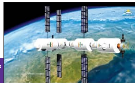
ପ୍ରସ୍ତୁତି ଆରମ୍ଭ କଲା ଇସ୍ତୋ

କୋଲକାତା, ୨୫୧ (ଏକେଡି): ସୁପ୍ରିମକୋର୍ଟଙ୍କ ନିର୍ଦ୍ଦେଶ ପାଳନ କରିବାକୁ ସୁପ୍ରିମକୋର୍ଟଙ୍କ ନିର୍ଦ୍ଦେଶ ପରେ ନିର୍ବାଚନ ଚଳୁଥିବା ବିକଳସ୍ଥିତି ରାତି ପର୍ଯ୍ୟନ୍ତ ବିଏଲଓକୁ ତାର୍କିକ ବିସଙ୍ଗତି ତଥା ଲଜିକାଲ ଅନାଧିକାରୀ ଥିବା ଲୋକଙ୍କ ତାଲିକା ଜାରି କରିଛନ୍ତି । ଇସିଙ୍କ ଖେଦସାଜତରେ ଏହାକୁ ଅପଲୋଭ କରାଯାଇଛି । ପଞ୍ଚାଶତ ବର୍ଷ ଏବଂ ଖାଡ଼ି କାର୍ଯ୍ୟକ୍ରମରେ ଏହାକୁ ପୋଷ୍ଟ କରାଯିବ । ସୂଚନା ଅନୁଯାୟୀ, ଦୁର୍ବଳ କରୁଥିବା ମମତା କହିଛନ୍ତି ।