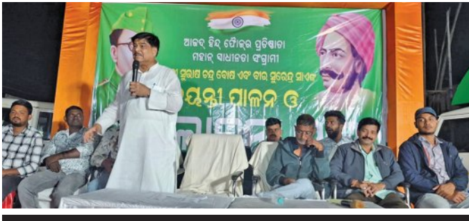
ଆଠଗଡ଼ରେ ନେତାଜୀଙ୍କ ଜୟନ୍ତୀ ଓ ମଶାଳ ଶୋଭାଯାତ୍ରା

ଆଠଗଡ଼,୨୪୧(ସମ୍ପାଦକ): ଭାରତୀୟ ସାଧନତା ସଂଗ୍ରାମର ଅନନ୍ୟ କ୍ଷମତା ବୃଦ୍ଧି ତଥା ଓଡ଼ିଶା ମା'ର ହୃଦୟ ବରପୁତ୍ର ନେତାଜୀ ସୁଭାଷ ଚନ୍ଦ୍ର ବୋଷ ଏବଂ ବୀର ସୁରେନ୍ଦ୍ର ସାଏଙ୍କ ଜନ୍ମ ଜୟନ୍ତୀ ଆଠଗଡ଼ଠାରେ ଅତ୍ୟନ୍ତ ଉତ୍ସାହ ଓ ଉଦ୍‌ଯତନା ମଧ୍ୟରେ ପାଳିତ ହୋଇଯାଇଛି। ଆଠଗଡ଼ ବିଜୁ ସ୍ମୃତ ଓ ଛାତ୍ର ଜନତା ଦଳ ପକ୍ଷରୁ ଆୟୋଜିତ ଏହି କାର୍ଯ୍ୟକ୍ରମରେ ଯୁବପିଢ଼ିଙ୍କୁ ଦେଶପ୍ରେମର ମନ୍ତବ୍ୟ ଦାକ୍ଷିଣ୍ୟ ଦେବାକୁ ଆହ୍ୱାନ ଦିଆଯାଇଛି। ଏହି ଅବସରରେ ଆଠଗଡ଼ ସହର ଉପକଣ୍ଠ ଅଟ୍ଟାଳୀ ଜଗନ୍ନାଥ ମନ୍ଦିର ନିକଟସ୍ଥ ରଥପଡ଼ା ଛକଠାକୁ ଏକ ବିଶାଳ ମଶାଳ ଶୋଭାଯାତ୍ରା ବାହାରିଥିଲା। ଏହି ଶୋଭାଯାତ୍ରା ସହର ପରିକ୍ରମା କରି ଲକ୍ଷ୍ମୀ ବଜାର ମଣ୍ଡପ ନିକଟରେ ପହଞ୍ଚିବା ପରେ