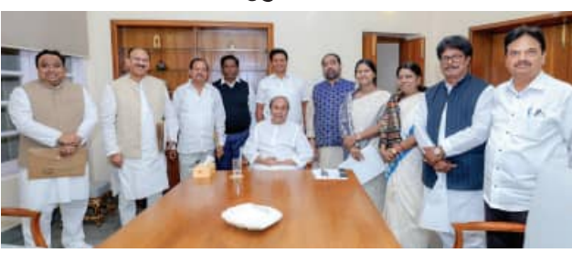
ନିର୍ବାଚନ ପ୍ରତିଶ୍ରୁତି ପ୍ରଚାରଣରେ ପରିଶତ ହୋଇଛି ଚାଷୀକୁଳକୁ ଧୋକା ଦେଇଛନ୍ତି ବିଜେଡି ସରକାର ରାଜ୍ୟବ୍ୟାପୀ ଆନ୍ଦୋଳନ ପାଇଁ ଶୁଭଶାନ୍ତ ଖସଡ଼ା