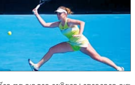
ପାର୍କରେ ୩ୟ ରାଉଣ୍ଡରେ ଖେଳିଥିଲେ। ସେତେବେଳେ ତାଙ୍କୁ ୪୪ ବର୍ଷ ହୋଇଥିଲା। ୧୦ଥର ବିଜେତା ନୋଭାକ ଜୋକୋଭିଚ୍, ଡିପେଷ୍ଟ

ମେଲବୋର୍ଣ୍ଣ, ୨୨।୧ (ଏକେଡ଼ି): ପୂର୍ବତନ ଚାମ୍ପିୟନ ସ୍ଟାନ୍ ଡାରିଙ୍ଗା ଏଠାରେ ଚାଲିଥିବା ବର୍ଷର ପ୍ରଥମ ଗ୍ରାଣ୍ଡସ୍ଲାମ୍ ଟେନିସ୍ ଚୁର୍ଣ୍ଣାମେଣ୍ଟ ଅଷ୍ଟ୍ରେଲିଆନ୍ ଓପନର ତୃତୀୟ ରାଉଣ୍ଡରେ ପ୍ରବେଶ କରିଛନ୍ତି। ଗୁରୁବାର ଅନୁଷ୍ଠିତ ପୁରୁଷ ସିଙ୍ଗଲ୍ସ ଦ୍ୱିତୀୟ ରାଉଣ୍ଡର ଏକ ମ୍ୟାଚ୍ରେ ପୁରୁଷ ଡାରିଙ୍ଗା ଡାରିଙ୍ଗା ୪-୬, ୬-୬, ୬-୬, ୬-୬, ୬-୬ (୩) ସେଟ୍‌ରେ ପ୍ରାୟୁ କାଲିଫୋର୍ଣ୍ଣିଆର ଆର୍ଟୋରୋଙ୍କୁ ପରାସ୍ତ କରିଥିଲେ। ଏଥିରେ ବିଶ୍ୱର ଦ୍ୱିତୀୟ ବୟୋଜ୍ୟେଷ୍ଠ ଖେଳାଳି ଭାବେ ଡାରିଙ୍ଗା କୌଣସି ଗ୍ରାଣ୍ଡସ୍ଲାମ୍ ମ୍ୟାଚ୍ ରାଉଣ୍ଡକୁ ଯୋଗ୍ୟତା ଅର୍ଜନ କରିଛନ୍ତି। ଡାରିଙ୍ଗାଙ୍କୁ ବର୍ତ୍ତମାନ ୪୦ ବର୍ଷ ୩୧୦ ଦିନ ହୋଇଛି। ବିଶ୍ୱର ବୟୋଜ୍ୟେଷ୍ଠ ଖେଳାଳି ଭାବେ ୪୮ ବର୍ଷ ତଳେ ଅଷ୍ଟ୍ରେଲିଆନ୍ କେନ୍‌ରୋସୋସିଲ ମେଲବୋର୍ଣ୍ଣ