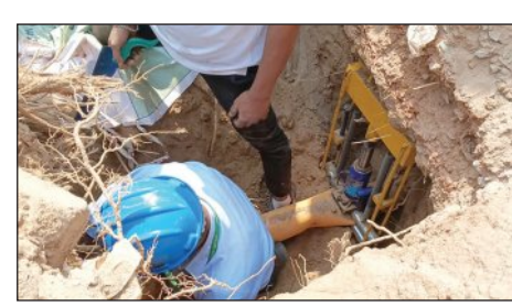
ଲାଇନ୍ କମ୍ପାନୀର ଅଧିକାରୀମାନେ ଘଟଣାସ୍ଥଳରେ ପହଞ୍ଚି ସ୍ଥିତି ନିୟନ୍ତ୍ରଣ କରିବାକୁ ଏକ ବଡ଼ବିଲରେ ଅବସ୍ଥା ରଖି ଯାଇଥିଲେ। ସୁତରାଫୁ, ଗ୍ୟାସ୍ ପାଇପ୍ ଲାଇନ୍ ଫାଟି ଏକ ପେଟ୍ରୋଲ

କଟକ, ୧୯/୧୨(ସମ୍ପାଦକ): ସୁ... ସୁ ଗର୍ଜନ କରି ଆଗେଇ ଉଦ୍‌ଗାରଣ ଭଳି ମାଟି ତଳୁ ଗ୍ୟାସ୍ ବାହାରିଲା। ଫାଟାଫାଟୁ ୫୦ ଫୁଟ ଉଚ୍ଚ ଯାଏଁ ଗ୍ୟାସ୍ ଉଠି ବାୟୁମଣ୍ଡଳରେ ଖେଳିଗଲା। କେହି କିଛି ହୁଡ଼ିବା ଆରମ୍ଭ ପୂର୍ବେ ଅଞ୍ଚଳଟା ଏଲର୍ଡି (ଉଚ୍ଚ ନାଭୀ) ଗଞ୍ଜରେ ଫାଟି ପଡ଼ିଲା। ଦୋକାନୀଙ୍କଠାରୁ ଆରମ୍ଭ କରି ପଥରାଗା, ଯିଏ ଯୁଆଡ଼େ ପାରିଲେ ଦୌଡ଼ିଲେ। ପୂର୍ବା ଅଞ୍ଚଳରେ ଏକ ଭୟର ବାତାବରଣ ଖେଳିଗଲା। କଟକ ସିଟିଏ ସେକ୍ଟର-୯ ଅଞ୍ଚଳରେ ଆଜି ଏପରି ଏକ ଦୁର୍ଘଟଣା ଦେଖିବାକୁ ମିଳିଛି। ମାଟି ତଳେ ଯାଇଥିବା ଗ୍ୟାସ୍ ଲାଇନ୍ ଫାଟି ଭୟାବହ ପରିସ୍ଥିତି ସୃଷ୍ଟି ହୋଇଥିଲା। ଭାରୀ ଯନ୍ତ୍ରପାତି ଦ୍ୱାରା ନିର୍ମାଣ କାର୍ଯ୍ୟ ଚାଲିଥିବା ବେଳେ ଏହି ଅଘଟଣ ଘଟିଥିଲା। ଅଗ୍ନିଶମବାହିନୀ ଓ ଗ୍ୟାସ୍ ପାଇପ୍