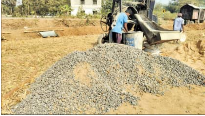
ସିମେଣ୍ଟ ଓ ବାଲିର ଅନୁପାତ ଠିକ୍ ରହୁ ନ ଥିବାରୁ ଏହି ନାଲିର ଘାସି ଦେଇ ବଡ଼ ପ୍ରଶ୍ନବାଚୀ ସୃଷ୍ଟି ହୋଇଛି। କାର୍ଯ୍ୟସ୍ଥଳରେ କୌଣସି ସୂଚନା ଫଳକ ଲଗାଯାଇ

ପଞ୍ଚାୟତର ଠିକାଦାରଙ୍କ ସମାପ୍ତତ୍ୱରେ ଅତି ନିମ୍ନମାନର କାର୍ଯ୍ୟ ଚାଲିଥିବା ଅଭିଯୋଗ ହୋଇଛି। ଅଭିଯୋଗ ଦାଖଲ ପାଇଁ ସରକାର ଲକ୍ଷ ଲକ୍ଷ ଟଙ୍କା ଅନୁଯାୟୀ, ଗଢ଼େଶ୍ୱର ପାଣି ପଞ୍ଚାୟତର କାଡ଼ା ବିଭାଗ କରିଥାନ୍ତେ ଏହି ନିର୍ମାଣ