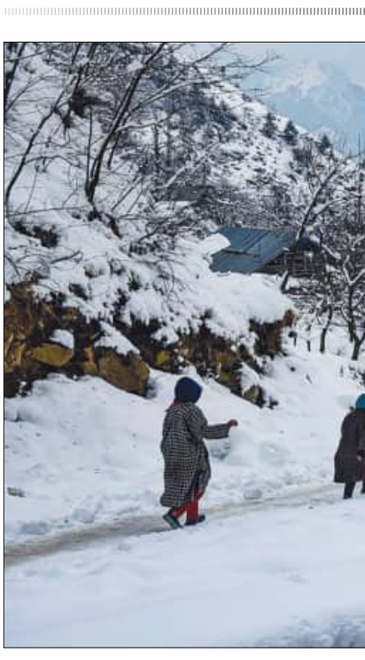
ଗ୍ରୀନରଗରରେ ବରଫ ଝଡ଼: ମକା ନେଇଛନ୍ତି ପର୍ଯ୍ୟଟକ

ଝାଞ୍ଚି, ୧୧/୧୨ (ଏକେନ୍ଦ୍ରି): ଗ୍ରୀନଲାଣ୍ଡକୁ ନେଇ ଆମେରିକା ଆଗାମୀ ଦିନରେ ଏକ ବୃହତ୍ ତଥା ନିର୍ଣ୍ଣାୟକ ନିଷ୍ପତ୍ତି ନେବ ବୋଲି ମନେ କରାଯାଉଛି । ଆମେରିକା ରାଷ୍ଟ୍ରପତି ତୋନାଲୁ ଟ୍ରମ୍ପ ଗ୍ରୀନଲାଣ୍ଡକୁ ମିଶାଇବା ପାଇଁ ଯୋଜନା ପ୍ରସ୍ତୁତ ଓ ଏହାକୁ କାର୍ଯ୍ୟକାରୀ କରିବାକୁ ନିର୍ଦ୍ଦେଶ ଦେଇଛନ୍ତି । ତେଲି ମେଲ୍ ଅନୁଯାୟୀ, ଟ୍ରମ୍ପ ଏହି ଦାୟିତ୍ୱ ଜଣାଇ ଦେଖାଇ ଅପରେସନ କମାଣ୍ଡ (ଜେଏସ୍‌ସି)କୁ ପ୍ରଦାନ କରିଛନ୍ତି । ତେବେ ସେନା ଅଧିକାରୀମାନେ ଟ୍ରମ୍ପଙ୍କ ଏହି ବିଚାର ଓ ଯୋଜନା ସହ ସହମତି ପ୍ରକାଶ କରିନାହାନ୍ତି । ଏହାକୁ ଆଲନଗତ ଭାବେ ଅଧିକ ମନେ କରନ୍ତି ବୋଲି କହିଛନ୍ତି । ଏକ ରିପୋର୍ଟରେ କୁହାଯାଇଛି ଯେ, ଟ୍ରମ୍ପ ଏହି ରୁଚି ତଥା ଆଭିମୁଖ୍ୟ ଘରୋଇ ରାଜନୀତି ସହ ଜଡ଼ିତ ହୋଇପାରେ । ଚଳିବର୍ଷ ଶେଷ ଆଡ଼କୁ ମଧ୍ୟବର୍ତ୍ତୀକାଳୀନ ନିର୍ବାଚନ ହେବାକୁ ଯାଉଛି । ରିପବ୍ଲିକାନ ପାର୍ଟି ସଂସଦରେ