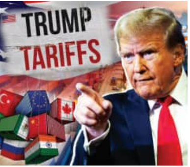
ବନ୍ଦ ହୋଇଯିବ କାରଖାନା

ନୂଆଦିଲ୍ଲୀ, ୧୧୧୧ (ଏକେନି): ପ୍ରମୁଖ ଗାରିପ୍ ବା ବାଣିଜ୍ୟ ଶୁଳ୍କ ଭୟରେ ସାରା ବିଶ୍ୱ ଅଧିକ। ଏଥିରେ ଏବେ ଆମେରିକା ରାଷ୍ଟ୍ରପତି ଡୋନାଲ୍ଡ ଟ୍ରମ୍ପ ଦେଇଥିବା ସାନି ୫୦୦% ଗାରିପ୍ ଧମକ ଦେଖିବା ବ୍ୟବସାୟ ଏବଂ ଶିଳ୍ପ କ୍ଷେତ୍ରରେ ଭୟର ବାତାବରଣ ସୃଷ୍ଟି କରିଛି। ତାମିଲନାଡୁ ସରକାର ପ୍ରମୁଖ ପ୍ରସ୍ତାପନର ଶୁଳ୍କକୁ ନେଇ ଆତଙ୍କ ଦେଖାଦେବାକୁ ଥିବା ପରିସ୍ଥିତି ସମ୍ପର୍କରେ କେନ୍ଦ୍ର ସରକାରଙ୍କୁ ଏକ ବଡ଼ ଚେତାବନୀ ଦେଇଛନ୍ତି। ଏଥିରେ କୁହାଯାଇଛି ଯେ ଯଦି ବର୍ତ୍ତମାନର ପରିସ୍ଥିତି ଜାରି ରୁହେ, ତେବେ ରାଜ୍ୟରେ ପ୍ରାୟ ୩୦ ଲକ୍ଷ ଲୋକ ତୁରନ୍ତ ଚାକିରି ହରାଇବେ। ଅନେକ ମଧ୍ୟ ଏବଂ କ୍ଷୁଦ୍ର କାରଖାନା ବନ୍ଦ ହୋଇଯିବ। ଏହା ଜାତୀୟ ଚିନ୍ତାଧାର ବିଷୟ। କେନ୍ଦ୍ର ଅର୍ଥମନ୍ତ୍ରୀ ନିର୍ମଳା ସୀତାରମଣଙ୍କ