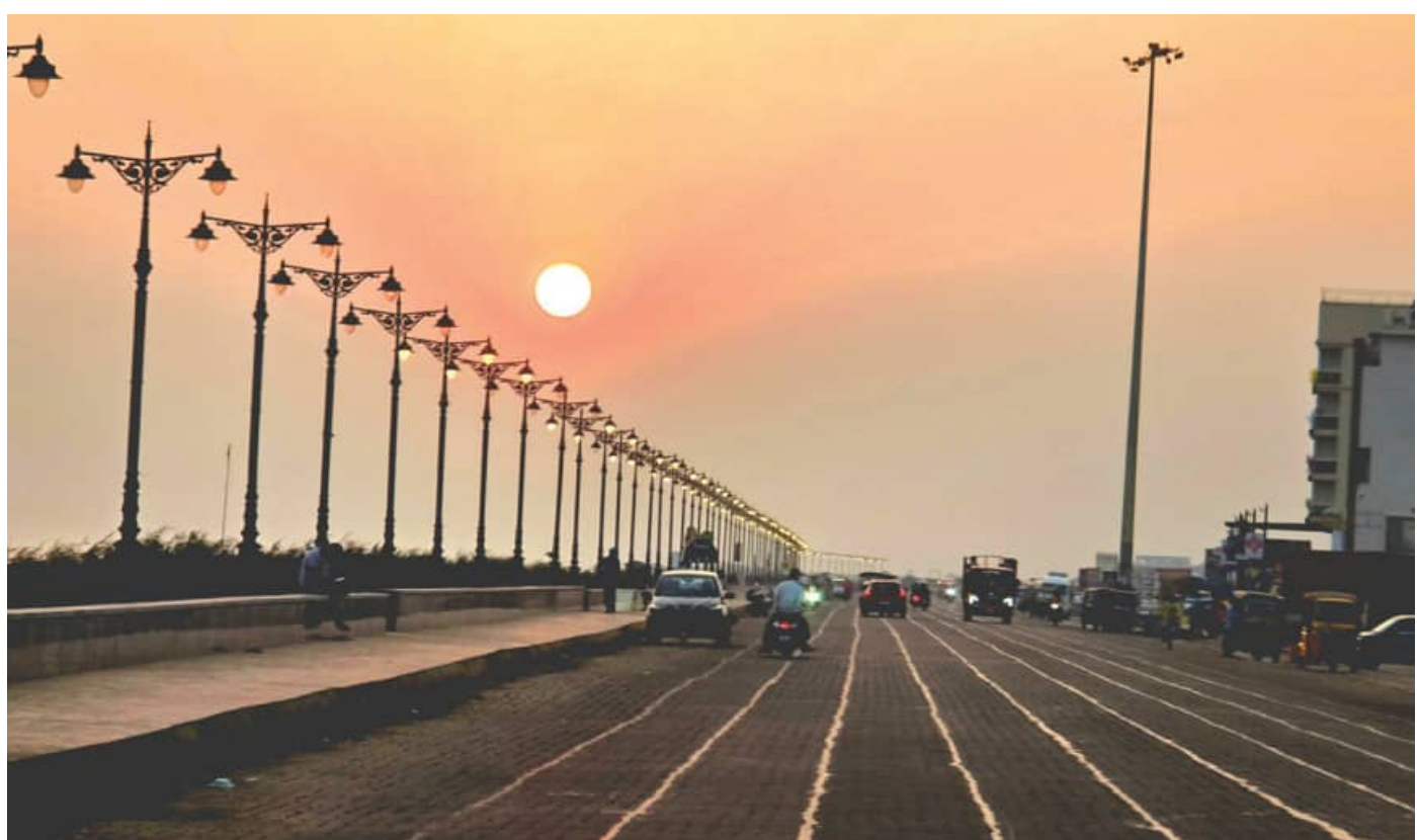
ଗୋଧୂଳି ବେକାର ବେକାରୁମି ମାର୍ଗ

ଚାହା ସହଜରେ ଅନୁମାନ କରାଯାଇପାରିବ । ଉକ୍ତ କୋଠାଟି ନିର୍ମାଣର ୨ ବର୍ଷରେ ଏପରି ଅବସ୍ଥା ହେବା ନିର୍ମାଣ କାର୍ଯ୍ୟର ମାନ ଉପରେ ପ୍ରଶ୍ନାଚାରୀ ସୃଷ୍ଟି କରିଛି । ରୋଗୀଙ୍କ ଚିକିତ୍ସା ପାଇଁ ଥିବା ସରକାରୀ କୋଠାରେ ଏଭଳି ଅବସ୍ଥା ନେଇ ଲୋକେ ଚିନ୍ତା ପ୍ରକଟ କରିଛନ୍ତି । ଏହାର ରକ୍ଷଣାବେକ୍ଷଣ ପୂର୍ଣ୍ଣ ବିଭାଗ କରିବାକୁ ଥିବା ବେଳେ ଅନୁଦାନ ଅଭାବରୁ ନିର୍ମାଣ ହୋଇପାରୁନାହିଁ ।