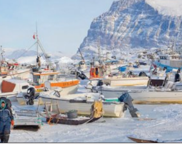
ସୈନିକଙ୍କ ଉପସ୍ଥିତି ଚିହ୍ନ ସୃଷ୍ଟି କରିଛି । ଆଗାମୀ ୨୦ ଦିନ ମଧ୍ୟରେ ସେ ଗ୍ରୀନଲାଣ୍ଡ ସମ୍ପର୍କରେ ଆଲୋଚନା କରିବେ । ଉଲ୍ଲେଖାଥାଉ କି, ଗ୍ରୀନଲାଣ୍ଡ ହେଉଛି ସ୍କାଣ୍ଡିନାଭିଆନ ଦେଶ ତେଜମାର୍କରେ ଏକ

ସଂଘ ଶାସିତ ଅଟେ । ଏହା ମଧ୍ୟ ସାମରିକ ମେଣ୍ଟର ନାଟୋର ଅଂଶ ବିଶେଷ । ଗ୍ରୀନଲାଣ୍ଡରେ ତେଜମାର୍କର ୨୦୦ ସୈନିକ ମୁଠାନ୍ତ ଅଛନ୍ତି । ଗ୍ରୀନଲାଣ୍ଡକୁ ଅକ୍ତିଆର କରିବାକୁ ଆମେରିକା ସାମରିକ ପଦକ୍ଷେପ ନେବ ବୋଲି ଆଲୋଚନା ହେଉଥିବା ବେଳେ ଆମେରିକା ବୈଦେଶିକ ମନ୍ତ୍ରୀ ମାର୍କ ରୁବିଓ ଭିନ୍ନ କଥା କହିଛନ୍ତି । ଆମେରିକା ଗ୍ରୀନଲାଣ୍ଡ ଉପରେ ଆକ୍ରମଣ କରିବନାହିଁ, ବର୍ଷ ଏହାକୁ ତେଜମାର୍କଠାରୁ କ୍ରମ କରିବ । ଏ ନେଇଥିବା ବିଭିନ୍ନ ବିକଳ୍ପର ସମାନ କରାଯାଇଛି । ଗ୍ରୀନଲାଣ୍ଡ ଆମେରିକାର ଏକ ଅଂଶ ହେଉ ଓ ଭବିଷ୍ୟତରେ ଗ୍ରୀନଲାଣ୍ଡ ନେଇ ଆମେରିକା ସହ ଜାହାଜ ସଂଘର୍ଷ ନ ହେଉ ବୋଲି ସରକାର ଚାହୁଁଥିବା ରୁବିଓ କହିଛନ୍ତି । ଗ୍ରୀନଲାଣ୍ଡର ନିଜର ସେନା ନାହିଁ । ଏଠାରେ ଆମେରିକାର ଓ ତେଜମାର୍କର ସୈନିକ ମୁଠାନ୍ତ ଅଛନ୍ତି ।