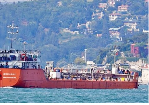
ସୈନିକ ହେଲିକପ୍ଟରରୁ ଏହି ଜାହାଜରେ ଓହ୍ଲାଇ ସମସ୍ତଙ୍କୁ ବନ୍ଦା କରିଥିଲେ । ଏହି ସମୟରେ ରୁଷର ଜାହାଜ ଉପସ୍ଥିତ ଥିବା ସତ୍ତ୍ୱେ ସାମରିକ ସଂଘର୍ଷକୁ ଏଡ଼ାଇ ଦିଆଯାଇଥିଲା । ଏ ନେଇ ରୁଷ ପକ୍ଷରୁ କୌଣସି ପ୍ରତିକ୍ରିୟା ଦିଆଯାଇ ନାହିଁ । ଏହା ମଧ୍ୟରେ ରୁଷ ଗଣମାଧ୍ୟମ ଜାହାଜ ପାଖରେ ଥିବା ହେଲିକପ୍ଟର ପଟେ ଜାରି କରିଛି ।

ଉପରେ କଟକଣା ଲଗାଇ ଥିଲା । ଗତ ତିସେମ୍ବରରେ ଏହା ଭେନେଜୁଏଲାରୁ ଆଣିବାକୁ ଯାତ୍ରା ଆରମ୍ଭ କରିଥିଲା । ମାତ୍ର ଆମେରିକା ତତକ୍ଷଣା ବାହିନୀ ଏହାକୁ ରୋକିବାକୁ ପ୍ରୟାସ କରିଥିଲା । ସେହି ସମୟରେ ଜାହାଜର କ୍ୟୁ