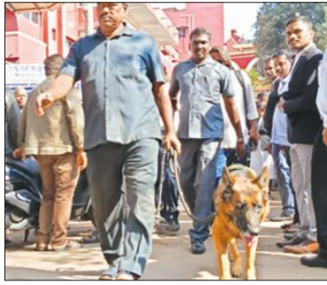
ଜଣାପଡ଼ିଥିଲା। ଉଚ୍ଚମେଲରେ କୋର୍ଟ ପରିସର ଗର୍ଭିତ ସ୍ଥାନରେ ଘାଟା ବୋମା ଖଞ୍ଜା ଯାଇଛି ଏବଂ ଦିନ ୨ଟା ୪୫ରେ ତାହା ବିସ୍ଫୋରଣ ହେବ। ଏହା ପୂର୍ବରୁ କୋର୍ଟ ଖାଲିକରି ଦେବା ଅର୍ଥାତ ସମସ୍ତେ ବାହାରିଯିବା ପାଇଁ

ପ୍ରଥମେ ଜିଲ୍ଲା କୋର୍ଟ ରେଜିଷ୍ଟ୍ରାରଙ୍କ ଜି-ମେଲ ଆଇଡିଆ ଆସିଥିବା ଏକ ସହିଷ୍ଣୁ ମେଲ ସମ୍ପର୍କରେ