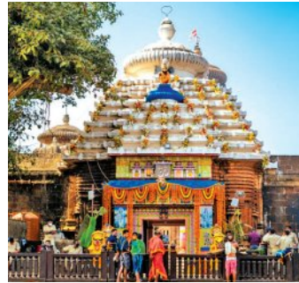
କ୍ରମାଗତ ଦ୍ୱିତୀୟ ବର୍ଷ ପାଇଁ ମକରରେ ଓପାସ ରହିଲେ ଦିଅଁ

■ ଭୁବନେଶ୍ୱର, ୧୪।୧ (ସମିପ): ବାରିବାଟି ସମ୍ପର୍କି, ହଜାର ହଜାର ସେବାୟତ। ମାତ୍ର ମକର ସଂକ୍ରାନ୍ତି ପରି ପବିତ୍ର ଦିନରେ ମହାପ୍ରଭୁ ଲିଙ୍ଗରାଜ ଖାଡ଼ା ଓପାସ।