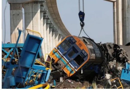
୬୫ ଫୁଟ ଉଚ୍ଚର କ୍ଲେନ୍ ଖସିଲା ଉପରେ ଟ୍ରେନ୍ ଲାଲନରୁପତ, ଏକାଧିକ ବଗି ଖଟିଗୁଡ଼ିକ

■ ବ୍ୟାଙ୍କକ୍, ୧୪।୧ (ଏକେନ୍ସି): ଆଲକାଣ୍ଡରେ ଗତକାଲି ଏକ ଏକ୍ସପ୍ରେସ ଟ୍ରେନ୍ ଉପରେ ୬୫ ଫୁଟ ଉଚ୍ଚର କ୍ଲେନ୍ ଖସିବା ଫଳରେ ଟ୍ରେନ୍‌ର ଏକାଧିକ ବଗି ଖଟିଗୁଡ଼ିକ ହୋଇଛି। ଦୁର୍ଘଟଣାରେ ୨୯ ଜଣ ପ୍ରାଣ ହରାଇଥିବା ବେଳେ ୮୦ ଜଣ ଆହତ ହୋଇଛନ୍ତି। ରେଳ ବ୍ରିକ୍ ନିର୍ମାଣ ପାଇଁ ଏହି କ୍ଲେନ୍‌କୁ ବ୍ୟବହାର କରାଯାଇଥିଲା। ଦୁର୍ଘଟଣା ସମୟରେ ଟ୍ରେନ୍‌ରେ ୧୯୫ଜଣ ଯାତ୍ରୀ କରୁଥିଲେ। ମୃତକଙ୍କ ମଧ୍ୟରେ ଅଧିକାଂଶ ଯୁକ୍ତ ଛାତ୍ର ଥିଲେ ବୋଲି ଅଧିକାରୀଙ୍କ ଚର୍ଚ୍ଚା କୁହାଯାଇଛି। ଦୁର୍ଘଟଣା ସମୟରେ ଟ୍ରେନ୍ ପାଖାପାଖି ଯଶାପୁତି ୧୨୦ କିମି କେଶରେ ଗତି କରୁଥିଲା। ଫଳରେ ହ୍ରାସିତ ହେବାକୁ ଲାଗିଥିବା ବୁଧାପୁର ମିଳି ନଥିଲା। ଏହି ଦୁର୍ଘଟଣା ରାଶୋନ । ପୃଷ୍ଠା-୭