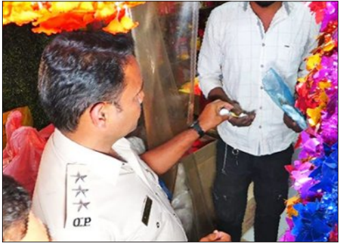
ଆଡ଼କୁ ଯାଉଥିଲେ। ପୋଖରୀପୁଟ୍ ଜଳରେ ପହଞ୍ଚିବା ବେଳକୁ ମାଞ୍ଚା ସୂତା ଲାଗି ତାଙ୍କ ବେକ କଟି ଯାଇଥିଲା।