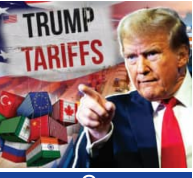
ବନ୍ଦ ହୋଇଯିବ କାରଖାନା

ନୂଆଦିଲ୍ଲୀ, ୧୧୧୧ (ଏକେନି): ପ୍ରମୁଖ ଗାରିପ୍ ବା ବାଣିଜ୍ୟ ଶୁଳ୍କ ଭୟରେ ସାରା ବିଶ୍ୱ ଅଧିକ। ଏଥିରେ ଏବେ ଆମେରିକା ରାଷ୍ଟ୍ରପତି ଡୋନାଲ୍ଡ ଟ୍ରମ୍ପ ଦେଇଥିବା ସାନିଟି ୫୦୦% ଗାରିପ୍ ଧମକ ଦେଖିବା ବ୍ୟବସାୟ ଏବଂ ଶିଳ୍ପ କ୍ଷେତ୍ରରେ ଭୟର ବାତାବରଣ ସୃଷ୍ଟି କରିଛି। ତାମିଲନାଡୁ ସରକାର ପ୍ରମୁଖ ପ୍ରସାଧନର ଶୁଳ୍କକୁ ନେଇ ଆତଙ୍କ ଦେଖାଦେବାକୁ ଥିବା ପରିସ୍ଥିତି ସମ୍ପର୍କରେ କେନ୍ଦ୍ର ସରକାରଙ୍କୁ ଏକ ବଡ଼ ଚେତାବନୀ ଦେଇଛନ୍ତି। ଏଥିରେ କୁହାଯାଇଛି ଯେ ଯଦି ବର୍ତ୍ତମାନର ପରିସ୍ଥିତି ଜାରି ରୁହେ, ତେବେ ରାଜ୍ୟରେ ପ୍ରାୟ ୩୦ ଲକ୍ଷ ଲୋକ ତୁରନ୍ତ ଚାକିରି ହରାଇବେ। ଅନେକ ମଧ୍ୟ ଏବଂ କ୍ଷୁଦ୍ର କାରଖାନା ବନ୍ଦ ହୋଇଯିବ। ଏହା ଜାତୀୟ ଚିନ୍ତାର ବିଷୟ। କେନ୍ଦ୍ର ଅର୍ଥମନ୍ତ୍ରୀ ନିର୍ମଳା ସୀତାରମଣଙ୍କ