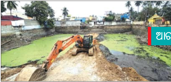
ଆରମ୍ଭ ହେଲା ପୁନରୁଦ୍ଧାର କାମ

ପୋଖରୀର ପୁନରୁଦ୍ଧାର ଲାଗି ପଦକ୍ଷେପ ନିଆଯାଇଥିଲା । ଏଥିଲାଗି ୨୬ଲକ୍ଷ ୫୨ହଜାର ୯୯୩ ଟଙ୍କା ବ୍ୟୟ ଅଟେ ବୋଲି କୁହାଯାଇଛି । ଏହି ଅନୁଦାନରେ ପୋଖରୀର ପୁନରୁଦ୍ଧାର, ପାହାଚ, ଚତୁର୍ଦ୍ଦିଗରୁ ମା' ପୁରୀ ପାଟେରି, ଲକ୍ଷ୍ମୀ ଷ୍ଟେଡିଂ ଓ ଉତ୍କଳ ଆଲୋକାକରଣ ବ୍ୟବସ୍ଥା ରହିଥିଲା । ୨୦୧୪ରେ ଏହାର ପୁନରୁଦ୍ଧାର କାମ ଆରମ୍ଭ ହୋଇଥିଲା । ପୋଖରୀରୁ ପକୋଧାର ସହ ଲକ୍ଷ୍ମୀ ଷ୍ଟେଡିଂ,