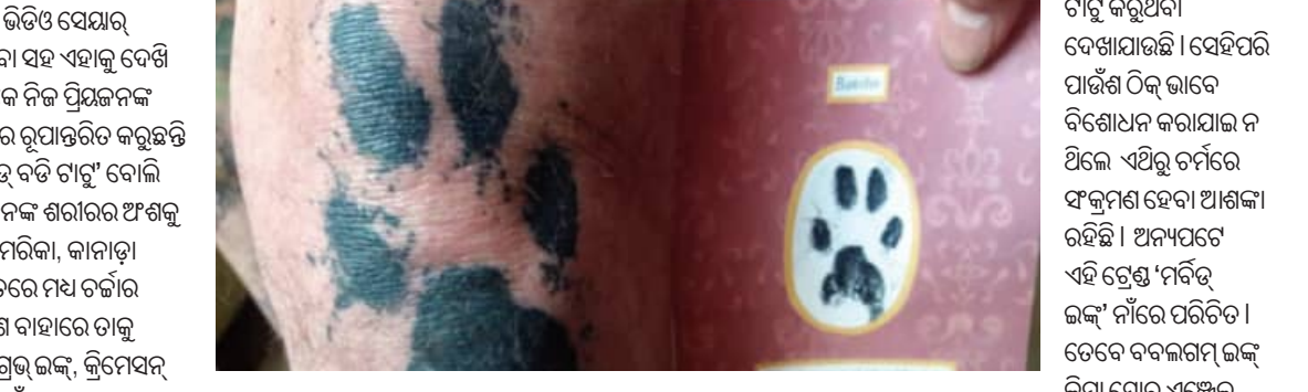
କରି ଚାହୁଁ ଆର୍ଟିଷ୍ଟଙ୍କ ପାଖକୁ ଯାଆନ୍ତା। ଏହାପରେ ଚାହୁଁ ଆର୍ଟିଷ୍ଟ ଜଣକ ଏହାକୁ କୁ-ଏଣ୍ଡଙ୍କ ଶରୀରରେ ଖୋଦେଇଥାନ୍ତି। ଅଧିକାଂଶ ମାମଲାରେ କେବଳ ଏକ ଚାମଚ ଅଭି ପାଇଁ ଚାହୁଁ ବ୍ୟବହାର କରାଯାଏ। କିଛି ଲୋକ ନିଜ ବାପା, ଭାଇ, ପୋଷା ପ୍ରାଣୀଙ୍କ ପାଇଁ ଶରୀର ଚାହୁଁ କରୁଥିବା ଦେଖାଯାଇଛି। ସେହିପରି ପାଇଁ ଚାହୁଁ ଠିକ୍ ଭାବେ ବିଶୋଧନ କରାଯାଇ ନ ଥିଲେ ଏଥିରୁ ଚର୍ମରେ ସଂକ୍ରମଣ ହେବା ଆଶଙ୍କା ରହିଛି। ଅନ୍ୟପଟେ ଏହି ଟ୍ରେଣ୍ଡ 'ମିଡି-ଇଙ୍କ୍' ନାଁରେ ପରିଚିତ। ତେବେ ବବଲଗମ୍ ଇଙ୍କ୍ କିମ୍ବା ଷୋର୍ଟ ଏଞ୍ଜେଲ୍ ଇଙ୍କ୍ ଭଳି କମ୍ପାନିଗୁଡ଼ିକ ମଧ୍ୟ ଏହି ସେବା ପ୍ରଦାନ କରୁଛନ୍ତି।

ସାମାଜିକ ଗଣମାଧ୍ୟମରେ ଏକ ନୂଆ ଫେଶନ ଟ୍ରେଣ୍ଡର ଭିତ୍ତି ଓ ସେୟାର କରାଯାଇଛି। ଯାହାକି ସମସ୍ତଙ୍କ ଦୃଷ୍ଟିଆକର୍ଷଣ କରିବା ସହ ଏହାକୁ ଦେଖି ଲୋକେ ଆକର୍ଷିତ ହୋଇଛନ୍ତି। ତେବେ ଏବେ ଲୋକେ ନିଜ ପ୍ରିୟଜନଙ୍କ ପୂର୍ଣ୍ଣ ପରେ ସେମାନଙ୍କ ଅଭି ପାଇଁ ଚାହୁଁ କାଳି ବା ସାହିରେ ରୁପାନ୍ତରିତ କରୁଛନ୍ତି ଏବଂ ସେଥିରେ ଶରୀରରେ ଚାହୁଁ କରୁଛନ୍ତି। ଏହି ଚାହୁଁ 'ଡେଡ୍ ବଡି ଚାହୁଁ' ବୋଲି କୁହାଯାଇଛି। ଏଭଳି କରିବାର ଉଦ୍ଦେଶ୍ୟ ହେଉଛି, ନିଜ ପ୍ରିୟଜନଙ୍କ ଶରୀର ଅଂଶକୁ ସବୁଦିନ ପାଇଁ ନିଜ ସାଇରେ ରଖିବା। ଏହି ଟ୍ରେଣ୍ଡ ପୂର୍ବରୁ ଆମେରିକା, କାନାଡା ଏବଂ ଯୁରୋପରେ ଲୋକପ୍ରିୟ ହୋଇଥିଲା। ଏବେ ଏହା ଭାରତରେ ମଧ୍ୟ ଚର୍ଚ୍ଚାର ବିଷୟ ପାଲଟିଛି। ମୃତଶରୀର ଦାହ ହେବା ପରେ ଯେଉଁ ପାଇଁ ଗାହାରେ ଚାହୁଁ ଚାହୁଁ କରିବା ପାଇଁ ଅଧିକ ଫାଇଦା କରିବାକୁ ପଡ଼ିଥାଏ। ଏନଗ୍ରେଡ୍ ଇଙ୍କ୍, କ୍ରିମେସନ୍ ଇଙ୍କ୍ ଭଳି କମ୍ପାନି ଏହି କାର୍ଯ୍ୟ କରିଥାଆନ୍ତି। ଏହି ପ୍ରକ୍ରିୟାରେ ପାଇଁ ଚାହୁଁ ପ୍ରଥମେ ଉଚ୍ଚ ତାପମାତ୍ରାରେ ବିଶୁଦ୍ଧ କରାଯାଏ। ଏହାପରେ ଏହାକୁ ଅଲଟ୍ରା ପାଇନ୍ କରାଯାଇ କାଳିରେ ମିଶାଇବା ପାଇଁ ପ୍ରସ୍ତୁତ କରାଯାଏ। ଏହି ପୂରା ପ୍ରକ୍ରିୟା ୪ ସପ୍ତାହ ପର୍ଯ୍ୟନ୍ତ ଚାଲେ। ସେହିପରି ପ୍ରତ୍ୟେକ ପର୍ଯ୍ୟାୟକୁ ଟ୍ରାକ୍ କରାଯାଏ। ତା'ପରେ ଏହାକୁ ବୋତଲରେ ବନ୍ଦ