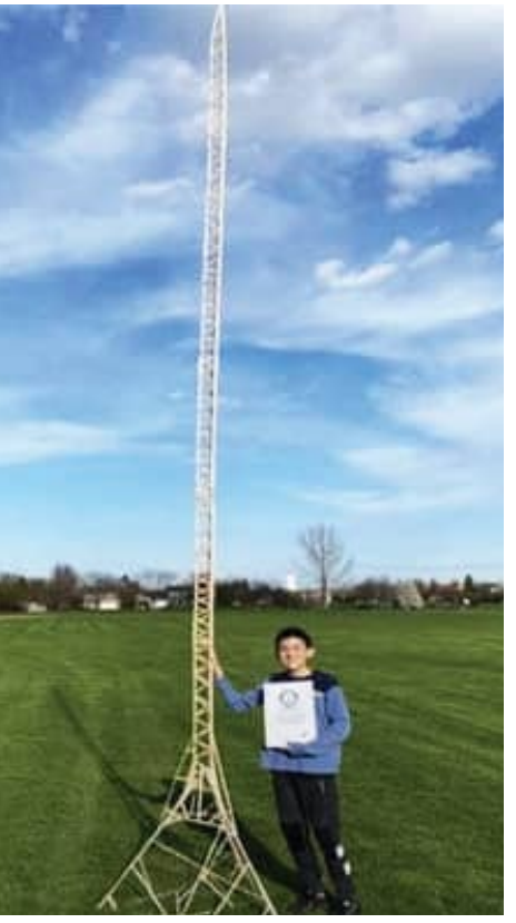
ଏପିଲ୍ ଟାଡ଼ାର ମଧ୍ୟ କହିଛନ୍ତି, 'ରୁପିକ୍ ଅତ୍ୟନ୍ତ ଛୋଟ । ଏହାକୁ ଯୋଡ଼ିବା, ସଜ୍ଜନ ରଖା କରିବା ଏବଂ ଏପିଲ୍ ଟାଡ଼ାର ଭଳି ଏକ ଫରମାକୁ ତିଆରି କରିବା ଆଦୌ ସହଜ କାମ ନୁହେଁ । ଅନ୍ୟପକ୍ଷରେ ସାମାଜିକ ରାମ୍ୟାଧ୍ୟାୟରେ ତାଙ୍କ ପରିଶ୍ରମ ଏବଂ ସୈଦ୍ଧ୍ୟ ଖୁବ୍ ପ୍ରଶଂସା କରାଯାଉଛି ।

ଆମେରିକାରେ ଜଣେ ବାଲକ ନିଜର ନିଆରା ପ୍ରତିଭା ଯୋଗୁଁ ସମସ୍ତଙ୍କ ଦୃଷ୍ଟି ଆକର୍ଷଣ କରିଛନ୍ତି । ଏପିଲ୍ ଟାଡ଼ାର ଏକ ମଡେଲ ତିଆରି କରିଛନ୍ତି । ଏହାର ପୂରା ଫରମାକୁ ସେ ରୁପିକରେ କରିଛନ୍ତି । ଏପିଲ୍ ଟାଡ଼ାର ସେ ଗିନିଜ୍ ବିଶ୍ୱ ରେକର୍ଡ ମଧ୍ୟ କରିଛନ୍ତି । ଏପିଲ୍ ଟାଡ଼ାର ଏକ ଅଠାକୁ ବ୍ୟବହାର କରି ୧୨.୩୨ ଫୁଟ ଉଚ୍ଚ ଏପିଲ୍ ଟାଡ଼ାର ତିଆରି କରିଛନ୍ତି । ଏହାକୁ ଏବେ ବିଶ୍ୱର ସବୁଠାରୁ ଉଚ୍ଚ ରୁପିକ୍ ଫରମା ବୋଲି କୁହାଯାଉଛି । ପିଲାବେଳୁ ଏପିଲ୍ ଟାଡ଼ାର ବିଭିନ୍ନ ଜିନିଷ ତିଆରି କରିବାରେ ସକଳ ରହିଛି । ଏପିଲ୍ ଟାଡ଼ାର ଏପିଲ୍ ଟାଡ଼ାର ବାପାଙ୍କଠାରୁ ପ୍ରେରଣା ମିଳିଛି । ତାଙ୍କ ବାପା ଜଣେ ସିଭିଲ୍ ଇଞ୍ଜିନିୟର । ଏପିଲ୍ ଟାଡ଼ାରଙ୍କେ ଆଇସକ୍ରିମ୍ ଷିକରେ ଜିନିଷ ତିଆରି କରିବାକୁ ପସନ୍ଦ କରୁଥିଲେ । ସେହିପରି ଏହା ତାଙ୍କର ପ୍ରଥମ ଉପକ୍ରମିକ ରୁହେଁ । ୨୦୨୧ ମସିହାରେ ତାଙ୍କୁ ୧୨ ବର୍ଷ ବୟସ ହୋଇଥିବାବେଳେ ସେ ଆଇସକ୍ରିମ୍ ଷିକରେ ୨୦ ଫୁଟ ଉଚ୍ଚ ଏପିଲ୍ ଟାଡ଼ାର ତିଆରି କରିଥିଲେ । ସେ ସମୟରେ ବି ଏପିଲ୍ ଟାଡ଼ାର ବିଶ୍ୱ ରେକର୍ଡର ଅଧିକାରୀ ହୋଇଥିଲେ । ତେବେ ଆଇସକ୍ରିମ୍ ଷିକ୍ ରୁଳାରେ ରୁପିକରେ କାମ କରିବା ଅଧିକ କଷ୍ଟକର ବୋଲି ଏପିଲ୍ କହିଛନ୍ତି ।