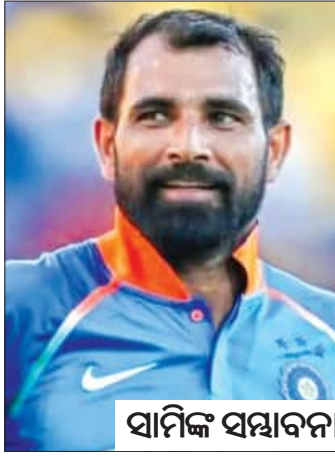
ସାମାଜିକ ସମ୍ବାଦନା, ଆଶଙ୍କାରେ ପହଞ୍ଚି