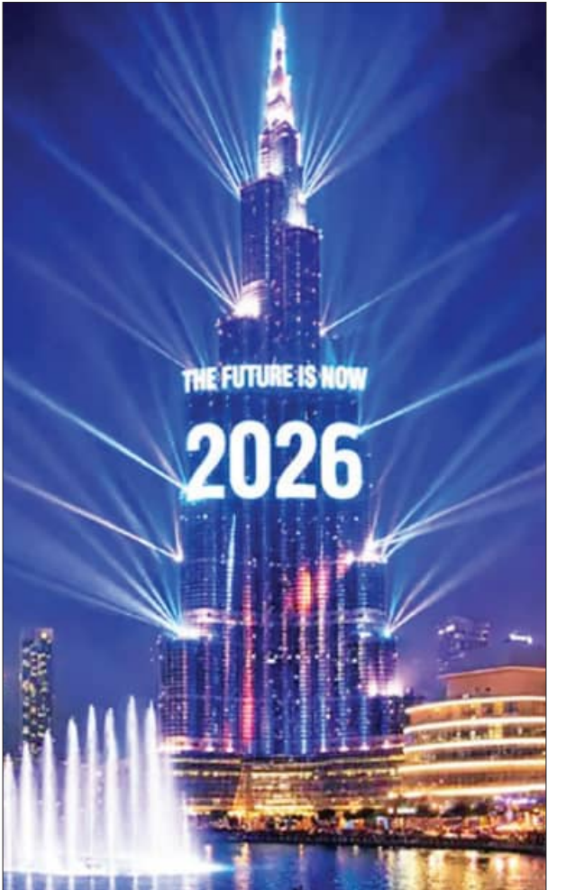
ନୂଆବର୍ଷରେ ସଜେଇ ହୋଇଛି ଦୁବାଇର ବୁର୍ଜ୍ ଖଲିଫା