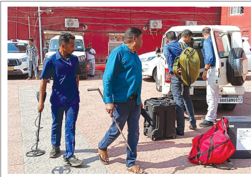
ଦିନିକିଆ ଅଧିକାରୀଙ୍କୁ ବୋମା ଧକ୍କା ମିଳିବା ପରେ ଓଡ଼ିଶା ହାଇକୋର୍ଟରେ ପୁରସ୍କା କର୍ମୀଙ୍କ ଦ୍ୱାରା ଯାଞ୍ଚ

ମାଲକାନଗିରି, ୮ (ସମ୍ପାଦକ): ମାଲକାନଗିରି ଜିଲ୍ଲା ସାମାଜିକ ଛତିଶଗଡ଼ରେ ୨୬ଲକ୍ଷ ଟଙ୍କା ପୁରସ୍କାର ଯୋଗ୍ୟ ୨୬ ମାଓବାଦୀ ଆତ୍ମସମର୍ପଣ କରିଛନ୍ତି। ସୂଚନା ଅନୁଯାୟୀ ଛତିଶଗଡ଼ ରାଜ୍ୟ ସୁକ୍ଷ୍ମା ଜିଲ୍ଲା ପୁଲିସ୍ ନିକଟରେ ୨ ମଇ, ମାଓବାଦୀ ସହ ମୋଟ ୨୬ଲକ୍ଷ ମାଓବାଦୀ ସଜ୍ଜିତ ଛାଡ଼ି ଆତ୍ମସମର୍ପଣ କରିଛନ୍ତି। ଆତ୍ମସମର୍ପଣକାରୀଙ୍କ ମଧ୍ୟରେ ପିଏଲ୍‌ସିଏ ବାଣୀକୀଅନ୍ତର କ୍ୟାଡ଼ ମାଓବାଦୀ ରହିଛନ୍ତି। ଏହି ମାଓବାଦୀମାନେ ଛତିଶଗଡ଼-ଓଡ଼ିଶା ସାମାଜିକ ଛତିଶଗଡ଼ ଅଞ୍ଚଳରେ ଅନେକ ମାଓ ହିଂସାରେ ସାମିଲ ଥିବା ପୁଲିସ୍ କହିଛି। ସରକାରୀ ନିୟମ ଅନୁଯାୟୀ, ସେମାନଙ୍କୁ ସମସ୍ତ ଭୁବିଧା ଯୋଗାଇ ଦିଆଯିବ ବୋଲି ପୁଲିସ୍ ଅଧିକାରୀ କହିଛନ୍ତି।