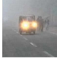
ରେକର୍ଡ ୨ ଡିଗ୍ରୀକୁ ଖସିଲା ଚାପମାତ୍ରା

■ ଭୁବନେଶ୍ୱର, ୮୧ (ସମ୍ବାଦ): ରାଜ୍ୟରେ ଜାରି ରହିଥିବା ଶୀତରୁ ନିକଟରେ ମୁକ୍ତି ମିଳିବନି। ଯଦିଓ ବର୍ତ୍ତମାନ ଭୁବନେଶ୍ୱର ଚାପମାତ୍ରା ସାମାନ୍ୟ ବଢ଼ିବ: ତେବେ ଆହୁରି ୨ ସପ୍ତାହ ପର୍ଯ୍ୟନ୍ତ ରାଜ୍ୟରେ ପ୍ରବଳ ଶୀତ ଜାରି ରହିବ। ଗୁରୁବାର ଭାରତୀୟ ପାଣିପାଗ ବିଭାଗ-ଆଇଏମ୍‌ଡି ପକ୍ଷରୁ ପ୍ରକାଶିତ ବିଶ୍ୱାସୀତ ପରିସର ଆକଳନରେ ଏକଲି ସୂଚନା ଦିଆଯାଇଛି। ଆସନ୍ତା ପକ୍ଷରୁ ପ୍ରକାଶିତ ଏହି ୧୫ ଦିନିଆ ଆକଳନରେ କୁହାଯାଇଛି, ଓଡ଼ିଶାରେ ଆସନ୍ତା ୨ ସପ୍ତାହ ପର୍ଯ୍ୟନ୍ତ ଶୀତ ଜାରି ରହିବ। ଏହି ସମୟରେ ରାଜ୍ୟର ଅଧିକାଂଶ ସ୍ଥାନରେ ଚାପମାତ୍ରା ସାଧାରଣ ଭୁବନେଶ୍ୱର କମ୍ ରହିବ। ତେଣୁ ରାଜ୍ୟରେ ପ୍ରବଳ ଶୀତ ଅନୁଭୂତ ହେବା ନେଇ ଆଶଙ୍କା କରାଯାଇଛି।