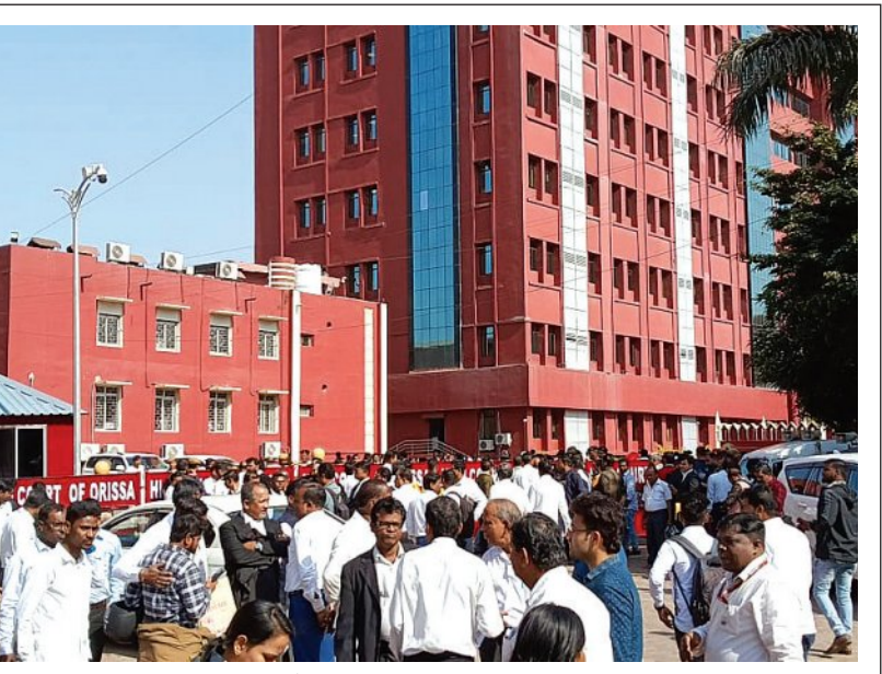
ହାଇକୋର୍ଟ ପରିସର ବାହାରେ ବିଚାରପତି, ଓକିଲ ଓ ଜନତା