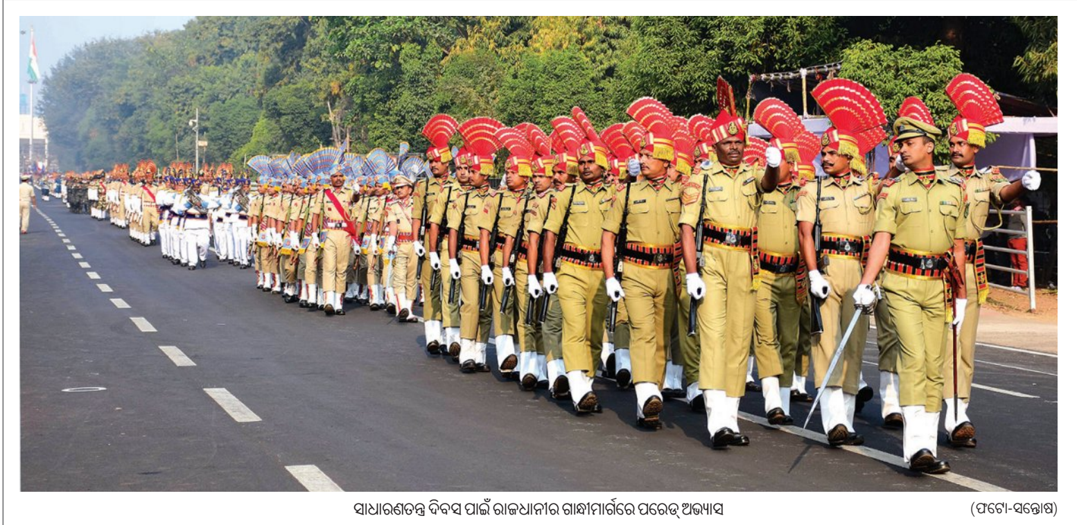
ସାଧାରଣତନ୍ତ୍ର ଦିବସ ପାଇଁ ରାଜଧାନୀର ରାମୀମାର୍ଗରେ ପରେଡ଼ ଅଭିଯାତ