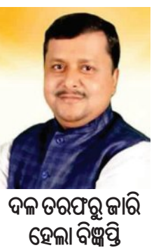
ଦଳ ଚରମରୁ ଜାରି ହେଲା ବିଜ୍ଞପ୍ତି ୨୦ ତାରିଖରେ ବିଧିବଦ୍ଧ ଘୋଷଣା

■ ନୂଆଦିଲ୍ଲୀ, ୧୬।୧ (ଏଜେନ୍ସି): କାନ୍ଦୁଆରୀ ୨୦ ତାରିଖରେ ଶାସକ ଦଳ ବିଜେପିକୁ ନୂଆ ଜାତୀୟ ସଭାପତି ମିଳିବ । ଦଳ ଶୁକ୍ରବାର ଏଥିପାଇଁ ବିଜ୍ଞପ୍ତି ଜାରି କରିଛି । ଏହା ଅନୁସାରେ, କାନ୍ଦୁଆରୀ ୧୯ରେ ନାମାଙ୍କନ ଦାଖଲ ହେବ ଓ ୨୦ରେ ଦଳର ନୂଆ ସଭାପତିଙ୍କ ନାମ ଘୋଷଣା କରାଯିବ । ଏବେ ନୀତିନ ନବୀନ ଦଳର କାର୍ଯ୍ୟକାରୀ ସଭାପତି ଅଛନ୍ତି ଓ ଦଳ ତାଙ୍କୁ ନିର୍ବୋଧରେ ଅର୍ଥାତ୍ ବିନା ପ୍ରତିଦ୍ୱନ୍ଦ୍ୱତାରେ ନିର୍ବାଚିତ କରିବା ଏକ ପ୍ରକାର ନିଶ୍ଚିତ ହୋଇଛି । ନୀତିନ ୧୯ରେ ତାଙ୍କର ନାମାଙ୍କନ ଦାଖଲ କରିବେ । ପୂର୍ବରୁ ତାଙ୍କୁ ତିସୌପୁର ୧୪ରେ ଦଳର କାର୍ଯ୍ୟକାରୀ ସଭାପତି ନିଯୁକ୍ତ କରାଯାଇଥିଲା । ବିଜେପି ୨୦୨୦ରେ ଜେପି ନିଜକୁ ଜାତୀୟ ସଭାପତି ଭାବେ ନିଯୁକ୍ତ କରିଥିଲା । ତାଙ୍କ କାର୍ଯ୍ୟକାଳ ୨୦୨୪ରେ ଶେଷ ହୋଇଥିଲା । ସେବେଠାରୁ ତାଙ୍କ କାର୍ଯ୍ୟକାଳକୁ ବୃଦ୍ଧି କରାଯାଇଛି ଓ ସେ ବିସ୍ତାରିତ କାର୍ଯ୍ୟକାଳରେ ଅଛନ୍ତି । ନିଜ୍ଞା ଏବେ କେନ୍ଦ୍ର ସରକାରରେ ସାମ୍ବାଦି ମନ୍ତ୍ରାଳୟ ଦାୟିତ୍ୱରେ ରହିଛନ୍ତି ।