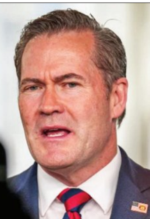
ଇରାନରେ ଇଣ୍ଟରନେଟ୍ ବ୍ଲକ୍ ଆଡ଼େ ହେବା କାରଣରୁ ଆତ୍ମୋକନକାରୀଙ୍କ ବିରୋଧରେ ସୁରକ୍ଷାବାହିନୀର କାର୍ଯ୍ୟାନୁଷ୍ଠାନର ପରିମାଣ ନିର୍ଣ୍ଣୟ କରିବା କଷ୍ଟକର ହୋଇଛି ବୋଲି ସେ କହିଛନ୍ତି। ଇରାନ ସରକାର କାମୁଆରୀ ଗୁରୁ ସାରା ଦେଶରେ ଇଣ୍ଟରନେଟ୍ ପାଖାପାଖି ପୁରା ବନ୍ଦ କରିଦେଇଛନ୍ତି। ଖାଲ୍ କହିଛନ୍ତି ଯେ, ଆତ୍ମୋକନକାରୀଙ୍କ ପକ୍ଷରେ ବିଦେଶୀ ଶକ୍ତିର ହାତ ଥିବା ଇରାନ ସରକାର ଦାବି କରିଛନ୍ତି। ସରକାର ନିଜ ସରକାରକୁ ତରୁଛନ୍ତି ଓ ଅନ୍ୟ ମୁଣ୍ଡରେ ଦୋଷ ଲଦିବାକୁ ପ୍ରୟାସ କରୁଛନ୍ତି ବୋଲି ଏଥିରେ ସ୍ପଷ୍ଟ ହେଉଛି। ଟ୍ରମ୍ ତାପ ପକାଇବା ଫଳରେ ଇରାନରେ ୮୦୦ ଲୋକଙ୍କୁ ଫାଶ ଦେବାର ପ୍ରକ୍ରିୟା ରୋକା ଯାଇଥିଲା। ମାନସାଧକୀଣ ଫରଠନଗୁଡ଼ିକ ଦେଇଥିବା ତଥ୍ୟ ଅନୁସାରେ, ଏପର୍ଯ୍ୟନ୍ତ ଲୋକଙ୍କୁ ଗିରଫ କରାଯାଇଛି ଓ ୧୮, ୦୦୦ରୁ ଉର୍ଦ୍ଧ୍ୱ ହସ୍ତକ୍ଷେପ କରୁଛି ଓ ଏହା ଠିକ୍ ନୁହେଁ ବୋଲି ରୁଷିଆ କହିଛି। ଉଲ୍ଲେଖାତ୍ମର କି, ତିସେମ୍ବର ୨୮ ରୁ ଇରାନରେ ହିଂସ୍ର ଆତ୍ମୋକନ ଆରମ୍ଭ ହୋଇ ଏବେ ଉତ୍ତରୁପ ଧାରଣ କରିଛି। ଉଦାହରଣ ବୃଦ୍ଧି, ଅର୍ଥିକ ସଙ୍କଟ, ବ୍ୟବସାୟିକ ଆତ୍ମୋକନ, ସରକାରଙ୍କ ବିରୋଧରେ ରୋଷ, ସରକାରଙ୍କ କଠୋର କାର୍ଯ୍ୟାନୁଷ୍ଠାନ ଏବଂ ଆମେରିକା, ଇସ୍ରାଏଲ ଭଳି ରାଷ୍ଟ୍ରଙ୍କ ହସ୍ତକ୍ଷେପ ଭଳି ବିଭିନ୍ନ କାରଣରୁ ଏହି ଆତ୍ମୋକନ ଦେଶରେ ନାହିଁ ନଥିବା ସ୍ଥିତି ସୃଷ୍ଟି କରିଛି।