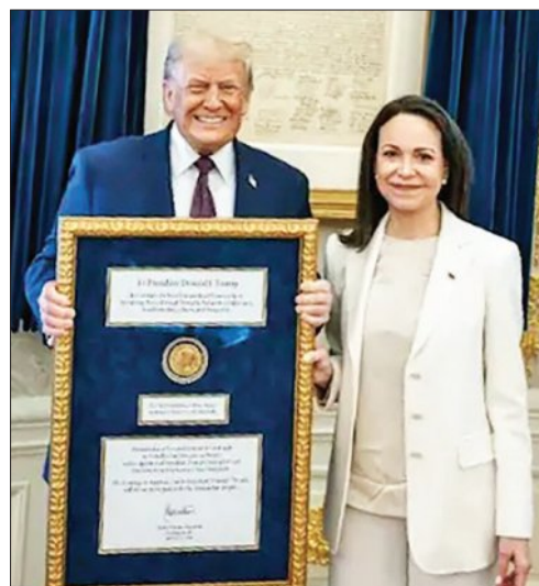
ଭେନେଜୁଏଲ ନେତାଙ୍କୁ ଭେଟିଛନ୍ତି। ଆଉ ଏହି ସାକ୍ଷାତ ଇତିହାସ ପାଇଁ ଦାୟିତ୍ୱ ଗ୍ରହଣ କରିଛନ୍ତି। ମାତାଡ଼ୋ ଟ୍ରମ୍‌ଙ୍କୁ ନିଜ ନୋବେଲ ଶାନ୍ତି ପୁରସ୍କାର ଦାନାନ୍ତରା ସ୍ୱରୂପ ପ୍ରଦାନ କରିଛନ୍ତି। ଆଜି ଭେନେଜୁଏଲ ବାସୀଙ୍କ ପାଇଁ ଏକ ଐତିହାସିକ ଦିନ ବୋଲି ମାତାଡ଼ୋ କହିଛନ୍ତି। ଦୈନିକ ପରେ ସାମ୍ବାଦିକଙ୍କ ସହ କଥା ହେବା ବେଳେ ମାତାଡ଼ୋ ଟ୍ରମ୍‌ଙ୍କୁ

ନୂଆଦିଲ୍ଲୀ, ୧୬।୧ (ଏକେନି): ବିଶ୍ୱରେ ଅସ୍ଥିରତା ସୃଷ୍ଟି କରିଥିବା ଆମେରିକା ରାଷ୍ଟ୍ରପତି ତୋନାଲ୍ଡ ଟ୍ରମ୍‌ଙ୍କୁ ଆଶା ପରିଶେଷରେ ପୂର୍ଣ୍ଣ ହେଉଛି। ଶୁକ୍ଳ ଛାଟ ହେଉ ଅଥା ଆମାନଙ୍କ ପ୍ରତ୍ୟକ୍ଷ କିମ୍ବା ଅନ୍ୟ ଦେଶରେ ଆକ୍ରମଣ ପାଇଁ ସର୍ବଦା ବିବାଦରେ ଥିବା ଅଶାନ୍ତ ଟ୍ରମ୍‌ଙ୍କୁ ଏବେ ଶାନ୍ତ ପଡ଼ିବେ ବୋଲି ଆଶା କରାଯାଉଛି। କାରଣ ଭେନେଜୁଏଲାର ରାଷ୍ଟ୍ରପତିଙ୍କୁ ରାତିଅଧରେ ଅପହରଣ କରି ଆଶବାକୁ ନିର୍ଦ୍ଦେଶ ଦେଇଥିବା ଆମେରିକା ରାଷ୍ଟ୍ରପତିଙ୍କ ଦାବି ଦିନର ଆଶା ପୂରଣ ହୋଇଛି। ଗ୍ରୀନଲାଣ୍ଡ କର୍ତ୍ତା ପାଇଁ ସ୍ୱପ୍ନ ଦେଖିଥିବା ରାଷ୍ଟ୍ରପତି ଟ୍ରମ୍‌ଙ୍କୁ ନୋବେଲ 'ଶାନ୍ତି' ପୁରସ୍କାର ମିଳିଛି। ମାତ୍ର ପ୍ରସିଦ୍ଧ ବୈଜ୍ଞାନିକ ଆଲବର୍ଟ ଆଇନ୍‌ଷ୍ଟାଇନ୍ ନାମରେ ଦିଆଯାଇଥିବା ଏହି ସମ୍ମାନ ନୋବେଲ କମିଟି ଦ୍ୱାରା ଦିଆଯାଇ ନାହିଁ। ଟ୍ରମ୍ ଏହି ପୁରସ୍କାର ଜିତିନାହାନ୍ତି, ବରଂ ତାଙ୍କୁ ଅଦିନିଆ ଦାନରେ ମିଳିଛି। ଭେନେଜୁଏଲାର ବିପକ୍ଷ ନେତା ମାରିଆ କାରିନୋ ମାତାଡ଼ୋ ହାଇଲଟ ହାଉସରେ ଟ୍ରମ୍‌ଙ୍କୁ ଭେଟି ନିଜ ନୋବେଲ ଶାନ୍ତି ପୁରସ୍କାର ପ୍ରଦାନ କରିଛନ୍ତି। ନୋବେଲ ପୁରସ୍କାରର ଇତିହାସରେ ପ୍ରଥମ ଥର ପାଇଁ ଏପରି ହୋଇଛି। ମାତ୍ର ଏଭଳି ଦେବାନେତା ବୋଧାତ୍ମକ ବୋଲି ନୋବେଲ କମିଟି ପକ୍ଷରୁ କୁହାଯାଇଛି। କିନ୍ତୁ କୌଣସି ବଦାନ୍ୟତା ନୁହେଁ, ବରଂ କ୍ଷମତା ଭେଦରେ ମାତାଡ଼ୋ ଏଭଳି ପଦକ୍ଷେପ ନେଇଥିବା କୁହାଯାଉଛି।