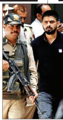
କାନାଡ଼ାରେ ତାଲିମ୍ପା ଏହି ଆଡ଼କବାଦୀ କାର୍ଯ୍ୟକଳାପ ନେଇ ବାରମ୍ବାର ଅବଗତ କରାଉଥିଲେ ମଧ୍ୟ କାର୍ଯ୍ୟଶୁଣି

ଅଣଦେଖା କରାଯାଇଛି। ଏପର୍ଯ୍ୟନ୍ତ କାହାକୁ ଦୋଷୀ ସାବ୍ୟସ୍ତ କରାଯାଇନାହିଁ। ସେ ମଧ୍ୟ ଏ ନେଇ ଏକ ବଡ଼ ଉଦ୍ଧାରଣ ଦେଇଥିଲେ। ୧୯୮୫ ଜୁନ ୨୩ରେ ଏଘାରି ଲଣ୍ଡିଆ ବିମାନ କନିଷ୍ଠ ବିସ୍ଫୋରଣରେ ୩୨୯ ଜଣ ମୃତ୍ୟୁବରଣ କରିଥିଲେ। ଶିଶୁ ଆଡ଼କବାଦୀ ଗୋଷ୍ଠୀ ବାବର ଖାଲି ସାହି ବିସ୍ଫୋରଣ କରାଇଥିଲେ ମଧ୍ୟ ଏପର୍ଯ୍ୟନ୍ତ କିଛି ଫଳପ୍ରାପ୍ତ ହୋଇ ନାହିଁ। ପୁଣି କାନାଡ଼ା ଦୋମୁହାଁ ନାତି ଅବଲମ୍ବନ କରୁଛି ବୋଲି ସେ ଅଭିଯୋଗ କରିଛନ୍ତି। ଭାରତ ଫର୍ମାପୁ ଆଡ଼କବାଦୀଙ୍କୁ ତିହୁଡ଼ କଲେ କାନାଡ଼ା ପ୍ରମାଣ ଦାବି କରେ। କିନ୍ତୁ ଭାରତ ବିରୋଧରେ ପ୍ରମାଣିତ ହୋଇ ନ ଥିବା ଅଭିଯୋଗର ଉତ୍ତର ଦାବି କରେ। ତେଣୁ ଭାରତ ବିରୋଧୀ କାର୍ଯ୍ୟକଳାପ ନେଇ କାର୍ଯ୍ୟାନୁଷ୍ଠାନ ଜରୁରୀ ବୋଲି ସେ ଏକ ସାକ୍ଷାତକାର ଦେବା ଅବସରରେ କହିଛନ୍ତି।