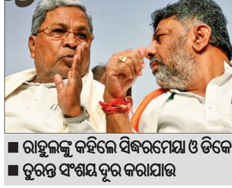
ରାହୁଲକୁ କହିଲେ ସିଦ୍ଧରମେୟ ଓ ତିଳେ ତୁରନ୍ତ ସଂଶୟ ଦୂର କରାଯାଉ

ବାକିଥିବା ସୂଚନା ମିଳିଛି। ମାତ୍ର ଏ ନେଇ କୌଣସି ତାରିଖ ଧାର୍ଯ୍ୟ କରାଯାଇ ନାହିଁ। ଅନ୍ୟପଟେ ରାହୁଲ ମଙ୍ଗଳକାର ବିମାନବନ୍ଦରରେ ଶିବକୁମାରଙ୍କ ସହ ଏକାନ୍ତରେ ଚର୍ଚ୍ଚା କରିଥିଲେ। ଏହାର ଭିତ୍ତି ଏବଂ ଫଟୋ ଭାଇଭାଲ ହେବାରେ ଲାଗିଛି। ମାତ୍ର ଉଭୟେ ବି ଚର୍ଚ୍ଚା କରିଥିଲେ ତାହାର ସୂଚନା ମିଳିନାହିଁ। ଲୋକେ ଖାଲି ଆକଳନ କରିବାକୁ ସୂଚି କରୁଥିବା ତିଳେ କହିଥିଲେ। ମାତ୍ର ସେ ଆଜି କରିଥିବା ବିଷୟ ନେଇ ରାଜନୈତିକ ଚର୍ଚ୍ଚା ଆରମ୍ଭ ହୋଇଯାଇଛି। ପ୍ରୟାସ ବିଫଳ ହୋଇଗଲେ ବି ପ୍ରାର୍ଥନା ବ୍ୟର୍ଥ ଯାଏ ନାହିଁ ବୋଲି ତିଳେ କହିଥିଲେ। ପୂର୍ବରୁ ମୁଖ୍ୟମନ୍ତ୍ରୀ ପଦକୁ ନେଇ ହାଇକମାଣ୍ଡ ନିଷ୍ପତ୍ତି ନେବେ ବୋଲି କଂଗ୍ରେସ ଅଧ୍ୟକ୍ଷ ମଲ୍ଲିକାର୍ଜୁନ ଖଟ୍ଟର କହିଥିଲେ। ସୂଚନାଯୋଗ୍ୟ ଯେ କଂଗ୍ରେସ ସରକାରକୁ ଅଟେଇ ବର୍ଷ ପୁରଣ ହେବା ପରେ ମୁଖ୍ୟମନ୍ତ୍ରୀ ବଦଳାଇବା ଦାବି ଜୋର ଧରିଛି। ସରକାର ଗଠନ ସମୟରେ ଅଟେଇ ବର୍ଷରେ ମୁଖ୍ୟମନ୍ତ୍ରୀ ବଦଳାଇବାକୁ ପ୍ରତିଶ୍ରୁତି ଦିଆଯାଇଥିଲା ବୋଲି ତିଳେ ଗୋଷ୍ଠୀର ବିଧାୟକ ଦାବି କରୁଛନ୍ତି।