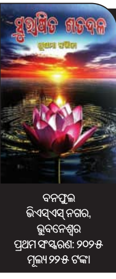
ବନପୁଲ ଭିଏସ୍‌ସ୍‌ଏନ‌ଏ, ଭୁବନେଶ୍ୱର ପ୍ରଥମ ଫେସ୍‌ରଣ: ୨୦୨୫ ମୂଲ୍ୟ ୨୨୫ ଟଙ୍କା