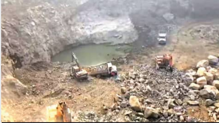
୬ ଗୁରୁତର; ପ୍ରଶାସନ, ପୁଲିସର ତଦନ୍ତ ଜାରି

ଖଣିରେ ଶନିବାର ଅପରାହ୍ଣ ପ୍ରାୟ ୪ଟାରେ ପ୍ରାୟ ୨୦ ଶ୍ରମିକ କାର୍ଯ୍ୟରତ ଥିଲେ। ଏହି ସମୟରେ ତିନାମାଲଟ୍ ବିସ୍ଫୋରଣ କରି ପଥର ଫଟାଯାଇଥିଲା। ଦୁର୍ଭାଗ୍ୟଙ୍କୁ ସେଠାରେ କାର୍ଯ୍ୟରତ ଶ୍ରମିକମାନଙ୍କ ଉପରେ ବଡ଼ବଡ଼ ପଥରଖଣ୍ଡ ପଡ଼ିଥିଲା। ପଥର ତଳେ ଚାପି ହୋଇ ବହୁ ଶ୍ରମିକ ଗୁରୁତର ଆହତ ହୋଇଥିଲେ। ସ୍ଥାନୀୟ ଗ୍ରାମବାସୀଙ୍କ ସହାୟତାରେ ସେମାନଙ୍କୁ ଉଦ୍ଧାର କରି ସ୍ଥାନୀୟ ଚିକିତ୍ସାଳୟରେ ଭର୍ତ୍ତି କରାଯାଇଥିଲା। ଗତ ଅଗଷ୍ଟ ମାସରୁ ପ୍ରତ୍ୟକ୍ଷ ବିଭାଗ ଏହି ଖଣିକୁ କ୍ଲୋଜର୍-ନୋଟିସ୍ ଜାରି କରିଥିଲା। କିନ୍ତୁ ଖଣି ମାଲିକ କିଛି ଅସାଧୁ କର୍ମଚାରୀଙ୍କୁ ହାତବାର୍ଦ୍ଧି କରି ଏହି ଖଣିକୁ ବେଆଇନ ଭାବେ ଚଳାଇଥିବା ଜଣାପଡ଼ିଛି। ସେହିପରି,