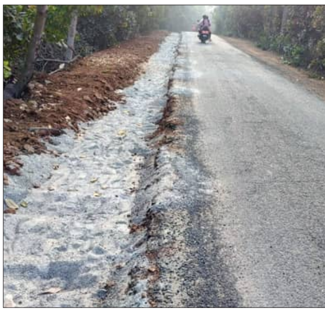
ହତ୍ତସତ୍ତ ହେଉଛନ୍ତି ପର୍ଯ୍ୟଟକ

ଗଞ୍ଜାମ, ୩।୧(ସମ୍ବିଧ): ଗଞ୍ଜାମ ବ୍ଲକ୍ ଅନ୍ତର୍ଗତ ପ୍ରସିଦ୍ଧ ଶୈବପୀଠ ବଟେଶ୍ୱରକୁ ସଂଯୋଗ ରାସ୍ତା ନିର୍ମାଣାଧୀନ କାର୍ଯ୍ୟରେ ଅହେତୁକ ବିଳମ୍ବ ନେଇ ଅସନ୍ତୋଷ ବୃଦ୍ଧି ପାଇଛି । ନିର୍ମାଣ କାର୍ଯ୍ୟ ବିଳମ୍ବ ଯୋଗୁଁ ପର୍ଯ୍ୟଟକ ମଧ୍ୟରେ ଘୋର ଅସନ୍ତୋଷ ପ୍ରକାଶ ପାଇଛି । ଗୁରୁବାର ଦିନ ନୂତନ ବର୍ଷ ଯୋଗୁଁ ବଟେଶ୍ୱର ପାଠକୁ ଉତ୍ସୁକ ଭିଡ଼ ହେଉଥିବା ବେଳେ ରାସ୍ତା ନିର୍ମାଣ ପାଇଁ ଦାୟିତ୍ୱ ହେଲା ରାସ୍ତା ପାଖରେ ଖୋଳି ଦିଆଯାଇଥିବା ଯୋଗୁଁ ଯାନବାହାନ ଯିବା ଆସିବାରେ ଆସୁଥିବା ସୃଷ୍ଟି ହେଉଛି । ମାସେ ହେଲା ଖୋଳି ପଡ଼ିଥିବା ଯୋଗୁଁ ଠିକାଦାର ଜଣକ ଉକ୍ତ କାର୍ଯ୍ୟ ପାଇଁ ତତ୍ପରତା ନଥିବା ଜଣାପଡ଼ିଛି । ରାସ୍ତା କାମରେ ବିଳମ୍ବ ଯୋଗୁଁ ଦୁର୍ଘଟଣା ମଧ୍ୟ ହେଉଛି । ଯାହାକୁ ନେଇ ସାଧାରଣ ମଧ୍ୟ ଘୋର ଅସନ୍ତୋଷ ପ୍ରକାଶ ପାଇଛି । ବର୍ତ୍ତମାନ ପିକନିକ ରଡ଼ ପାଇଁ ପର୍ଯ୍ୟଟକ ପ୍ରତ୍ୟେକ ଦିନ ବହୁ ସଂଖ୍ୟାରେ ଆସୁଥିବା ବେଳେ ରାସ୍ତା ପାଇଁ ସମସ୍ୟା ସୃଷ୍ଟି ହେଉଛି । ପ୍ରଶାସନ ପକ୍ଷରୁ ଏହି ସମସ୍ୟା ପ୍ରତି ଦୃଷ୍ଟି ଦେବାକୁ ୬ ଖଣ୍ଡ ଗ୍ରାମର ଜନସାଧାରଣ ପକ୍ଷରୁ ଦାବି ହେଉଛି ।