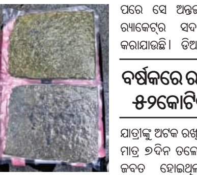
ପରେ ସେ ଅନ୍ତର୍ଜାତୀୟ ନିଶା କାରବାର ବ୍ୟାଙ୍କକକ୍‌ରେ ସଦସ୍ୟ ବୋଲି ଅନୁମାନ କରାଯାଇଛି। ତିଆରକି, ସିଆରପିଏମ୍ ଯବାନଙ୍କ ସହ ସ୍ଥାନୀୟ ପୁଲିସ୍ ବିମାନ ବନ୍ଦରରେ ରାଜ୍ୟକୁ ଆସିଲାଣି ୫୨କୋଟିର ମାରିକୁଆନା

■ ଭୁବନେଶ୍ୱର, ୩।୧ (ସମ୍ବିଧ): ପୁଣି ଭୁବନେଶ୍ୱର ବିମାନବନ୍ଦରରୁ ଜବତ ହେଲା ୮ କୋଟି ଟଙ୍କାର ମାରିକୁଆନା। ବିଶ୍ଵସ୍ତରରୁ ଖବର ପାଇ ତାଲଚେରୁମେରେ ଅଧିକାରୀଙ୍କୁ ଜଣାଇ ଦିଆଯାଇଥିଲା। ବିମାନବନ୍ଦରରୁ ଜବତ ହୋଇଛି ୧୨ କୋଟିର ବ୍ୟାଙ୍କକକ୍ ନିଶା। ଡିଆରକି, ସିଆରପିଏମ୍ ଯବାନଙ୍କ ସହ ସ୍ଥାନୀୟ ପୁଲିସ୍ ପକ୍ଷରୁ କୋଣ୍ଡା ଜଙ୍ଗଲରେ ଗତରାତିରୁ ତଳାସି ଅଭିଯାନ ଜାରି ରହିଥିଲା। ଆଜି ସକାଳେ