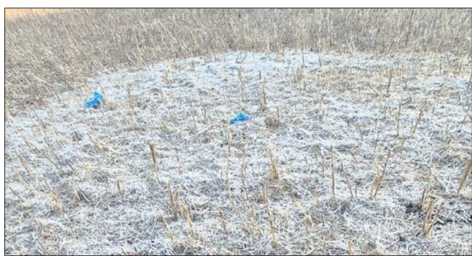
ଧଣ୍ଡାରେ ଧରୁଛି କୋରାପୁଟ। ଆଜି ମଧ୍ୟ ସମ୍ପାଦନା ପ୍ରକଳ୍ପ ଧଣ୍ଡାରେ ଧରୁଛି କୋରାପୁଟ। ଆଜି ମଧ୍ୟ ସମ୍ପାଦନା ପ୍ରକଳ୍ପ ଧଣ୍ଡାରେ ଧରୁଛି କୋରାପୁଟ।

ଧଣ୍ଡା ଧଣ୍ଡାରେ ଧରୁଛି କୋରାପୁଟ। ପ୍ରକଳ୍ପ ଶୀଘ୍ର ହେବା ପାଇଁ କୋରାପୁଟ ଧଣ୍ଡାରେ ଧରୁଛି କୋରାପୁଟ। ପ୍ରକଳ୍ପ ଶୀଘ୍ର ହେବା ପାଇଁ କୋରାପୁଟ ଧଣ୍ଡାରେ ଧରୁଛି କୋରାପୁଟ।