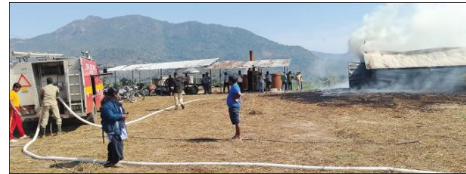
ହୋଇଥିବା ଷଡ଼ିଗୁଣ୍ଠ ବାଷ୍ପ ଜଣାଇଛନ୍ତି। ତେଲ ଟ୍ୟାଙ୍କି ମାଲିକ ଜି ପଟ୍ଟିକର ଏବଂ ପ୍ରଭାବରେ ପାଖ ଜଳିରେ ଥିବା ଲେମନ୍ ଗ୍ରାସ ଜଳି ଯୋଗୁଁ ନଷ୍ଟ ହୋଇଛି।

କନ୍ଧପୁର, ୮୧(ସମିଧ) : କନ୍ଧପୁର ଜିଲ୍ଲାର ସେମିଲିଗୁଡ଼ା ଗ୍ରାମରେ ଥିବା ଲେମନ୍ ଗ୍ରାସ ତେଲ ଟ୍ୟାଙ୍କିରେ ନିଆଁ ଲାଗି ଲକ୍ଷ୍ମୀଧନ ଟଙ୍କାର ଘାସ ଜଳି ନଷ୍ଟ ହୋଇ ଯାଇଛି।