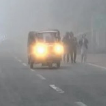
ରେକର୍ଡ ୨ ଡିଗ୍ରୀକୁ ଖସିଲା ତାପମାତ୍ରା

■ ଭୁବନେଶ୍ୱର, ୮୧ (ସମିପ): ରାଜ୍ୟରେ ଜାରି ରହିଥିବା ଶୀତ ଋତୁ ନିକଟରେ ମୂକ୍ତି ମିଳିବନି। ଯଦିଓ ବର୍ତ୍ତମାନ ଭୁବନେଶ୍ୱର ଓଡ଼ିଶା ସାମାନ୍ୟ ବର୍ଷା: ତେବେ ଆହୁରି ୨ ସପ୍ତାହ ପର୍ଯ୍ୟନ୍ତ ରାଜ୍ୟରେ ପ୍ରବଳ ଶୀତ ଜାରି ରହିବ। ଗୁରୁବାର ଭାରତୀୟ ପାଣିପାଗ ବିଭାଗ-ଆଇଏମ୍‌ଡି ପକ୍ଷରୁ ପ୍ରକାଶିତ ବିଶ୍ଳେଷଣ ପରିସର ଆକଳନରେ ଏଭଳି ସୂଚନା ଦିଆଯାଇଛି। ଆସନ୍ତା ପକ୍ଷରୁ ପ୍ରକାଶିତ ଏହି ୧୫ ଦିନିଆ ଆକଳନରେ କୁହାଯାଇଛି, ଓଡ଼ିଶାରେ ଆସନ୍ତା ୨ ସପ୍ତାହ ପର୍ଯ୍ୟନ୍ତ ଥଣ୍ଡା ଜାରି ରହିବ। ଏହି ସମୟରେ ରାଜ୍ୟର ଅଧିକାଂଶ ସ୍ଥାନରେ ତାପମାତ୍ରା ସାଧାରଣ ଭୁବନେଶ୍ୱରରେ କମ୍ ରହିବ। ତେଣୁ ରାଜ୍ୟରେ ପ୍ରବଳ ଥଣ୍ଡା ଅନୁଭୂତ ହେବା ନେଇ ଆଶଙ୍କା କରାଯାଇଛି।