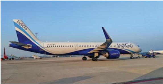
ଇଡ଼ିବାକୁ ଆସୁଥିବା ଦୁଇ ଘଣ୍ଟା ସମୟ ଲାଗିବ ବୋଲି କୁହାଯାଇଛି। ଅହମଦାବାଦ ବିମାନବନ୍ଦର ଥାନା ଇନିସପେକ୍ଟର ଏନଡି ପୃଷ୍ଠା-୭

■ ନୂଆଦିଲ୍ଲୀ, ୩୦୧୧ (ଏକେଡି): କୁଏତରୁ ଦିଲ୍ଲୀ ଆସୁଥିବା ଇଣ୍ଡିଗୋ ବିମାନକୁ ଶୁକ୍ରବାର ସକାଳେ ଅପହରଣ ଓ ବୋମା ବିସ୍ଫୋରଣ କରି ଉଡ଼ାଇ ଦେବାକୁ ଧମକ ମିଳିଥିଲା। ଏହାପରେ ବିମାନର ଗତିପଥ ପରିବର୍ତ୍ତନ କରାଯାଇ ସକାଳ ୬.୪୦ରେ ଅହମଦାବାଦ ବିମାନବନ୍ଦରରେ ଜରୁରୀ ଅବତରଣ କରାଯାଇଥିଲା। ଏହି ବିମାନରେ ୧୮୦ ଯାତ୍ରୀ ଥିଲେ। ବିମାନବନ୍ଦର ସୁରୁ ଅନୁଯାୟୀ, ସମସ୍ତ ଯାତ୍ରୀ ଓ ସେମାନଙ୍କ ଜନିଷପତ୍ର ତଥା ଲଗେଜ୍ ଯାଞ୍ଚ କରାଯାଇଥିଲା। ତେବେ କୌଣସି ଯାତ୍ରୀଙ୍କ ନିକଟରୁ କୌଣସି ସନ୍ଦେହଜନକ ସାମଗ୍ରୀ ମିଳି ନଥିଲା। ଏହା ସତ୍ତ୍ୱେ ବିମାନ