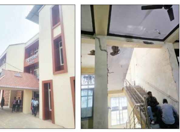
ପରିଷଦ କାର୍ଯ୍ୟାଳୟ ଅନେକ ସ୍ତରରୁ ବନ୍ଦନ କରେ। ଏହି କାର୍ଯ୍ୟାଳୟରେ ଜିଲ୍ଲା ପରିଷଦ ମୁଖ୍ୟ କାର୍ଯ୍ୟ ନିର୍ବାହୀ ଅଧିକାରୀ, ଜିଲ୍ଲା ପରିଷଦ ଅଧ୍ୟକ୍ଷ କାର୍ଯ୍ୟାଳୟ ରହିଛି।

ବଲାଙ୍ଗିର, ୩୦।୧।(ସମ୍ପାଦକ): ବଲାଙ୍ଗିର ଜିଲ୍ଲାପରିଷଦ କାର୍ଯ୍ୟାଳୟ ବାହାର ଚକ୍ଚକ୍ ଭିତର ଅବସ୍ଥା କିନ୍ତୁ ସାଂଘାତିକ। ଯେଉଁ କାର୍ଯ୍ୟାଳୟରୁ ଜିଲ୍ଲାର ଉନ୍ନତିମୁକ୍ତ କାର୍ଯ୍ୟକ୍ରମ ଯୋଜନା ଓ ସମାପ୍ତ କରାଯାଇଛି ସେହି କାର୍ଯ୍ୟାଳୟର କର୍ମଚାରୀଙ୍କ ମୁଣ୍ଡ ଉପରେ ବିପଦ ଝୁଲୁଛି। କେତେବେଳେ ଛାତ ଅତଡ଼ା କାହା ମୁଣ୍ଡରେ ପଡ଼ିବ ତାହା ବି କହି ହେବନି। ଏମିତିରେ ଲକ୍ଷ ଲକ୍ଷ ଟଙ୍କା ଖର୍ଚ୍ଚ କରାଯାଇ କାର୍ଯ୍ୟାଳୟର ବାହ୍ୟ ସୌବର୍ଯ୍ୟକରଣ କରାଯାଇଛି; କିନ୍ତୁ ଭିତର ଅବସ୍ଥାରେ ସ୍ଥାୟୀ ସମାଧାନ କରିବା ଦିଗରେ କୌଣସି ପଦକ୍ଷେପ ଗ୍ରହଣ କରାଯାଇନାହିଁ।