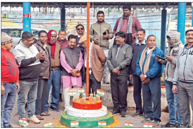
ରାଉରକେଲା ହର୍ଦ୍ଦୟ ଆସୋସିଏସନ ପକ୍ଷରୁ ନୂଆ ବସଷ୍ଟାଣ୍ଡ ଶୁଭ ୧ ନମ୍ବର ପଥରଖେର ସାଧାରଣତନ୍ତ୍ର ଦିବସ ପାଳିତ

ବେହେରାଙ୍କ ସମେତ କାରଖାନାର ବହୁ ବରିଷ୍ଠ ଅଧିକାରୀ ଉପସ୍ଥିତ ଥିଲେ। ଉକ୍ତ କାର୍ଯ୍ୟକ୍ରମରେ କାରଖାନାର ବିଭିନ୍ନ ଯୁନିଟ୍ ପ୍ରାୟ ୫୦ ଜଣ ଅଧିକାରୀଙ୍କୁ ପ୍ରଶ୍ନୋତ୍ତର ପ୍ରଣାଳୀରେ ପରୀକ୍ଷା କରାଯାଇଥିଲା।