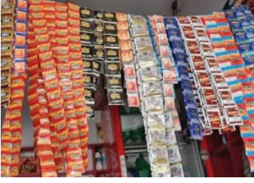
ରାଜ୍ୟ ସରକାର ଓଡ଼ିଶାରେ ଗୁରୁଖା, ପାନ ମସଲା, ଜର୍ଦି, ଖଇନ ଓ ତମାଖୁ କିମ୍ବା ନିକୋଟିନ୍‌ଯୁକ୍ତ ସମସ୍ତ ପ୍ରକାରର ଖାଦ୍ୟ ପଦାର୍ଥର ଉତ୍ପାଦନ, ପ୍ରସ୍ତୁତି, ପ୍ୟାକେଜିଂ ଉପରେ ପ୍ରତିବନ୍ଧକ ଜାରିକରିଛନ୍ତି। ଏହାସହ ଏହାର ସଞ୍ଚନ, ପରିବହନ,