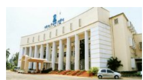
ଦୁଇଟି ପର୍ଯ୍ୟାୟରେ ମୋଟ ୨୮ କାର୍ଯ୍ୟ ଦିବସ ପ୍ରଥମ ଦିନରେ ସମ୍ପୂର୍ଣ୍ଣ କରିବେ ରାଜ୍ୟପାଳ

ପ୍ରସ୍ତାବ ଉପରେ ଧନ୍ୟବାଦ ପ୍ରସ୍ତାବ ଆଗତ ହୋଇ ଆଲୋଚନା ହେବ। ଫେବୃଆରୀ ୨୦ ତାରିଖରେ ବଜେଟ ଆଗତ ହେବ ଏବଂ ଏହା ଉପରେ ୨୩ ଓ ୨୪ ତାରିଖ ଦୁଇ ଦିନ ସାଧାରଣ ଆଲୋଚନା ହେବ। ମାର୍ଚ୍ଚ ୧୦ରୁ ୩୦ ତାରିଖ ଯାଏଁ ବିଭିନ୍ନ ବିଭାଗର ଅନୁଦାନ ଉପରେ ଖର୍ଚ୍ଚ ଦାକି ଆଲୋଚନା ହେବ ବୋଲି ସ୍ଥିର ହୋଇଛି। ସେହିପରି ମାର୍ଚ୍ଚ ୩୧ ତାରିଖରେ ଗୃହରେ ବ୍ୟୟମଣ୍ଡଳ ବିଧିଧର୍ମ ଆଗତ ହେବ ବୋଲି ଜଣା ପଡ଼ିଛି। ଫେବୃଆରୀ ୨୫ରୁ ୨୮ ସଚିବାଳୟ ପ୍ରକାଶ କରିଛି ବିଧିବଦ୍ଧ ବିଜ୍ଞପ୍ତି। ପ୍ରଥମ ପର୍ଯ୍ୟାୟ ଅଧିବେଶନ ଫେବୃଆରୀ ୧୭ ତାରିଖରୁ ୨୪ ତାରିଖ ଯାଏଁ ଚାଲିବ। ସେହିପରି ଦ୍ୱିତୀୟ ପର୍ଯ୍ୟାୟ ମାର୍ଚ୍ଚ ୯ ତାରିଖରୁ ୨୪ ତାରିଖ ଯାଏଁ ଅନୁଷ୍ଠିତ ହେବ। ଆଲୋଚନା ହୋଇ ପାରିବ ହେବ।