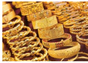
ଦିନକରେ ସୁନା ଭରି ୨୬, ରୁପା କେଜି ୮୦ ହଜାର ଟଙ୍କା ହ୍ରାସ

■ ନୂଆଦିଲ୍ଲୀ, ୩୦୧୧ (ଏକେଡି): ପ୍ରତିଦିନ ଦରକୁଚ୍ଛିନ୍ନ ଶିଳ୍ପି ତଳି ଚାଲିଥିବା ସୁନା, ରୁପା ଶୁକ୍ରବାର ଗ୍ରାହକଙ୍କୁ ଦେଇଛି ବଡ଼ ଆଶ୍ଚର୍ଯ୍ୟ। ଦଶନ୍ଧିରୁ ଅଧିକ ସମୟରେ ରେକର୍ଡ଼ ଭାଙ୍ଗି ଘରୋଇ ବଜାରରେ ସୁନା ଏବଂ ରୁପା ମୂଲ୍ୟରେ ହୋଇଛି ବଡ଼ ହ୍ରାସ। ମାତ୍ର ଗୋଟିଏ ଦିନରେ ସୁନା ମୂଲ୍ୟରେ ୧୦ ଗ୍ରାମ ପିଛା ୨୬ ହଜାର ଏବଂ ରୁପା ଦର କିଲୋ ପିଛା ୮୦ ହଜାର ଟଙ୍କା ହ୍ରାସ ଘଟିଛି। କୁମାରତ ଭାବେ ଉପରମୁହାଁ ହୋଇଚାଲିଥିବା ସୁନା ଓ ରୁପା ମୂଲ୍ୟରେ ଏପରି ବୃହତ୍ ହ୍ରାସ ସମସ୍ତଙ୍କୁ ଚକିତ କରିଦେଇଛି। ବିଶ୍ୱର ଅନ୍ୟ ମୁଖ୍ୟ ଦୁକାନୀରେ ତଳାର ସୁବୁଡ଼ ହେବା ଏବଂ ସୁନା ଓ ରୁପାର ଅତ୍ୟଧିକ ଉଚ୍ଚ ମୂଲ୍ୟକୁ ଆଖି ଆଗରେ ରଖି ନିବେଶକମାନେ