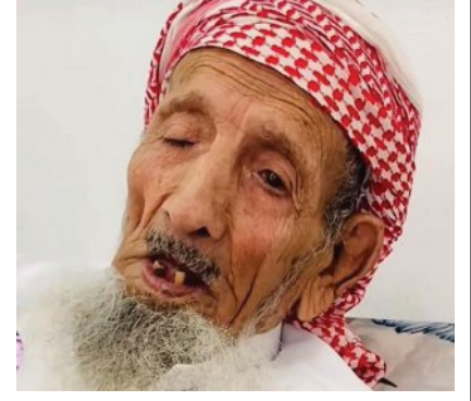
୧୧୦ ବର୍ଷରେ ଶେଷ ବିବାହ କରି ବି ହୋଇଥିଲେ ବାପା ମୃତ୍ୟୁ ପର୍ଯ୍ୟନ୍ତ କୁଳ ପାରିଲାଣି ବ୍ୟାଧି