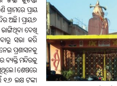
ବିଭାଗ ସହକାରୀ କାର୍ଯ୍ୟନିର୍ବାହୀ ଯନ୍ତ୍ରୀ ଭକ୍ତ ମନ୍ଦିର ଜରାଜାର୍ଯ୍ୟ ଅବସ୍ଥାରେ ଥାଇ ଅନୁପଯୋଗୀ ଅଟେ ବୋଲି କୁଟିଣ୍ଡା ବିଡ଼ିଓଙ୍କୁ ମିଥ୍ୟା ରିପୋର୍ଟ ପ୍ରଦାନ କରିଥିଲେ । ବିଡ଼ିଓ ମଧ୍ୟ ସଠିକ୍ ତଥ୍ୟ ସଂଗ୍ରହ ନ କରି ସମ୍ବଲପୁର ଜିଲ୍ଲା ପରିଷଦ ମୁଖ୍ୟ କାର୍ଯ୍ୟନିର୍ବାହୀ ଅଧିକାରୀଙ୍କୁ

କୁଟିଣ୍ଡା, ୧୪୧ (ସମ୍ବିଧ) : ସମ୍ବଲପୁର ଜିଲ୍ଲା କୁଟିଣ୍ଡା ବ୍ଲକ୍ କୁଳେଇଗଡ଼ ପଞ୍ଚାୟତ ପୁରୁଣାପାଣି ଗ୍ରାମରେ ପ୍ରାୟ ଦେଢ଼ ଶହ ବର୍ଷ ପୁରାତନ ଶ୍ରୀରାମ ମନ୍ଦିର ଅଛି । ପ୍ରାୟ ୬ ମାସ ହେବ ମନ୍ଦିର କାନ୍ଥକୁ କିଛି ଅଞ୍ଚଳ ଭାଙ୍ଗିଥିବା ଦେଖି ମନ୍ଦିର ପୂଜକ ଗ୍ରାମବାସୀଙ୍କୁ ଜଣାଇବାକୁ ସଭା କରି ମନ୍ଦିରର ରକ୍ଷଣାବେକ୍ଷଣ ଓ ମରାମତି ନେଇ ପ୍ରଶାସନକୁ ଜଣାଇଥିଲେ । ମାତ୍ର କେତେକ ସାଧିକର ବ୍ୟକ୍ତି ମନ୍ଦିରକୁ ଭାଙ୍ଗି ନୂତନ ମନ୍ଦିର ନିର୍ମାଣ ପାଇଁ ଲେଖୁଥିଲେ । ଶେଷରେ ଜିଲ୍ଲା ପ୍ରଶାସନ ମନ୍ଦିର ମରାମତି ପାଇଁ ୧୬ ଲକ୍ଷ ଟଙ୍କା ମଞ୍ଜୁର କରିଥିଲେ । ମାତ୍ର ଜାଣିଶୁଣି ବାଧା ଦେବା ସହ କୁପ୍ରଥମ କରି ରହିଥିଲା । ଗାଁ ଲୋକ ଜାଣିବା ପରେ ଗତ ଅକ୍ଟୋବର ମାସରେ କୁଟିଣ୍ଡା ବିଡ଼ିଓ, ଜିଲ୍ଲାପାଳ ଓ ମୁଖ୍ୟମନ୍ତ୍ରୀଙ୍କୁ ଲିଖିତ ଅଭିଯୋଗ କରିଥିଲେ । ଜିଲ୍ଲାପାଳଙ୍କ ନିବେଦନ ପରେ ଏହାର ସଠିକ୍ ଅନୁସନ୍ଧାନ ନ କରି ପୂର୍ବ