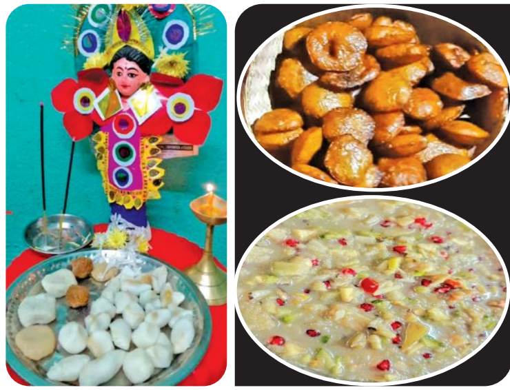
ବାରପଦା, ୧୪୧୨ (ସମ୍ବିଧ):

ମୟୂରଭଞ୍ଜ ଜିଲ୍ଲାର ଗଣପର୍ବ ମକର ପାଇଁ ବାରପଦା ସମେତ ପ୍ରମୁଖ ସହର ବନ୍ଦୀ ଶୂନ୍ୟନ ହୋଇଛି । ଅପରପକ୍ଷରେ ଗ୍ରାମାଞ୍ଚଳରେ ଉତ୍ସବର ମାହୋଳ ଦେଖିବାକୁ ମିଳିଛି । ପରମ୍ପରା ଅନୁଯାୟୀ ଏହି ପର୍ବ ପାଳନ ପାଇଁ ସମସ୍ତେ ନିଜ ନିଜର ଗାଁକୁ ଫେରିଆସିବାକୁ ନିର୍ଦ୍ଦେଶ ଦିଆଯାଇଛି । ବ୍ୟବସାୟ ପ୍ରତିଷ୍ଠାନ, ସରକାରୀ ବେସରକାରୀ ଅନୁଷ୍ଠାନ ସହ ବନ୍ଦ ରହିଛି । କିଛି ପ୍ରତିଷ୍ଠାନ ଖୋଲାଥିଲେ ହେଁ, କର୍ମଚାରୀ ମହୁଡ଼ି ଦେଖିବାକୁ ମିଳିଛି । ମଙ୍ଗଳବାର ବାଉଁଶ ପରେ ରୁଧିର ପୂର୍ଣ୍ଣିମାରେ ଜଳାଶୟନରେ ବୁଡ଼ି ପାଇ ନୂତନବସ୍ତ୍ର ପରିଧାନ କରି ମକର ପଇା(କୁମା) ଜାଳି ସମସ୍ତେ ଆନନ୍ଦ ନେଇଛନ୍ତି । ଗାଁ ଗାଁରେ ମାଦକର ଶବ୍ଦ ଓ ଗୁସୁଗାତ ସାଙ୍ଗକୁ ତାସଖେଳ, କୁକୁଡ଼ା ଲଢ଼େଇ, କାଢ଼ା ପ୍ରତିଯୋଗିତାରେ ସମସ୍ତେ ମତାମତ ଦେଇଛନ୍ତି । ମକର ପର୍ବରେ ଏହି ପର୍ବ ପାଳିତ ହେଉଛି । କୃଷି ଭିତ୍ତିକ ଏହି ପର୍ବରେ ଖରିପ ଧାନ ଫସଲ ଆମଳ ପରେ ରାସକାର୍ଯ୍ୟରେ ବ୍ୟବହୃତ ହେଉଥିବା ତାସ ଉପକରଣକୁ ବିଶ୍ରାମ ଦେବା ଉଦ୍ଦେଶ୍ୟରେ ପ୍ରତ୍ୟେକ ଚାଷୀ ପରିବାରରେ ଖଳାରେ ପୂଜା ହେଉଛି । ପ୍ରତ୍ୟେକ ଗ୍ରାମ ଦେବତାଙ୍କ ପାଠ ସହ ମଠ ମନ୍ଦିରରେ ମକର ସଂକ୍ରାନ୍ତିରେ ପୂଜା ଅନୁଷ୍ଠିତ ହେଉଥିବା ଦେଖିବାକୁ ମିଳିଛି । ମକର ଚାଉଳ, ପିଠା ଓ ଲଢୁ ଭୋଗ ଲାଗିଛି । ଅନେକ ସ୍ଥାନରେ ସାଂସ୍କୃତିକ କାର୍ଯ୍ୟକ୍ରମ ସହିତ ମେଳା ବସିଛି । ବିଭିନ୍ନ ଗ୍ରାମରେ କୁଡ଼ମା ସମ୍ପ୍ରଦାୟର ପ୍ରମୁଖ ଚୁସୁପର୍ବ ଧୂମଧାମରେ ଆୟତ୍ତ ହୋଇଛି । ଚୁସୁମେଳା ଓ ପ୍ରତିମା ବିସର୍ଜନ ପାଇଁ କମିଟିଗୁଡ଼ିକ ପକ୍ଷରୁ ବ୍ୟବସ୍ଥା ହୋଇଛି । ପର୍ବ ପରେ ଆଦିବାସୀ ସଂପ୍ରଦାୟର ଦାମଦୋର ମେଳା ନଦୀମାଳ ସଙ୍ଗମ ସ୍ଥଳରେ