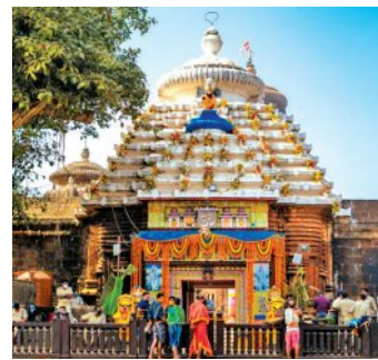
କ୍ରମାଗତ ଦ୍ୱିତୀୟ ବର୍ଷ ପାଇଁ ମକରରେ ଓପାସ ରହିଲେ ଦିଅଁ

■ ଭୁବନେଶ୍ୱର, ୧୪।୧ (ସମିସ): ବାରିବାଟି ସମ୍ପର୍କି, ହଜାର ହଜାର ସେବାୟତ। ମାତ୍ର ମକର ସଂକ୍ରାନ୍ତି ପରି ପବିତ୍ର ଦିନରେ ମହାପ୍ରଭୁ ଲିଙ୍ଗରାଜ ଖାଡ଼ା ଓପାସ।