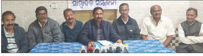
ମୁଖ୍ୟମନ୍ତ୍ରୀ ଓ କୃଷିମନ୍ତ୍ରୀଙ୍କ ମନ୍ତବ୍ୟରେ ଚାଷୀ ମର୍ମାହତ

ଧାନର କିଣାବିକା ନେଇ ଚାଲିଥିବା ଅବ୍ୟବସ୍ଥା ଓ ଅହେତୁକ ବିଲମ୍ବ ଯୋଗୁଁ ଚାଷୀ ହଜିରାଣ ହୋଇଗଲାଣି। ଶୁକ୍ରବାର ସୁଦ୍ଧା ଅଚାବିରା ନିୟନ୍ତ୍ରିତ ବଜାର କମିଟି ଅଧିକାରୀ ବିଭିନ୍ନ ମଣ୍ଡିରେ ୧୨ ଲକ୍ଷ ୨୦ ହଜାର ୫୪୩୩ କିଣା ଧାନ କିଣା ହୋଇଛି। ଗତ ବର୍ଷ ଖରିଫରେ ୨୨ ଲକ୍ଷ ୫୩ ହଜାର ୨୫୪ କିଣା ଧାନ କିଣାଯାଇଥିଲା। ଗତ ବର୍ଷର ଖରିଫ ପର୍ଯ୍ୟନ୍ତ ଧାନର ମୋଟ ଉତ୍ପାଦନ ୨୫୫ ଲକ୍ଷ ୫୩ ହଜାର ୨୫୪ ଟନ୍ନ ହୋଇଥିଲା। ଏହାପରେ ମଧ୍ୟ ଧାନ କିଣା ହୋଇନାହିଁ। ଆଜି ସପ୍ତାହ ପରେ ଚାଷୀ ଧାନ କିଣା ପାଇଁ ଶେଷରେ ଲାଗିବ। କିନ୍ତୁ ଏଯାବତ୍ ଧାନ ବିଲ୍ଲଭ ହୋଇ ନ ଯାଇଥିବାରୁ ଚାଷୀମାନେ ଅଧିକ ଦାବୀ ଦେବାକୁ ଚାହୁଁଛନ୍ତି। ଧାନ କିଣା ପାଇଁ ଧାନ କିଣା ଯୋଗ୍ୟ ଧାନ ଧାରଣାକୁ ଗତ ୩୦ ତାରିଖ ଦିନ ବରଗଡ଼ରେ ସାକ୍ଷାତ କରିଥିଲେ। କିନ୍ତୁ ମୁଖ୍ୟମନ୍ତ୍ରୀ ଧାନ ଚାଷ ନ