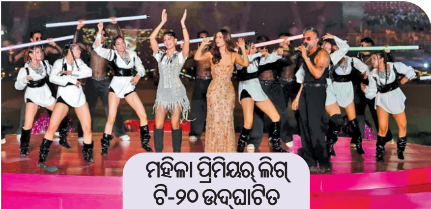
ମହିଳା ପ୍ରମିୟର ଲିଗ୍ ଟି-୨୦ ଉଦ୍‌ଘାଟିତ

RNI REGD NO: 42041/83 www.sakalpaper.com /sakalanews /sakalanews www.thesakala.in