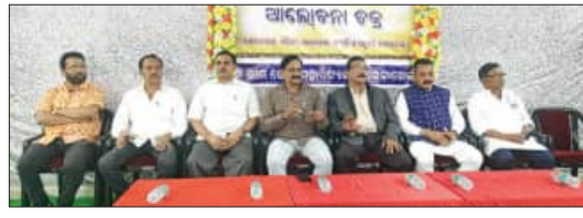
ସମ୍ବଲପୁର, ୨୦।୧(ସମ୍ବିଧ): ସମ୍ବଲପୁର ଜିଲ୍ଲା ରେଡ଼ାଖୋଲ ସହରର ଭୀମଭୋଇ ମହାବିଦ୍ୟାଳୟରେ ପଞ୍ଜାବୀ ଦିନ ଭୀମଭୋଇ ଲୋକ ମହୋତ୍ସବ ଉପଲକ୍ଷେ ଆଲୋଚନାଚକ୍ର ଅନୁଷ୍ଠିତ ହୋଇଯାଇଛି।

ରେଡ଼ାଖୋଲ, ୨୦।୧(ସମ୍ବିଧ): ସମ୍ବଲପୁର ଜିଲ୍ଲା ରେଡ଼ାଖୋଲ ସହରର ଭୀମଭୋଇ ମହାବିଦ୍ୟାଳୟରେ ପଞ୍ଜାବୀ ଦିନ ଭୀମଭୋଇ ଲୋକ ମହୋତ୍ସବ ଉପଲକ୍ଷେ ଆଲୋଚନାଚକ୍ର ଅନୁଷ୍ଠିତ ହୋଇଯାଇଛି।