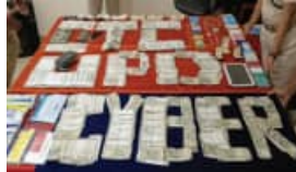
୧୪ଲକ୍ଷ ଟଙ୍କା, ୧୬ଟି ରୁପା ମୁଦ୍ରା, ୨ଟି ସୁନା କାନପୁଲ, ମଙ୍ଗଳସୂତ୍ର, ସୁନା ଚେନ୍ଦୁ ଓ ବ୍ରେସଲେଟ୍ ଜବତ