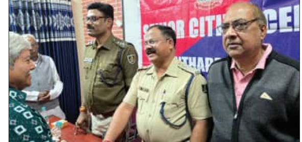
ସମ୍ବଲପୁର, ୨୦।୧ (ସମ୍ବିଧ): ବରିଷ୍ଠ ନାଗରିକ ସଂଘ ଅର୍ଥାଂଶାଳୀ ଶାଖା ପକ୍ଷରୁ ଅର୍ଥାଂଶାଳୀ ଥାନା ପୁଲିସ୍ ଆନୁକୂଲ୍ୟରେ ସମ୍ବଲପୁର ପ୍ରେସ୍ କ୍ଲବ୍ ସମ୍ମିଳନୀ କକ୍ଷରେ ବରିଷ୍ଠ ନାଗରିକ ମଣ୍ଡଳରେ ବେହେରାଙ୍କ ଅଧ୍ୟକ୍ଷତାରେ ଏକ ସଭା ଅନୁଷ୍ଠିତ ହୋଇଯାଇଛି।