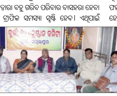
ସମ୍ବଲପୁର, ୨୦।୧ (ସମ୍ବିଧ) : ବୁର୍ଲାବାସୀଙ୍କୁ ପ୍ରଶାସନ ପକ୍ଷରୁ ବୈମାତୃକ ବ୍ୟବହାର କରାଯାଇଥିବା ବୁର୍ଲା କ୍ରିୟାନ୍ୱୟାନ କମିଟି ପକ୍ଷରୁ ଅଭିଯୋଗ କରାଯାଇଛି।

ଧୂଳି ୨୨ଟି ବ୍ୟାଚ୍ରେଟି ଚାଳିତ ଗାଡ଼ି ବନ୍ଦ କରିବା ପାଇଁ କାର୍ଯ୍ୟକ୍ରମ ମହିଳାମାନେ ବେରୋଜଗାର ହେବାପରେ ପରିବାର ପ୍ରତିପୋଷଣରେ ଅଧିକାର ସମ୍ପୂର୍ଣ୍ଣ ହେଉଛି।