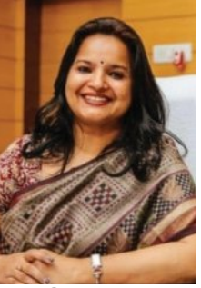
ଓଡ଼ିଶାର ପ୍ରଥମ ମହିଳା ମୁଖ୍ୟ ସଚିବ ଜାନୁଆରୀ ପହିଲାରେ ନେବେ ଦାୟିତ୍ୱ