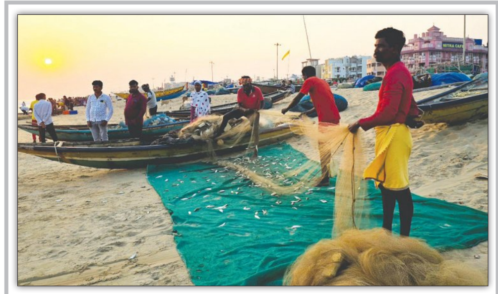
ପୁରୀ ସମୁଦ୍ର ବେଳାଭୂମିରେ ଡଙ୍ଗାରୁ ମାଛ ସଂଗ୍ରହ କରୁଛନ୍ତି ମତ୍ସ୍ୟଜୀବୀ

ପୁରୀ, ୧୭/୧୨ (ସମ୍ପାଦକ): ପୁରୀ ସହରର ସମସ୍ତ ପ୍ରବେଶ ପଥ ସହ ବିଭିନ୍ନ ପର୍ଯ୍ୟଟନସ୍ଥଳୀରେ ପୁଲିସ ପକ୍ଷରୁ ନାକା ଲଗାଯାଇ ଗାଡ଼ିଗୁଡ଼ିକୁ କଡ଼ାକଡ଼ି ଯାଞ୍ଚ ପର୍ଯ୍ୟଟକଙ୍କ ଆଗମନ ହେଉଛି । ଆଗକୁ ଆସୁଛି ବଡ଼ଦିନ ଓ ନୂଆବର୍ଷ । ଆହୁରି ଭକ୍ତ ଓ ପର୍ଯ୍ୟଟକଙ୍କ ସଂଖ୍ୟା ବଢ଼ିବ । ତେଣୁ ପର୍ଯ୍ୟଟକଙ୍କ ସୁରକ୍ଷା ଉପରେ ଗୁରୁତ୍ୱ ଦେଉଛି ପୁରୀ ପୁଲିସ । ଶ୍ରୀମନ୍ଦିର ସମେତ ପୁରୀ ବେଳାଭୂମି, କୋଣାର୍କ, ଚନ୍ଦ୍ରଭାଗା, ସାତପଡ଼ା ଆଦି ପୁରୀ ଜିଲ୍ଲାର ବିଭିନ୍ନ ପର୍ଯ୍ୟଟନସ୍ଥଳୀ ଏବଂ ବେଳାଭୂମିରେ ଅଧିକ ପୁଲିସ ଫୋର୍ସ ମୁତୟନ କରାଯାଇଛି । ପର୍ଯ୍ୟଟନସ୍ଥଳୀଗୁଡ଼ିକରେ ପାଟ୍ରୋଲିଂ କରିବା ସହିତ ଦାଗା ଅପରାଧୀଙ୍କ ବିରୋଧରେ କଡ଼ା କାର୍ଯ୍ୟାନୁଷ୍ଠାନ ନେବାକୁ ସମସ୍ତ ଥାନା ଅଧିକାରୀଙ୍କୁ ନିର୍ଦ୍ଦେଶ ଦେଇଛନ୍ତି ଏସ୍ ଏସ୍ ପ୍ରଡ଼ାକ୍ ସି । ବଡ଼ଦିନ ଓ ନୂଆବର୍ଷ ପ୍ରସ୍ତୁତି