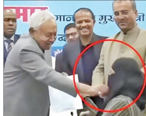
ରାଜ୍ୟରେ ମହିଳାମାନେ କେତେ ସୁରକ୍ଷିତ ରହିବେ ତିଡି କରନ୍ତୁ। ଏହି ଘଣ୍ଟା କାର୍ଯ୍ୟ ପାଇଁ ସେ ତୁରନ୍ତ ଇଣ୍ଡିଆ ଦେବା ଉଚିତ। ଏହି ଅଧିକାରୀ ଅଧିକାରୀଙ୍କୁ ନିର୍ଦ୍ଦେଶ ଦେଇଛନ୍ତି।