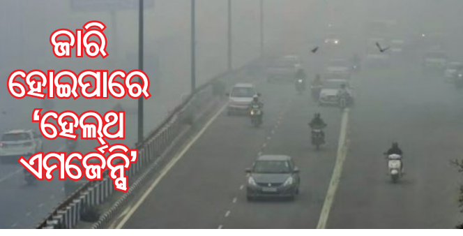
ଅଧିକ ସ୍ୱସ୍ତ ହୋଇଯାଇଛି । ଉତ୍ତରପଶ୍ଚିମ ଦିଲ୍ଲୀର ରୋହିଣୀରେ ଏକ୍ସପୋଜିଟ୍ ସର୍ବାଧିକ ୫୦୦ ଅଟିଥିବା ୪୯୯ ରେକର୍ଡ଼ ସ୍ତରରେ ରହିଛି । ଏଥିରେ କୌଣସି ପଦାର୍ଥ ୨.୫ (ପିଏମ୍ ୨.୫) ପ୍ରମାଣ ପ୍ରଦୂଷକ ଭାବେ ରହିଛି । ଏହାକୁ ବାଦ ଦେଇ ଜାହାଜୀରପୁରୀ ଓ ବିବେକ ବିହାରରେ ଏକ୍ସପୋଜିଟ୍ ୪୯୫ ରିପୋର୍ଡ଼ କରାଯାଇଛି । ଏକ୍ସପୋଜିଟ୍ ୫୦୦ ଅଟିଥିବା କଲେ ଏହାକୁ ଅତ୍ୟନ୍ତ ବିପଜ୍ଜନକ ବୋଲି ଘୋଷଣା କରାଯିବ ଓ ସାର୍ବଜନୀନ ସ୍ୱାସ୍ଥ୍ୟର ଜରୁରୀକାଳୀନ ସ୍ଥିତି ବାହେଲେ ଏମର୍ଜେନ୍ସି ଜାରି ହେବ । ଏଭଳି ପରିସ୍ଥିତି

■ ନୂଆଦିଲ୍ଲୀ, ୧୪।୧୨ (ଏକେଡି): ପ୍ରଦୂଷଣରେ ବେହାଲ ହେଲାଣି ରାଜଧାନୀ ନୂଆଦିଲ୍ଲୀ ଏବଂ ଏହାପାଇଁ ପ୍ରଦୂଷଣ ମାତ୍ରା ଏତେ ବଢ଼ିଯାଇଛି ଯେ ନିଃଶ୍ୱାସୀ ନେବାକୁ ମଧ୍ୟ କଷ୍ଟ ଲାଗୁଛି । ମଧ୍ୟାହ୍ନରେ ବି କୁହୁଡ଼ିର ଭ୍ରମ ସୃଷ୍ଟି ହେଉଛି । ବିଷାକ୍ତ ଧୂଆଁର ଚାନ୍ଦର ଦିଲ୍ଲୀବାସୀଙ୍କୁ କଳବଳ କରୁଛି । ଦିଲ୍ଲୀରେ ଏୟାର କ୍ୱାଲିଟି ଇଣ୍ଡେକ୍ସ ବା ପ୍ରଦୂଷଣ ମାତ୍ରା ୪୯୧ରେ ପହଞ୍ଚିଛି, ଯାହାକି ବିପଦ ସ୍ତର ରୂପେ ବିବେଚିତ କରାଯାଏ । ଆଜି ସକାଳ ୬ଟାରେ ଏହା ୪୨୨ ସ୍ତରରେ ପହଞ୍ଚିଥିଲା ବୋଲି ପ୍ରଦୂଷଣ ନିୟନ୍ତ୍ରଣ ବୋର୍ଡ଼ ପକ୍ଷରୁ ଜଣାପଡ଼ିଛି । ଦିଲ୍ଲୀର ସବୁ ୪୦ଟି ମିନିଟରୀ ସ୍ଟେସନରେ ଲାଲ ରଙ୍ଗ ଦେଖିବାକୁ ମିଳିଛି । ଏକ୍ସପୋଜିଟ୍ ଉପରେ ଚଳିଥିବା